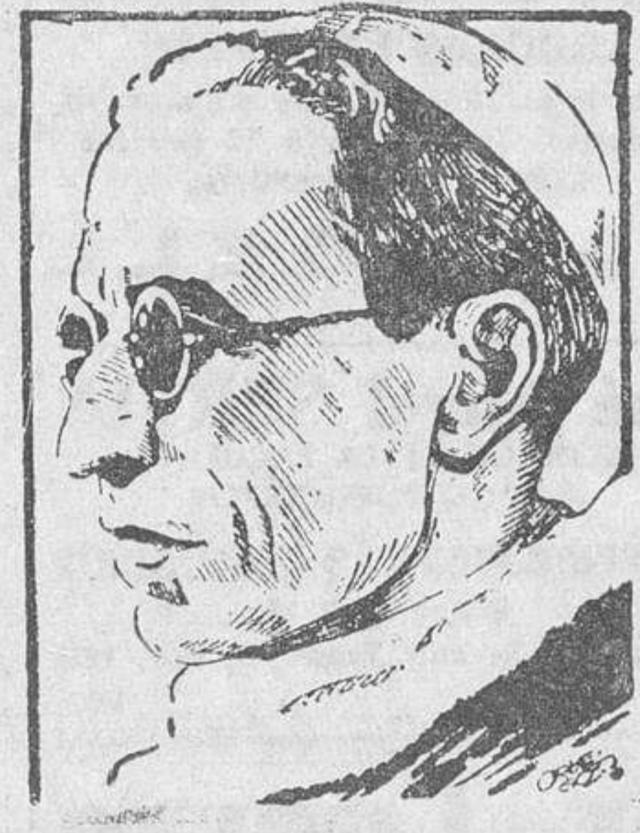
Orden de Siervas de San Andrés.

Omnnes", al oír lo cual todos los miembros de la Corte pontificia abandonaron el salón. Respighi fué el último en salir y cerró tras sí la puerta, quedando solos en el aula consistorial Su Santidad el Papa y los antiguos cardenales. Su Santidad Pío XII pronunció entonces la tradicional plática, diciendo Adsumus (estamos presentes), con que invoca la ayuda del Espíritu Santo. Inmediatamente invitó al cardenal Carlos Salotti, prefecto de la Sagrada Congregación de Ritos a acercarse y dar su informe sobre los preparativos hechos en la canonización de los cuatro beatos siguientes: Javiera Cairini, Elizabeth Bichie, des Agés, Juan de Brito y Bernardino Realino. El cardenal Salotti expuso, en latín, el informe completo sobre las propuestas canonizaciones y relató las virtudes y milagros aprobados de los cuatro beatos. Terminado el informe, todos los cardenales se levantaron por turno y pronunciaron el tradicional "placeat" (apruebo).