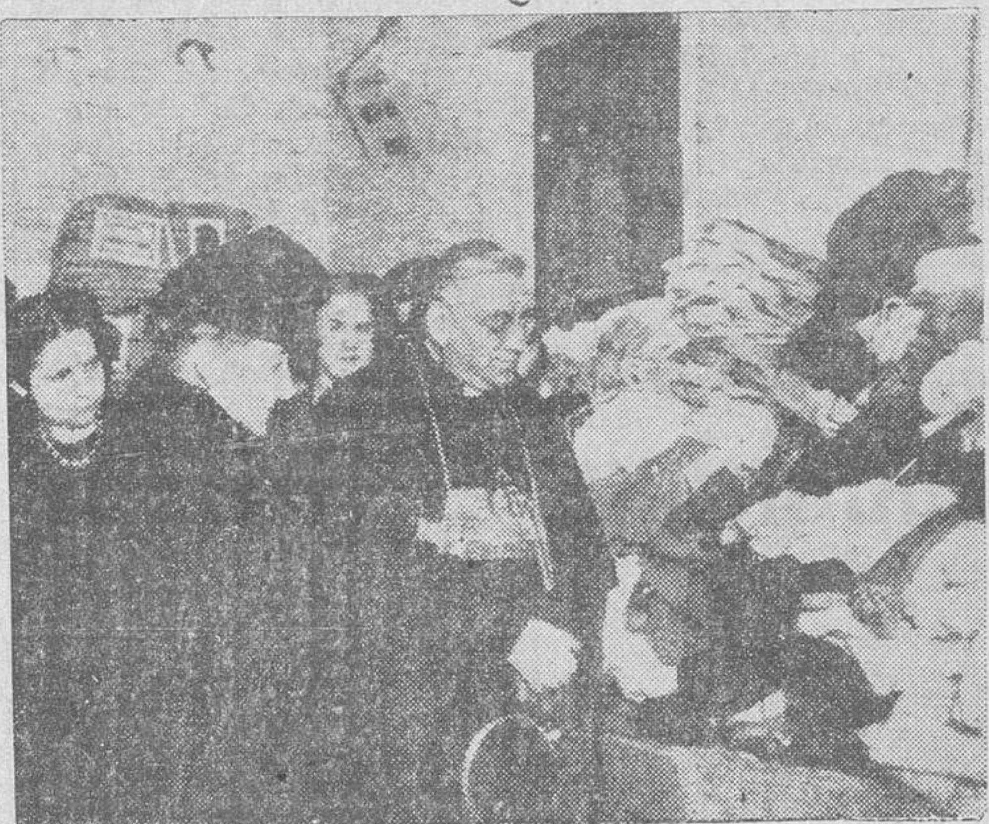
El Nuncio de Su Santidad, monseñor Cicognani, visitando los almacenes de ropas que ya han salido para Roma y que constituyen el donativo de las mujeres españolas de Acción Católica al Papa, para auxiliar a los damnificados por la guerra