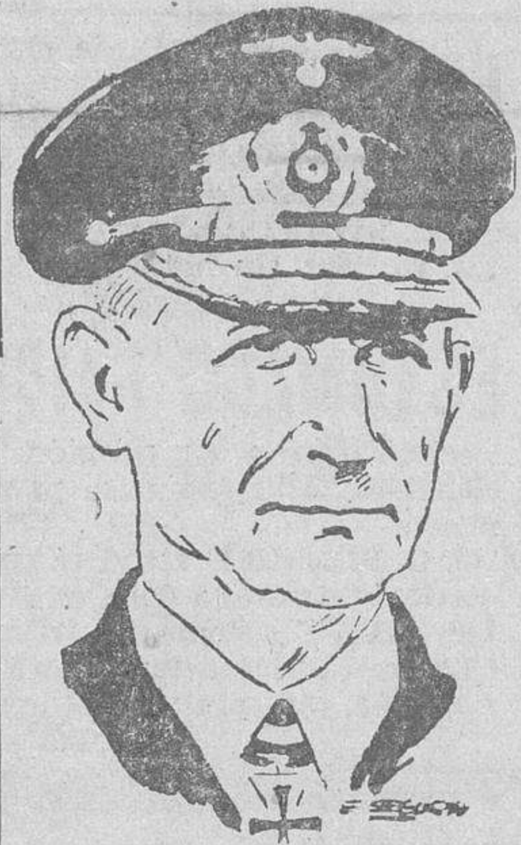
Según un diario naval de 1944, Doenitz entrenó a jóvenes oficiales sin piedad, y día tras día, y noche tras noche, y en su entusiasmo llegó hasta embarcar en uno de los submarinos para ensayar directamente el manejo de estas armas y calcular el espíritu necesario en aquellos hombres que hablan de combatir los submarinos durante la guerra. Para demostrar el fanático apoyo de Doenitz al Führer y al régimen nazi, el fiscal le recordó un discurso que el almirante pronunció en marzo de 1945, el Día de los Héroes, en el cual dijo: "¿Qué ocurriría a nuestro país si el Führer no nos hubiese unido bajo el nacionalsocialismo?" Y a raíz del atentado contra Hitler, el 20 de julio de 1944, hizo pública esta manifestación: «Un odio sin límites llena nuestros corazones a causa del intento criminal que podía haber costado la vida de nuestro querido Führer».