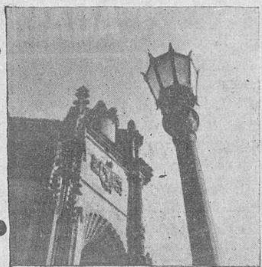
Iluminación de la ciudad.

Ibamos tardando mucho en hacer el elogio de la ciudad iluminada. Sentíamos una especie de temor de que todo ello fuera tan solo resultado de nuestras impacencias y hasta quizá nos pareciera un sueño del que no queríamos despertar. Pero no es un producto de la fantasía después de casi seis meses de penumbra. La ciudad—sus calles principales—están llenas de luz. Una nueva vida, vida alegre que no puede exteriorizarse en las sombras, nos ha llegado con el año recién estrenado. La ciudad recobra su aspecto normal. Los comercios iluminan sus escaparates y de todos los lugares sale la luz, sin restricciones, cobrándonos de las fatigas pasadas. Ya no hay apagones periódicos y a hora fija, ni hosquedad en los ambientes, ni desesperación en los que forzosamente tenían que trabajar al tenue resplandor de una vela o del antiestético carburo. Para cerrar la caja y hacer los números de la jornada.