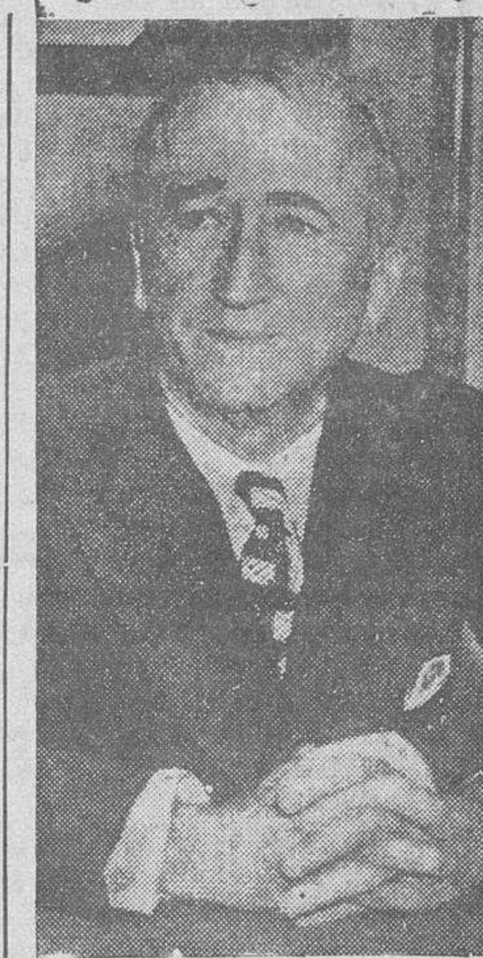
Continúa en cuarta plana.

Es nuestro deseo —finalizó— que las instituciones que hemos creado ayuden a todos a reconstruir un mundo en ru-