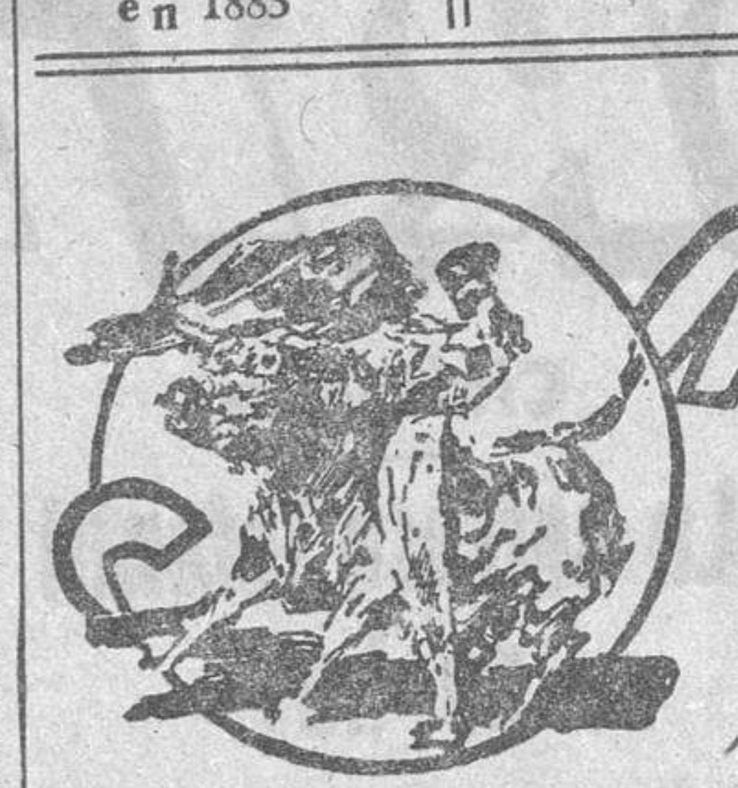
LAS CORRIDAS DE AYER

Las dos terceras partes de las cantidades así anticipadas serán satisfechas a la Empresa por la Caja de Compensación del Paro por escasez de energía eléctrica, y la otra tercera parte será abonada por la misma Empresa, si bien los trabajadores tienen la obligación de recuperar las horas perdidas, trabajando al efecto a razón de horas extraordinarias por jornada cuando las circunstancias lo permitan.