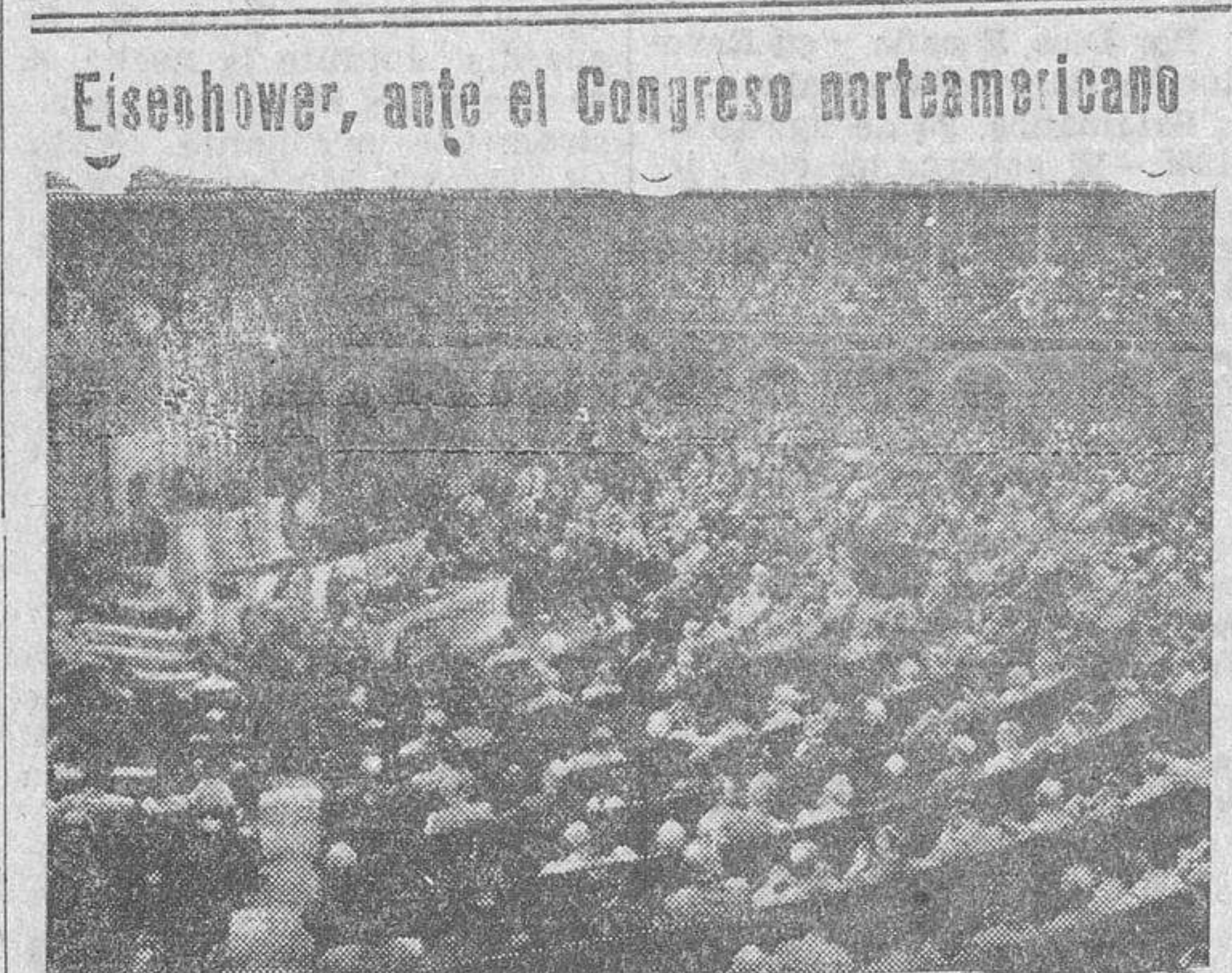
Eisenhower, ante el Congreso norteamericano

BENEFICIARIO DE VIVIENDA PROTEGIDA Si quieres que, en caso de ocurrir tu muerte prematura, la vivienda pase a tu esposa o hijos, sin afectar nuevos desembolsos, contrata en seguida el SEGURO DE AMORTIZACION DE PRESTAMOS de la Instituto Nacional de Previsión (Servicio de Seguros Libres). Informes, en su Delegación, Plaza de los Baños, 8.