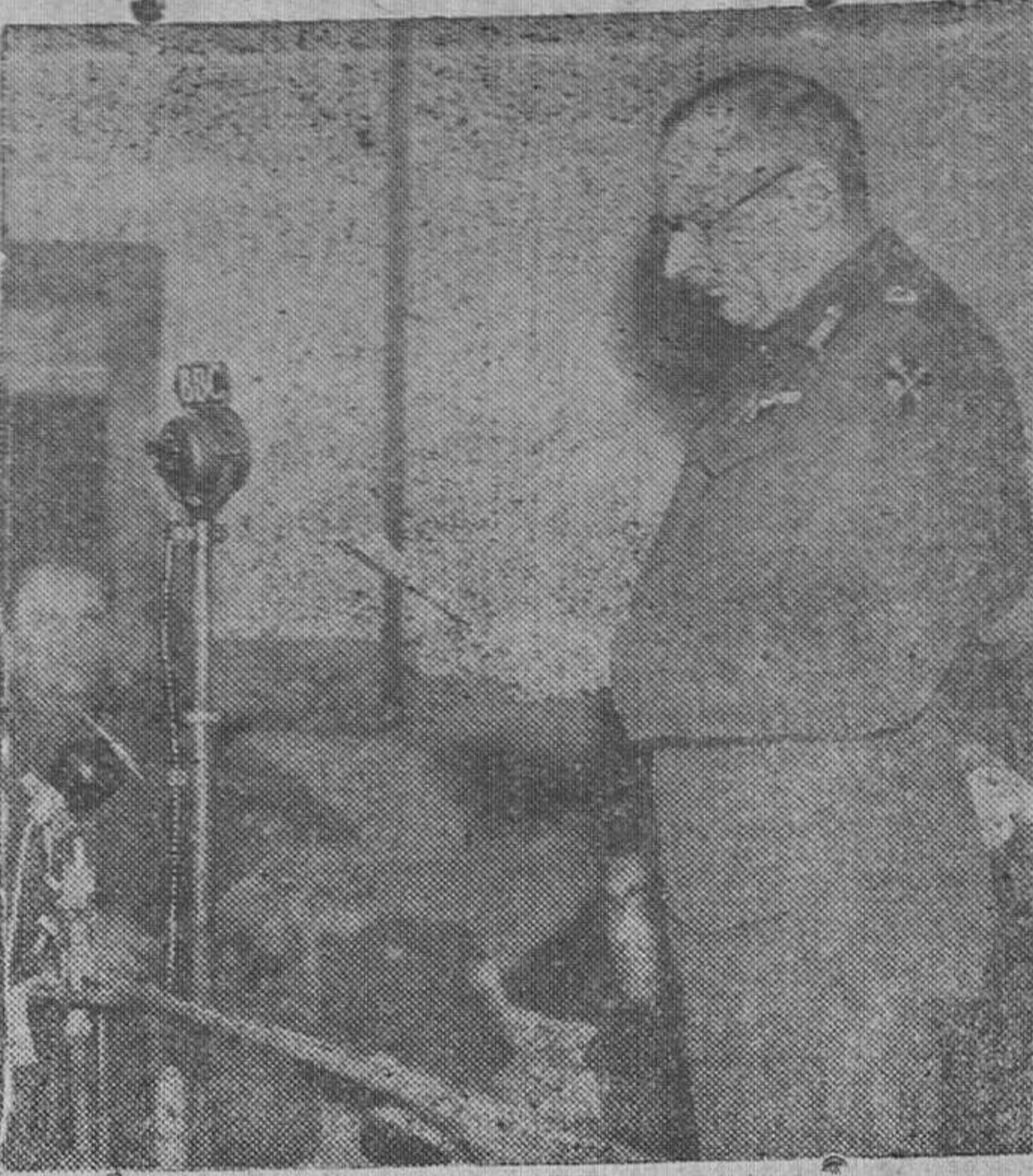
El mariscal Montgomery, leyendo un mensaje radiado a sus tropas, en el frente occidental