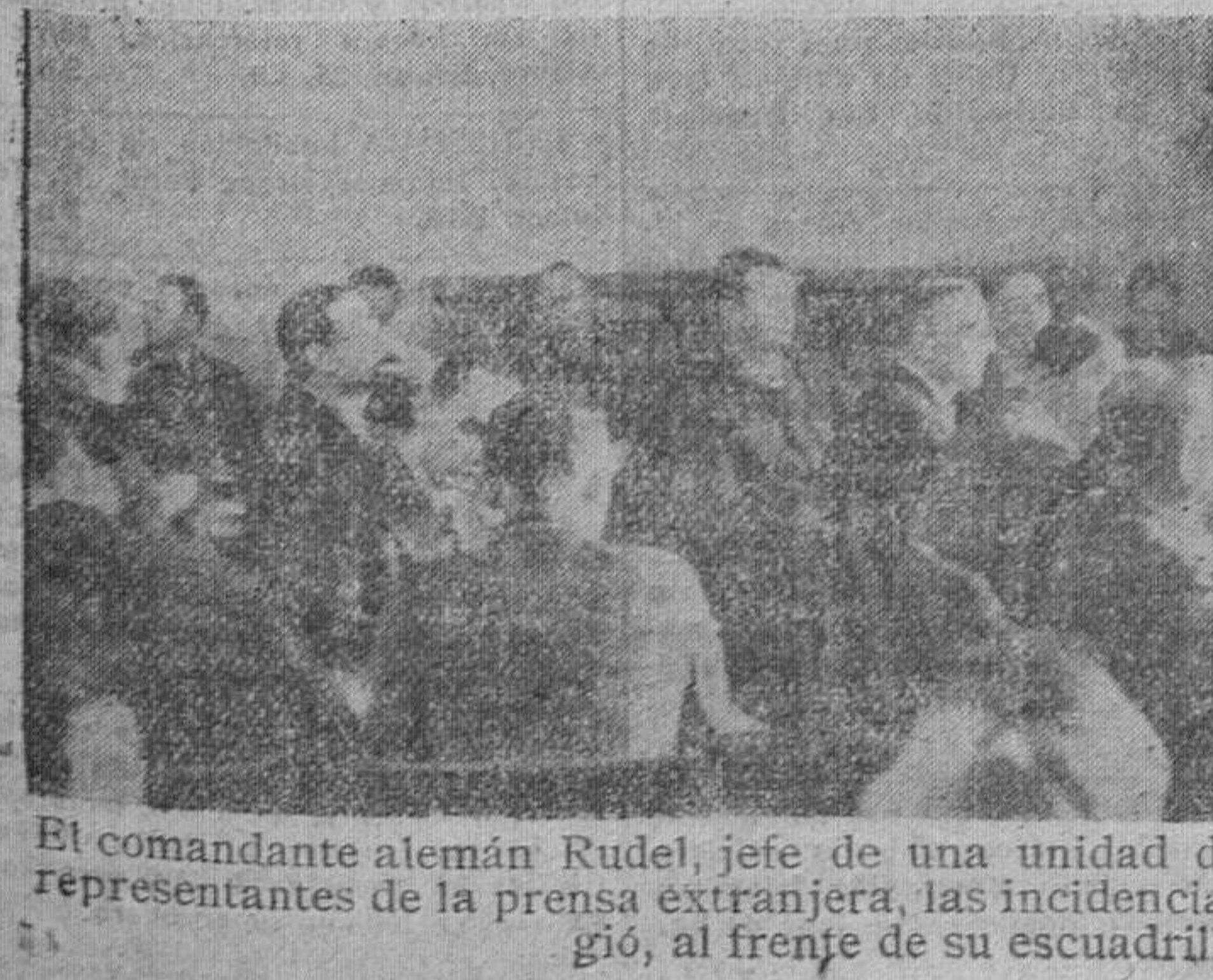
El comandante alemán Rudel, jefe de una unidad de aviación, relata ante los representantes de la prensa extranjera, las incidencias de una acción que dirigió, al frente de su escuadrilla

Ciudad reconquistada por los alemanes Berlín. — Las tropas alemanas han roto por nuevos puntos el sistema defensivo soviético de la cabeza de puente de Gran, al este de Komorn, según anuncia la Oficina de Información Internacional desde el frente húngaro. La ciudad de Parcani, al norte del Danubio, ha sido reconquistada por las columnas alemanas, después de una breve lucha cuerpo a cuerpo. (Efe.)