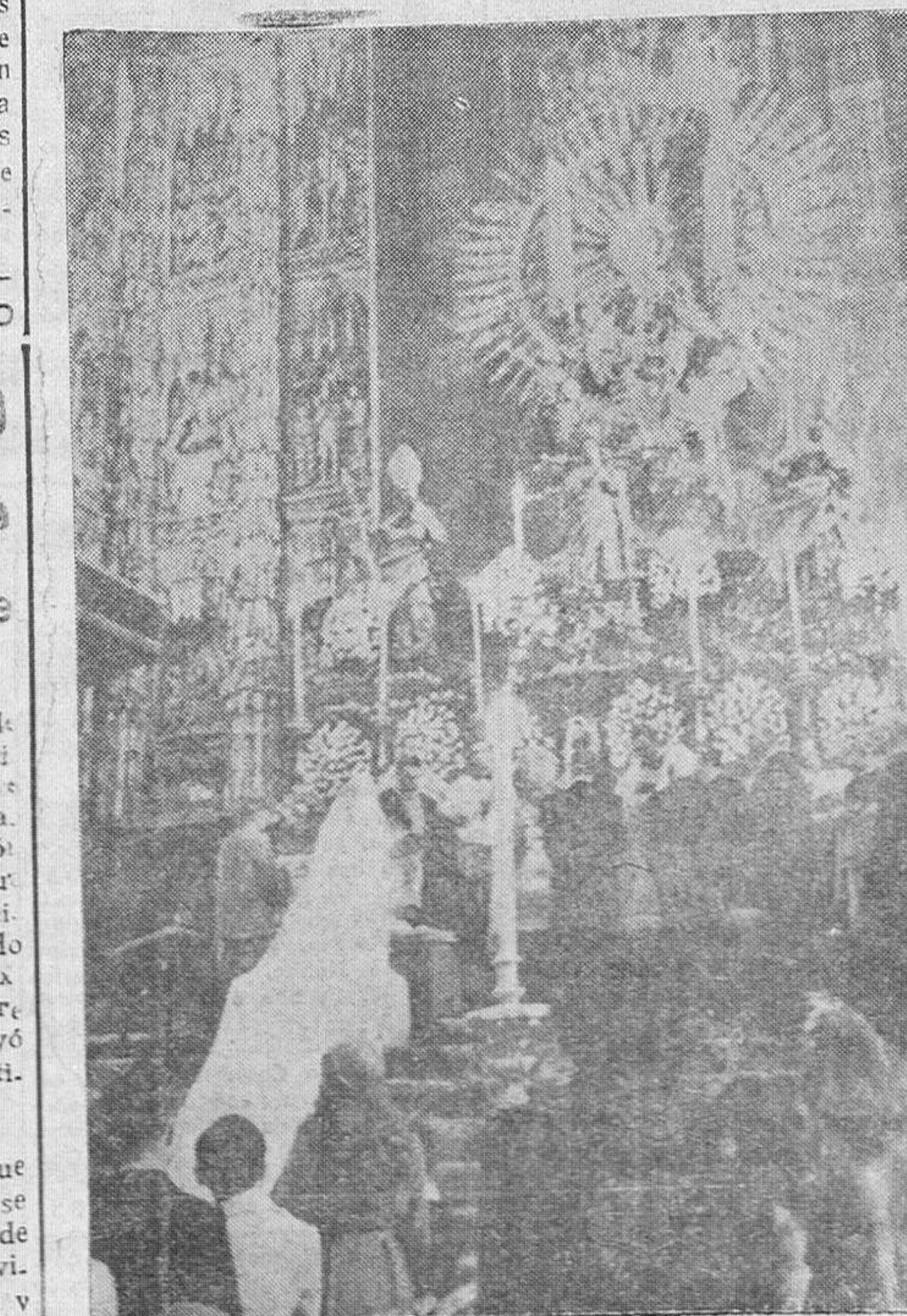
Aspecto que ofrecía el altar mayor de la Catedral de Sevilla durante el enlace matrimonial de S.S. AA. RR. los príncipes doña Esperanza de Borbón y Orleans y don Pedro de Orleans Braganza