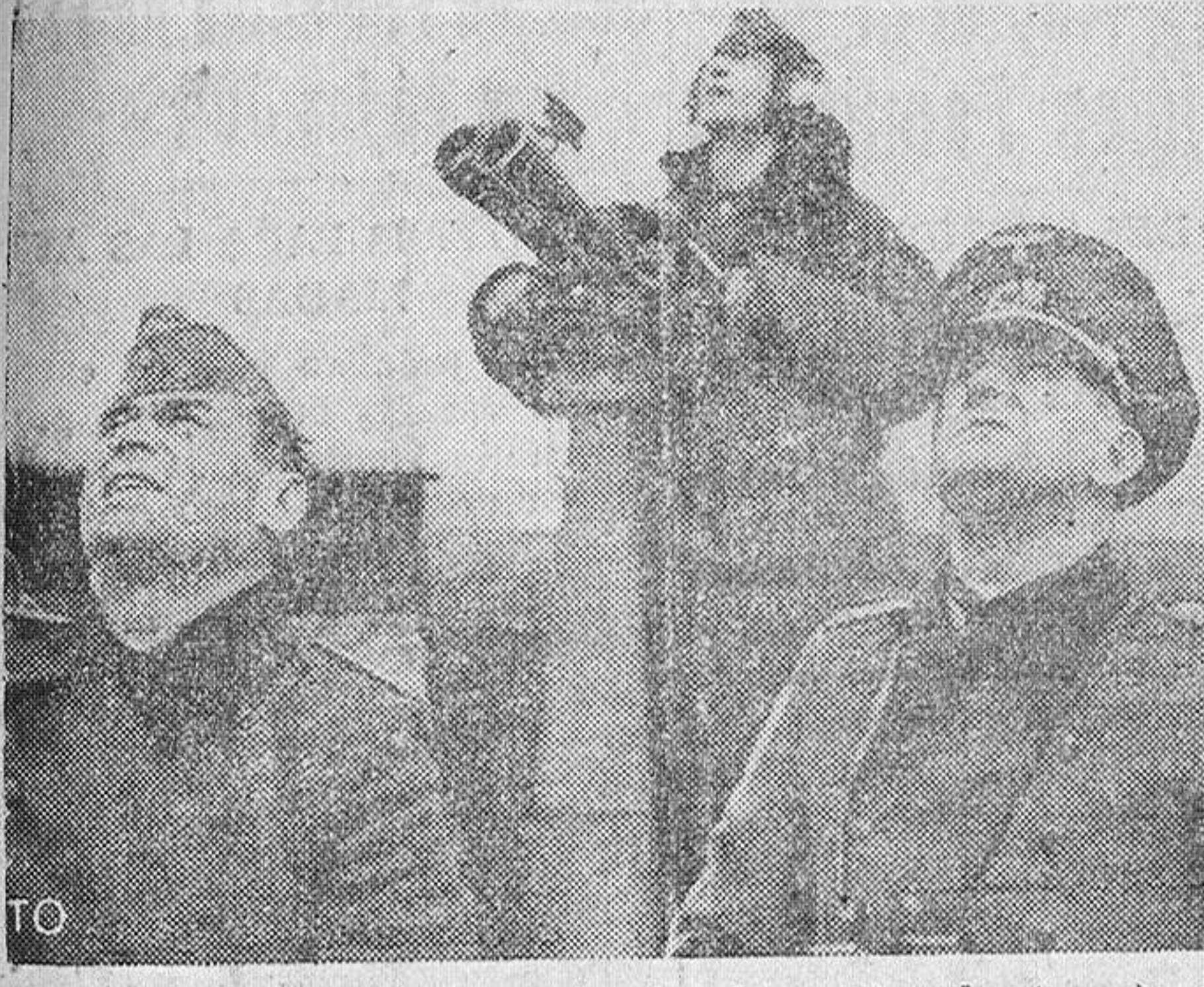
El comandante observa desde el puesto de mando de una batería de costa alemana la ruta de los proyectiles disparados contra las líneas del frente occidental.