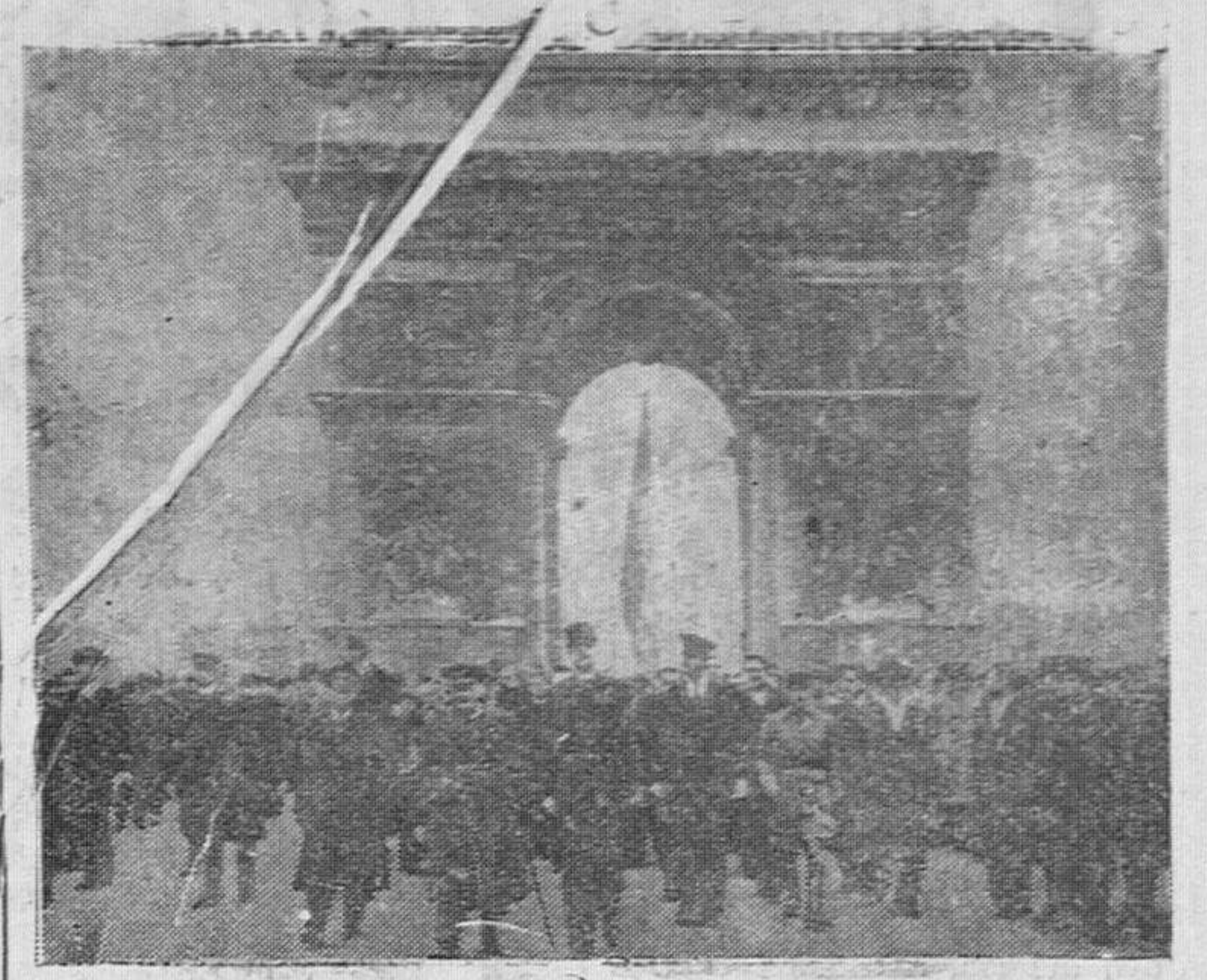
El primer ministro británico, mister Churchill, acompañado del general De Gaulle, visita la tumba del Soldado Desconocido durante su último viaje a París