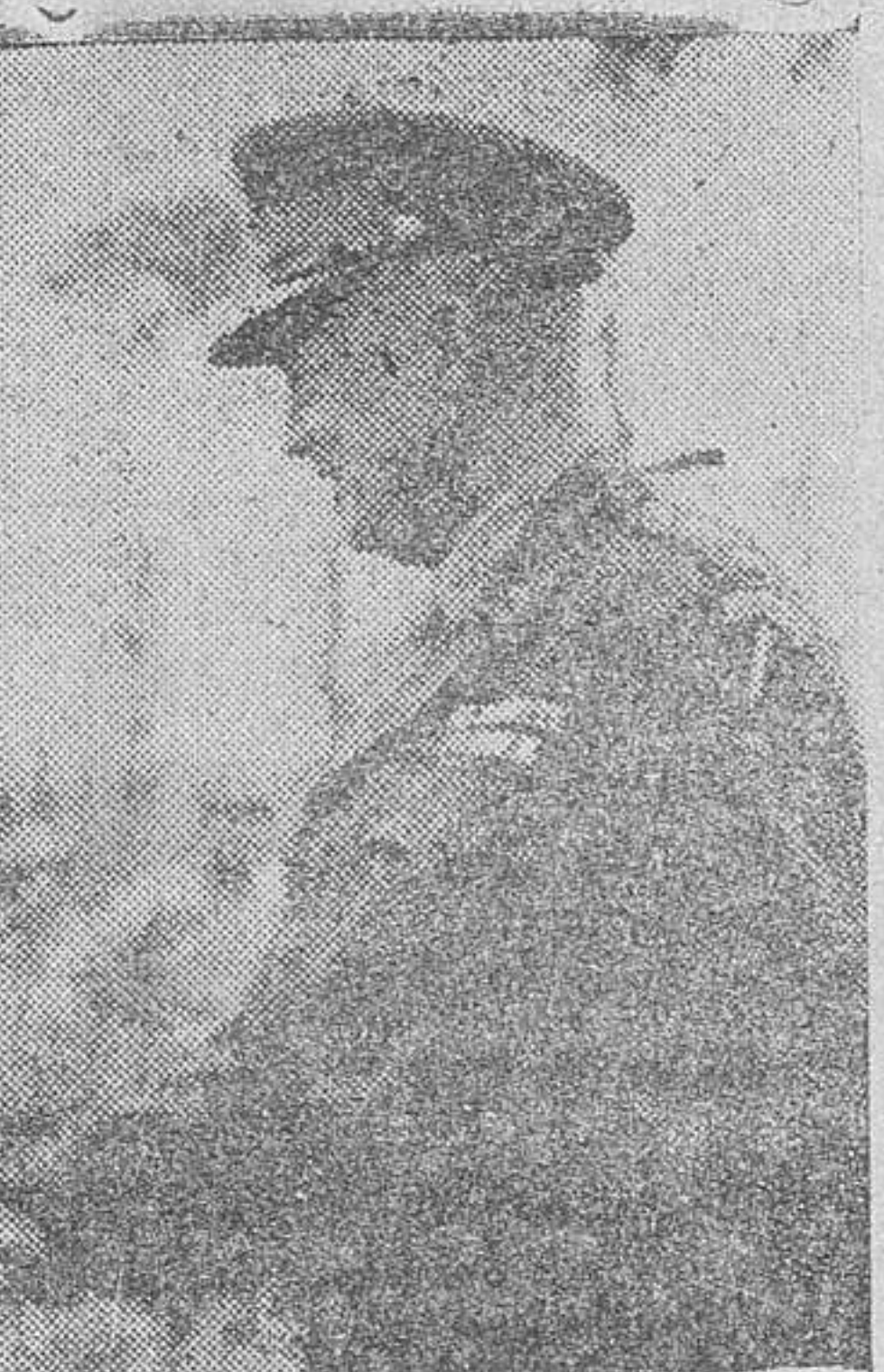
El general Eisenhower, comandante supremo de las fuerzas de invasión, felicitando al general Bradley, comandante de las fuerzas norteamericanas que combaten en el norte de Francia, por su reciente asome-