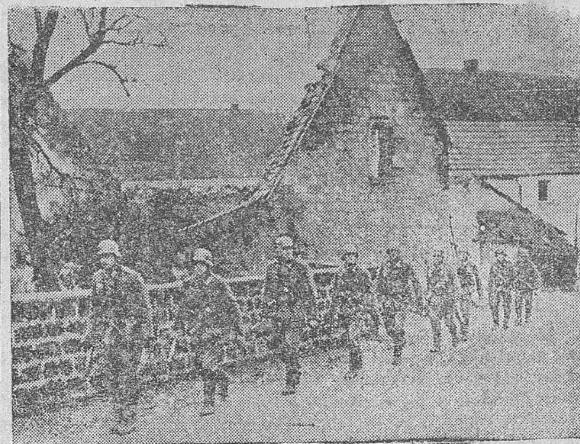
Un grupo de choque de granaderos alemanes se dirige a través de las calles de un pueblo, a la descubierta, para verificar una acción de patrulla.