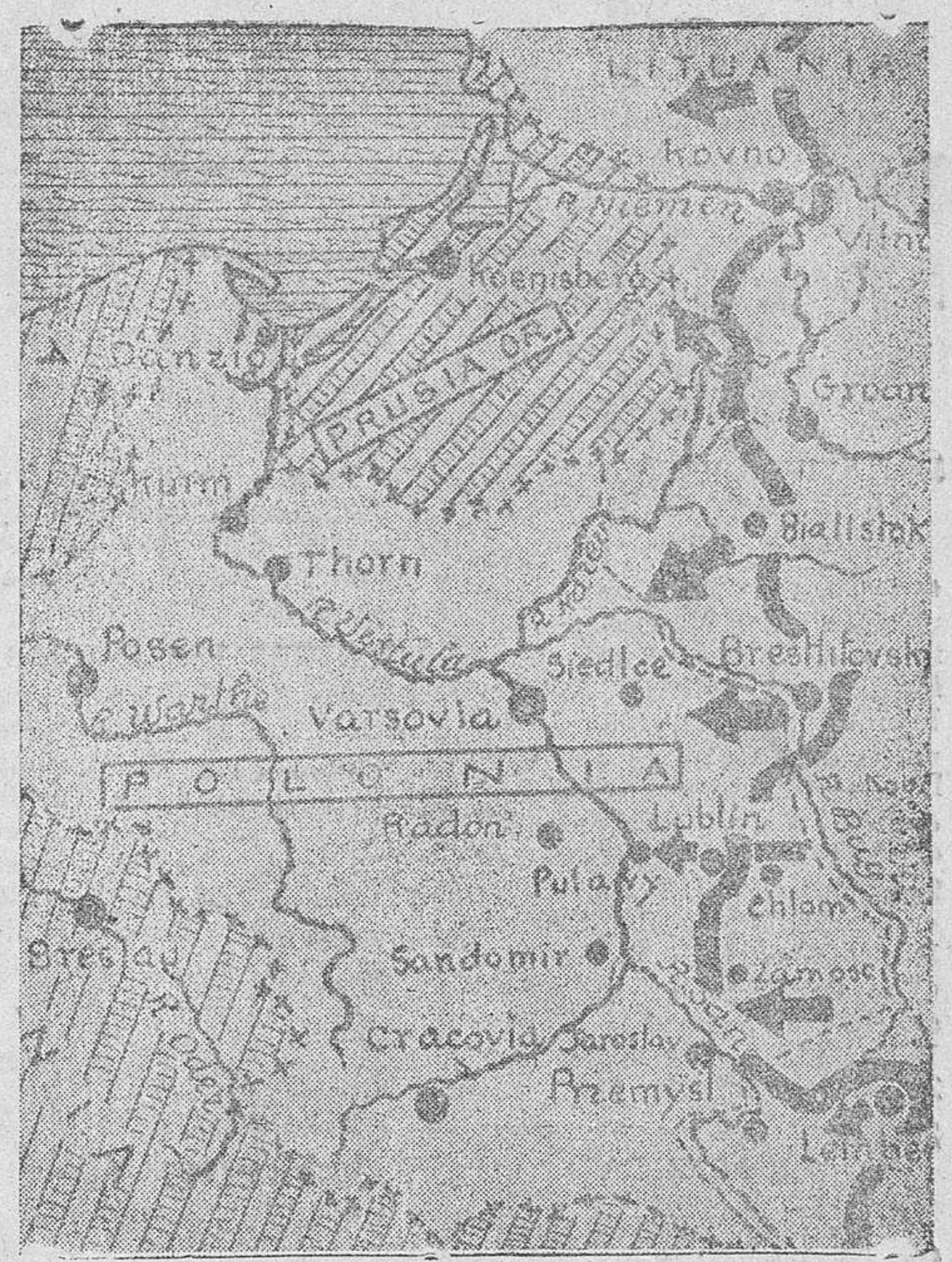
En el croquis se indican con líneas de cruces las fronteras de Alemania al comienzo del actual conflicto. La línea de trazos, que desde Prusia salta al Narv y se cibe luego al Bug, es la que Berlín adoptó luego de su victoriosa campaña contra Polonia, país que antes de su derrota llegaba, por Occidente, hasta Posmania (Posen pasó a ser polaca después de la guerra de 1914-18), teniendo, a lo largo del llamado pasillo de Danzig, una salida al Báltico.