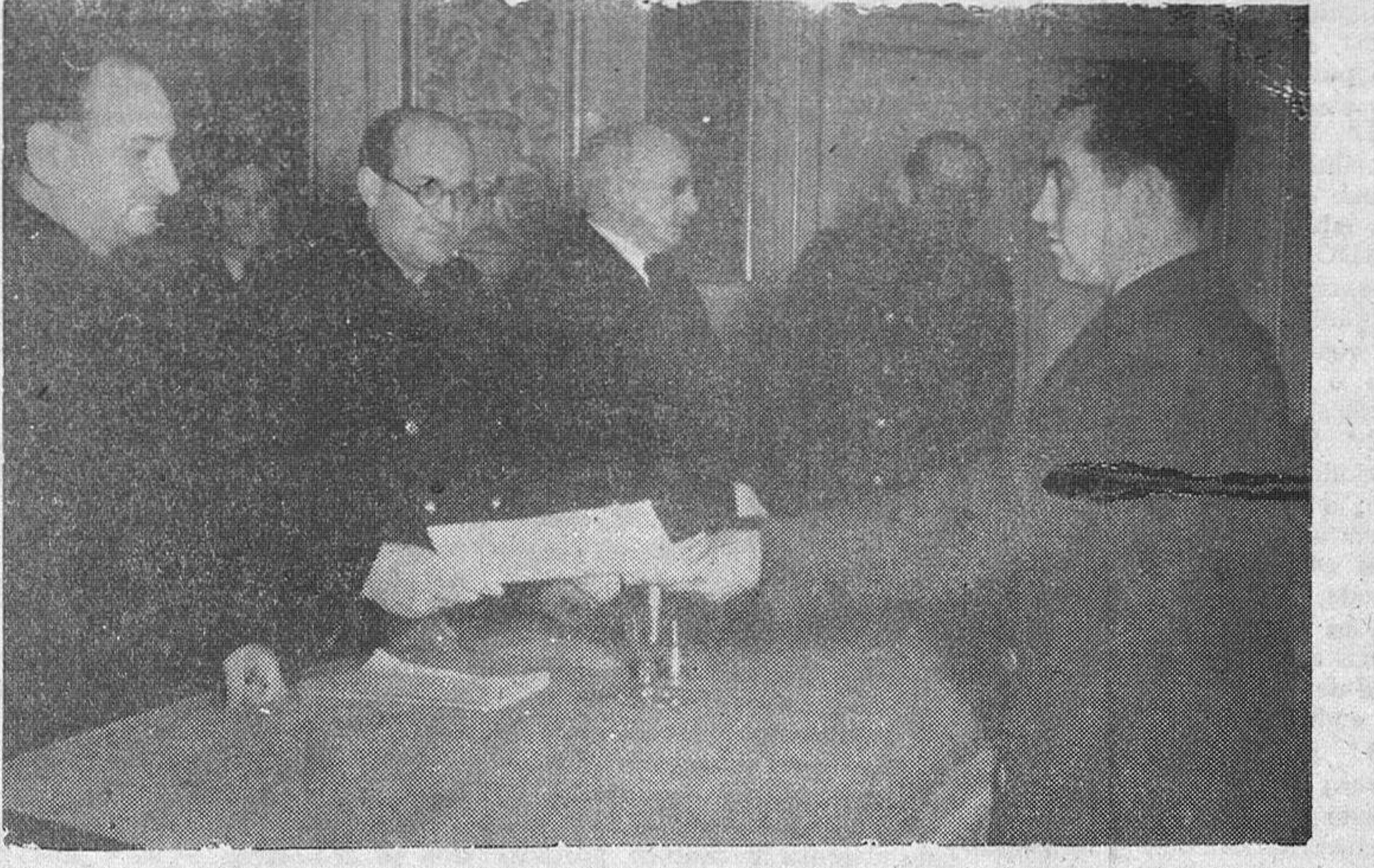
En el paraninfo de la Universidad Central tuvo lugar, el pasado martes, un solemne acto con motivo de celebrarse la festividad del Patrono de los estudiantes, al que asistieron los ministros secretario general del Movimiento y Educación Nacional, jefe nacional del S. E. U., rector de la Universidad y otras autoridades y jerarquías. El ministro secretario, entregando las becas "Alejandro Salazar".