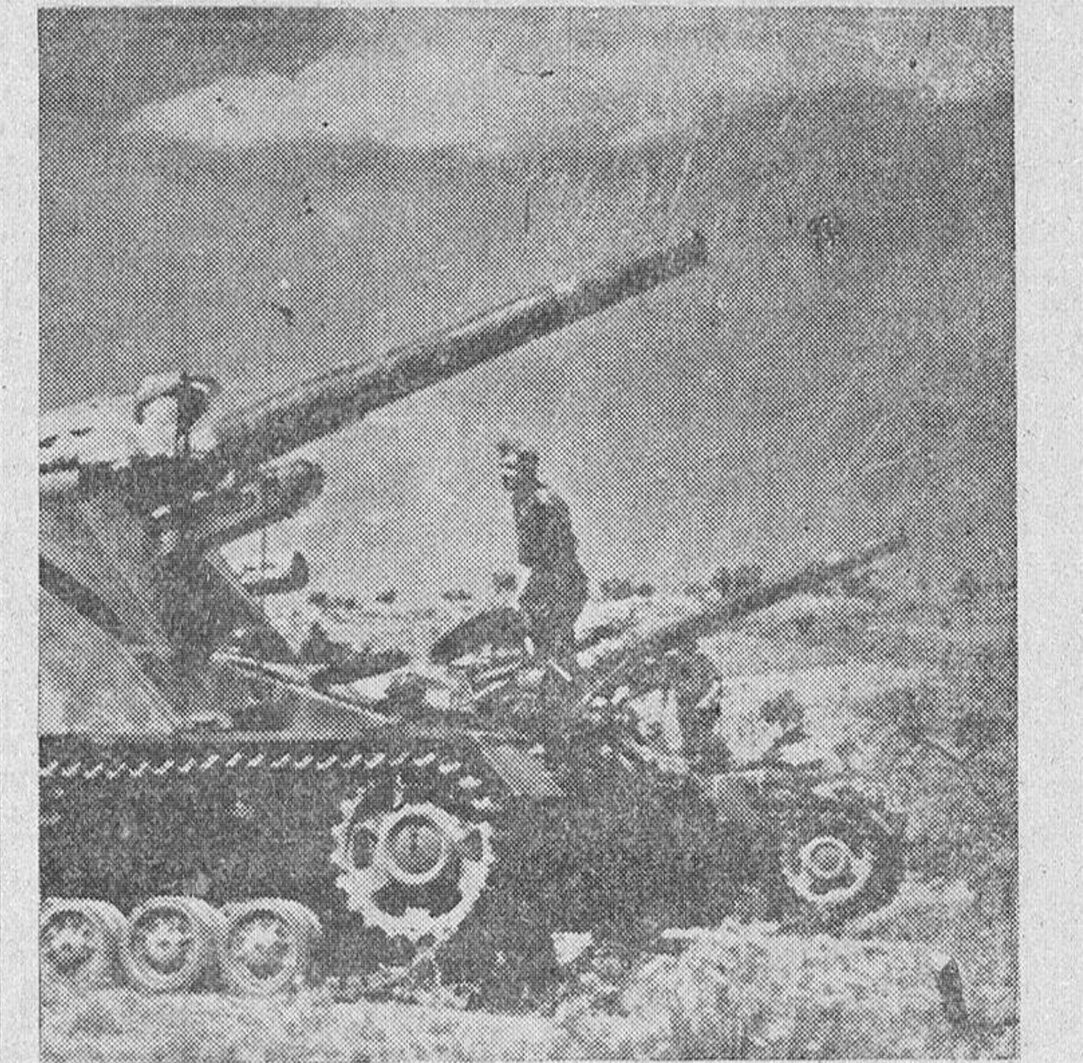
Cañones alemanes, con fuerte blindaje, escalonados a lo largo de la costa francesa, para la defensa en caso de ataque.

combates con todas las características de la campaña de invierno y de la guerra de movimientos. Las fuerzas blindadas y de infantería alemanas penetraron en un solo día más de 50 kilómetros en los dispositivos defensivos soviéticos sin encontrar resistencia alguna.