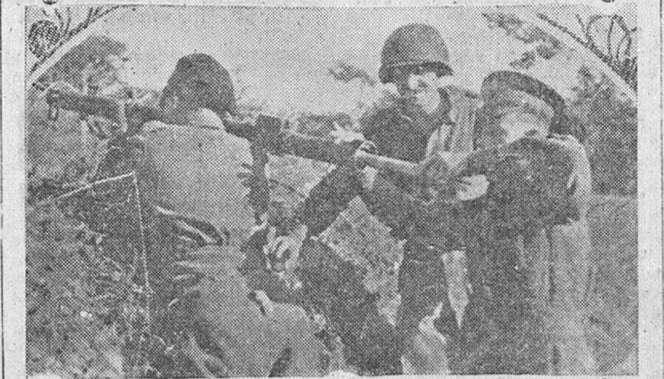
Un americano, explicando a las tropas inglesas la manera de usar el "Bazooka", fusil cohete, como arma antitanque. Son necesarios dos hombres para su manejo, y ha dado excelentes resultados.