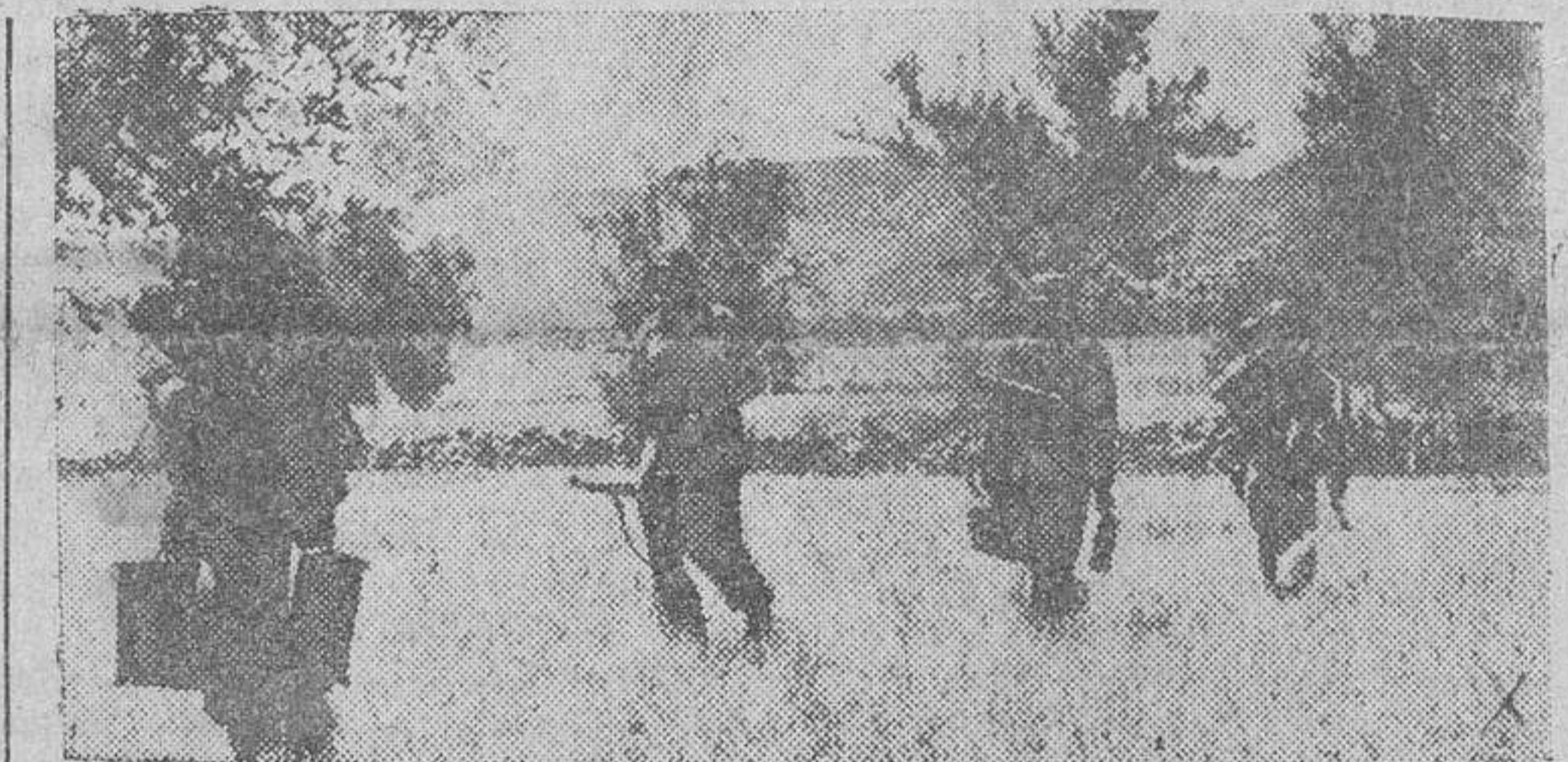
Con toda la impedimenta, una patrulla del Ejército del Reich reconoce el terreno de nuevas operaciones.

Comunicado alemán. Gran Cuartel General del Fuhrer.— El Alto Mando de las fuerzas armadas alemanas comunica: "Al norte del Mar de Azof al este del Dnieper medio, en el Desna y en la región de Smolensko, nuestras tropas libraron, ayer también, duros combates contra poderosas fuerza de infantería y elementos blindados soviéticos. En el curso de estas operaciones han sido destruidos 77 carros blindados de un grupo de choque enemigo, compuesto de unos cien carros, en el sector de un cuerpo de ejército. En los duros combates del norte del Mar de Azof, se han distinguido especialmente, el 10 de septiembre, la división de infantería de Franconia, número 17, y la 111 de la baja Sajonia. Algunos aviones adversarios han hostilizado anoche el territorio del Reich, y han lanzado bombas aisladas, que no han causado más que daños insignificantes." (Efe.) Violentos combates entre el Donetz y el Dnieper. Berlín.— La gran batalla que se desarrolla en el frente del Este, entre los ríos Donetz y Dnieper, continúa con los mismos caracteres de violencia, según se declara en los círculos militares berlineses. Los soviets — agregan — envían nuevos contingentes en gran cantidad de material a los puntos neurálgicos y posiciones de más importancia es-