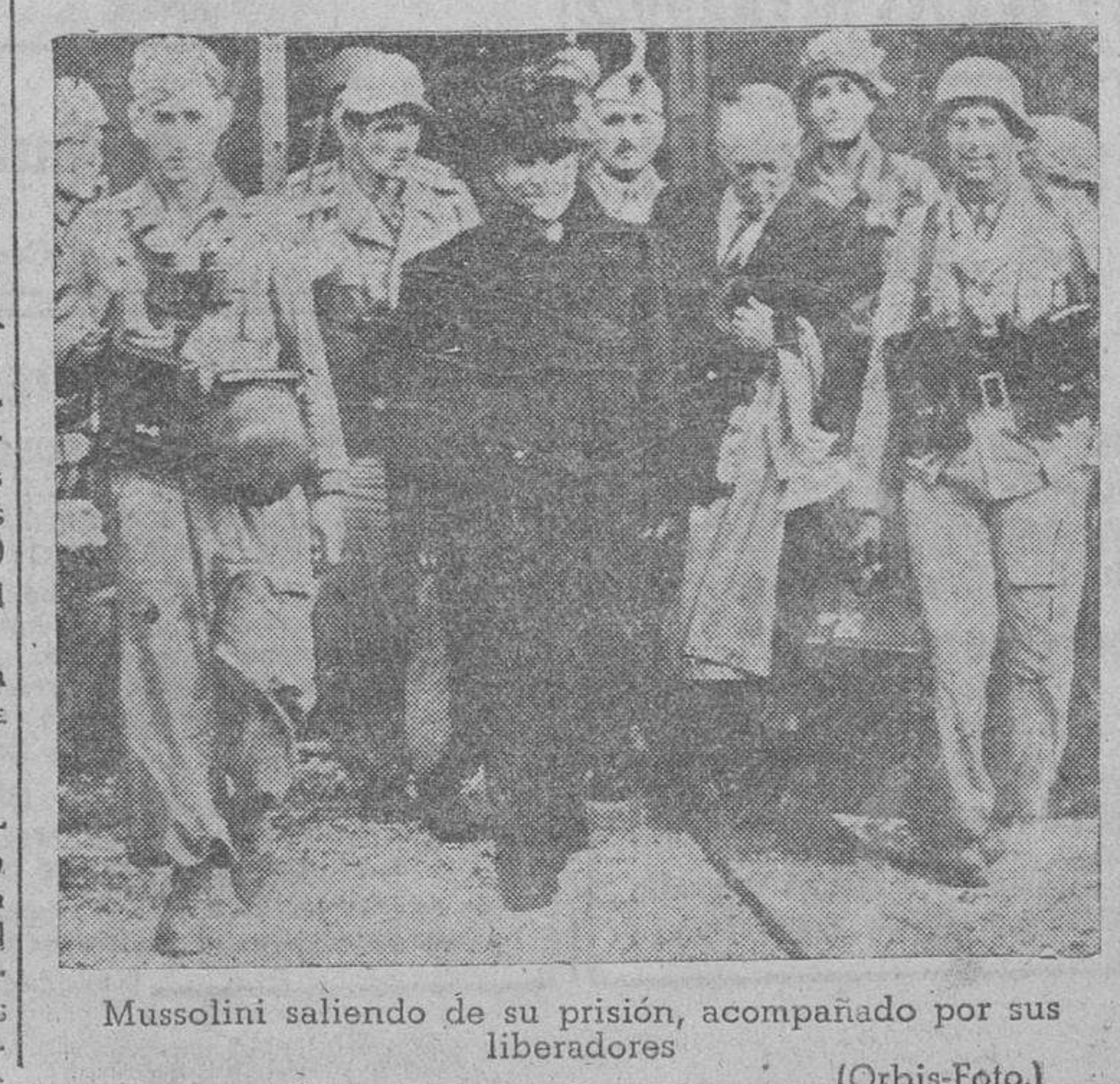
Mussolini saliendo de su prisión, acompañado por sus liberadores.