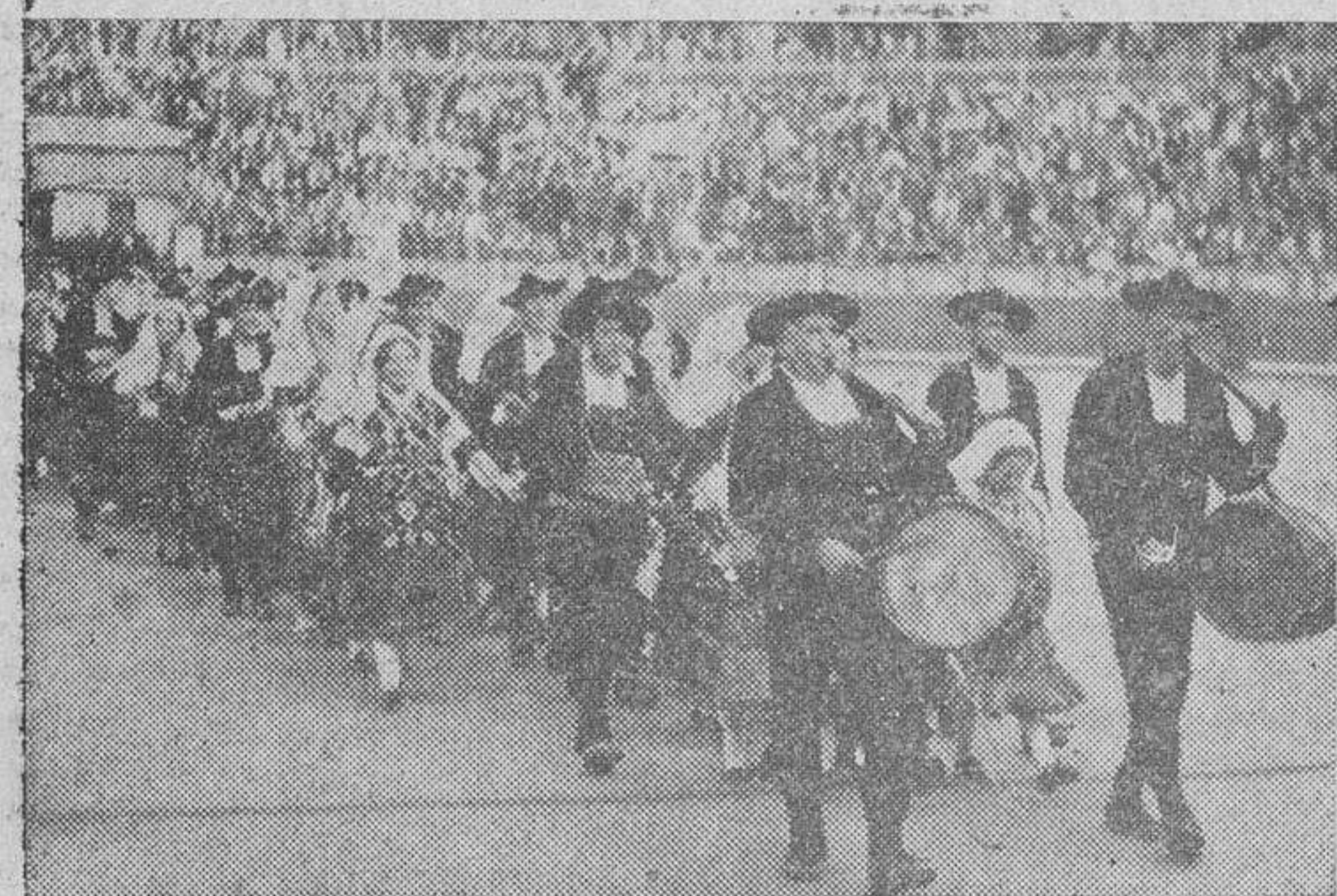
El grupo de charros desfilando por el ruedo antes de empezar la corrida.