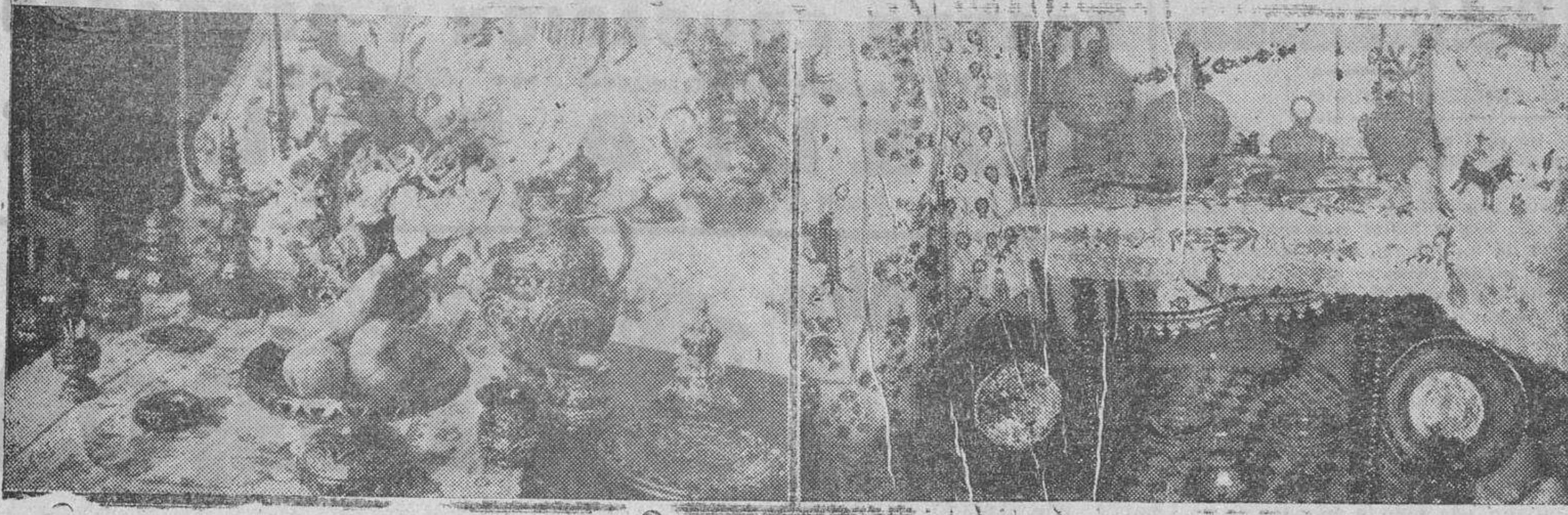
En los locales de la Oficina de Turismo está llamando estos días poderosamente la atención la exposición de artesanía salmantina, en la que destacan especialmente los trabajos de los alfareros de Alba de Tormes, que han hecho primorosas vajillas de barro vidriado color marrón con adornos amarillos. La exposición, instalada con exquisito gusto por la Obra Sindical de Artesanía, está siendo visitadísima