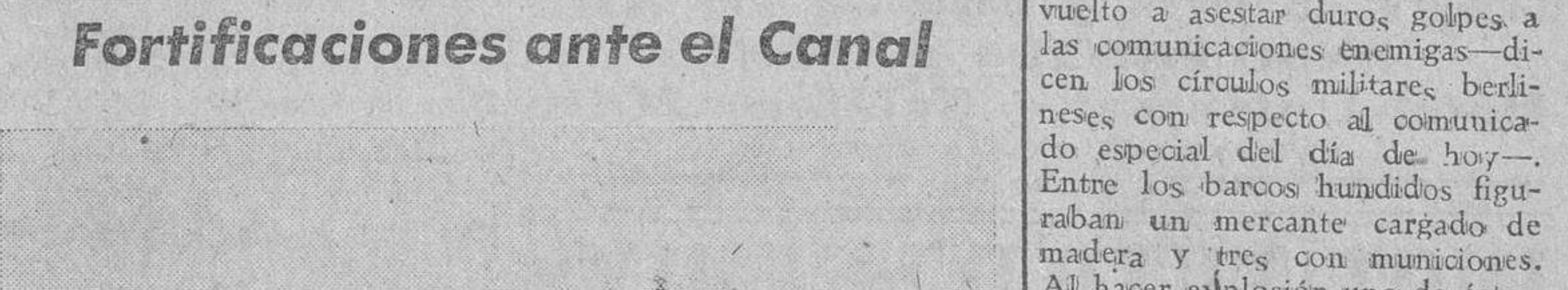
A todo lo largo de la costa del Canal de la Mancha, han sido construídas potentes fortificaciones, como la que recoge la foto, para una posición artillera de largo alcance

Berlin.—"En los amplios espacios atlánticos, en aguas de Groenlandia, Tierranueva, Estados Unidos y África Occidental, los submarinos alemanes han vuelto a asestar duros golpes a las comunicaciones enemigas—dicen los círculos militares, berlineses, con respecto al comunicado especial del día de hoy—. Entre los barcos hundidos figuraban un mercante cargado de madera y tres con municiones. Al hacer explosión uno de éstos, fue posible ver cómo salían proyectados a varios centenares de metros de altura los cuerpos de algunos de sus tripulantes. También fue echado a pique un barco de 7.000 toneladas, de los que se construyen actualmente en los Estados Unidos.