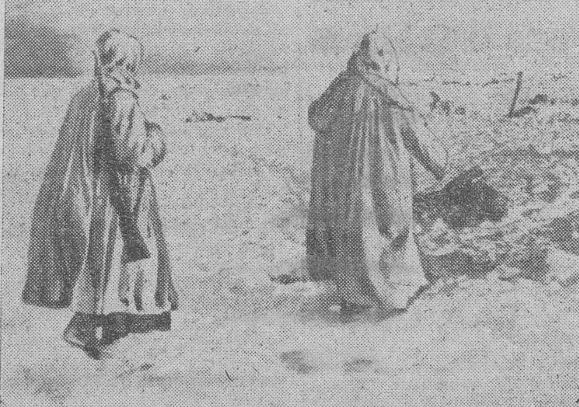
Después del ataque nocturno de los bolcheviques, con las primeras luces de la mañana, los soldados alemanes realizan el servicio de reconocimiento, entre los cadáveres que dejaron abandonados en el frustrado asalto a la posición