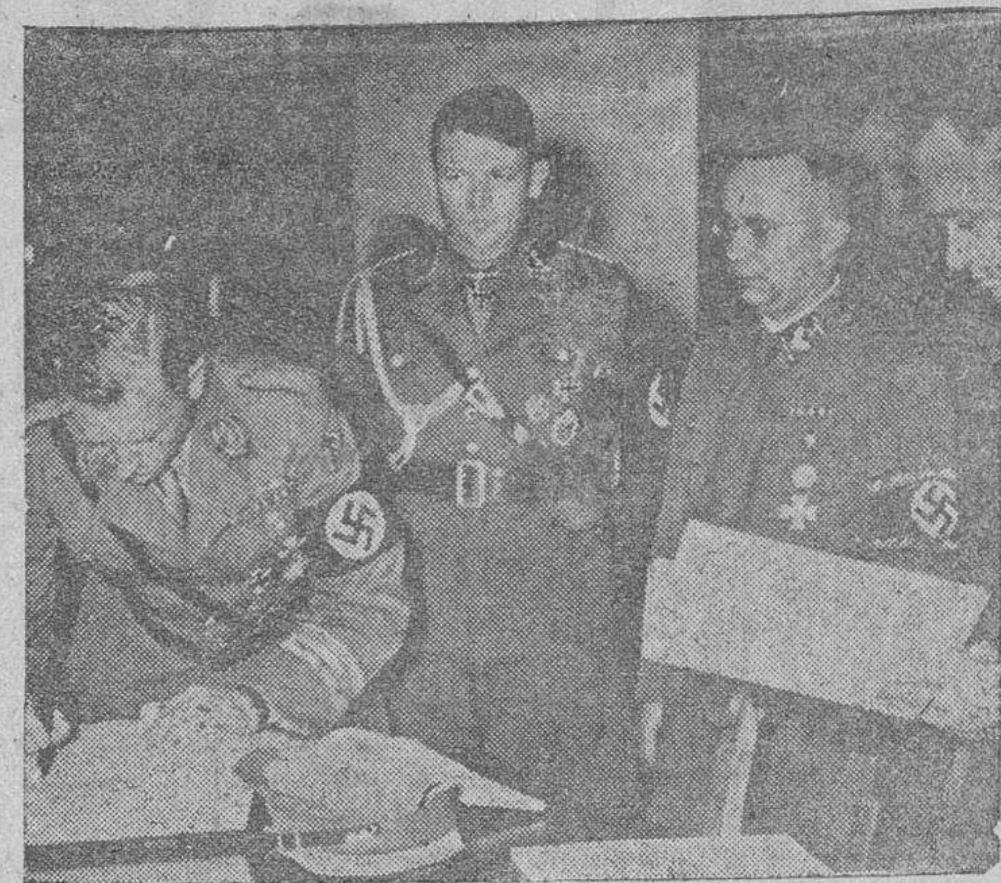
El jefe de Estado Mayor de la S.A., Víctor Lütze, visitó el grupo de la S.A. en el Vistula. En esta ocasión firmó el libro de oro de la ciudad de Thorn.