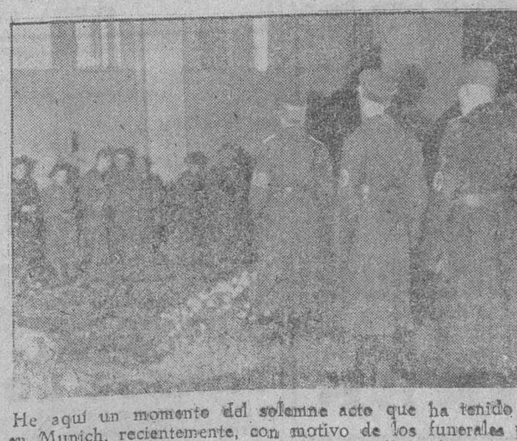
He aquí un momento del solemne acto que ha tenido lugar en Múnich, recientemente, con motivo de los funerales por el ministro presidente alemán Siebert, que falleció hace unos días.