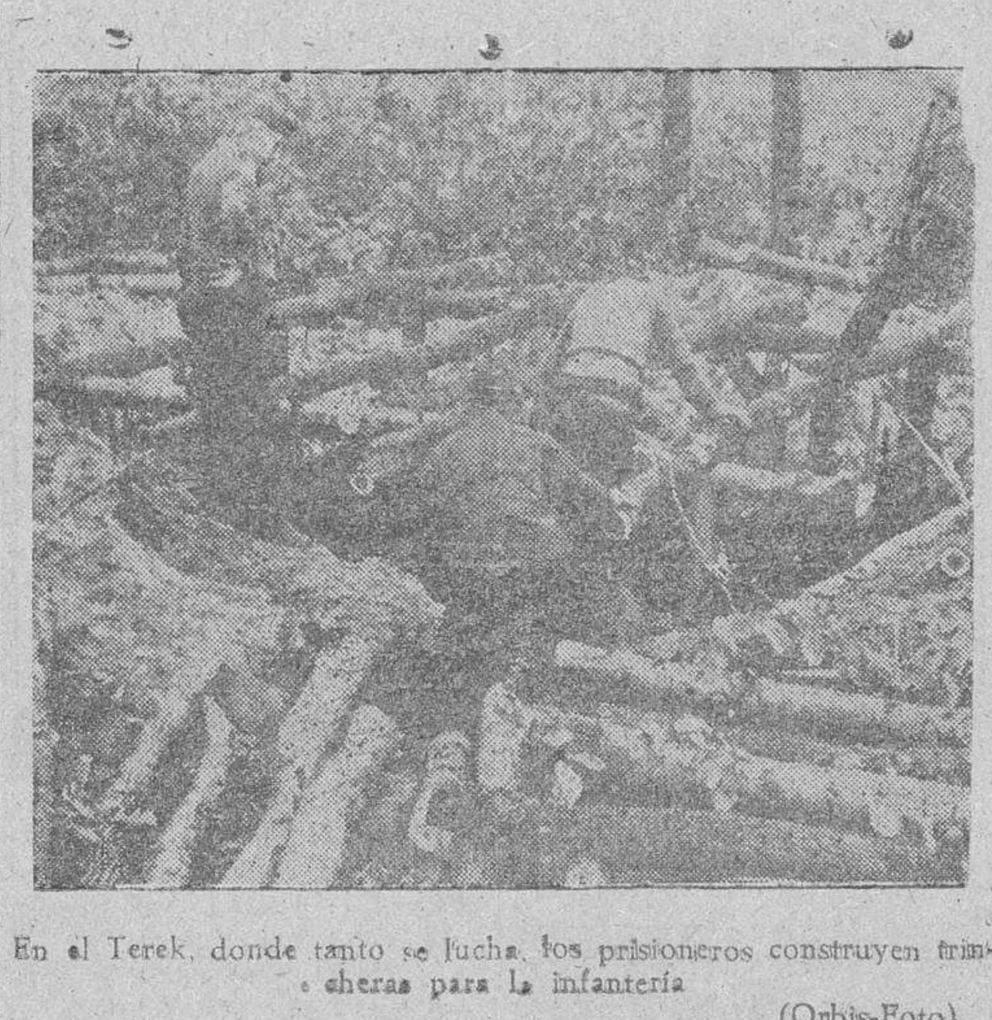
En el Terek, donde tanto se lucha, los prisioneros construyen trincheras para la infantería.