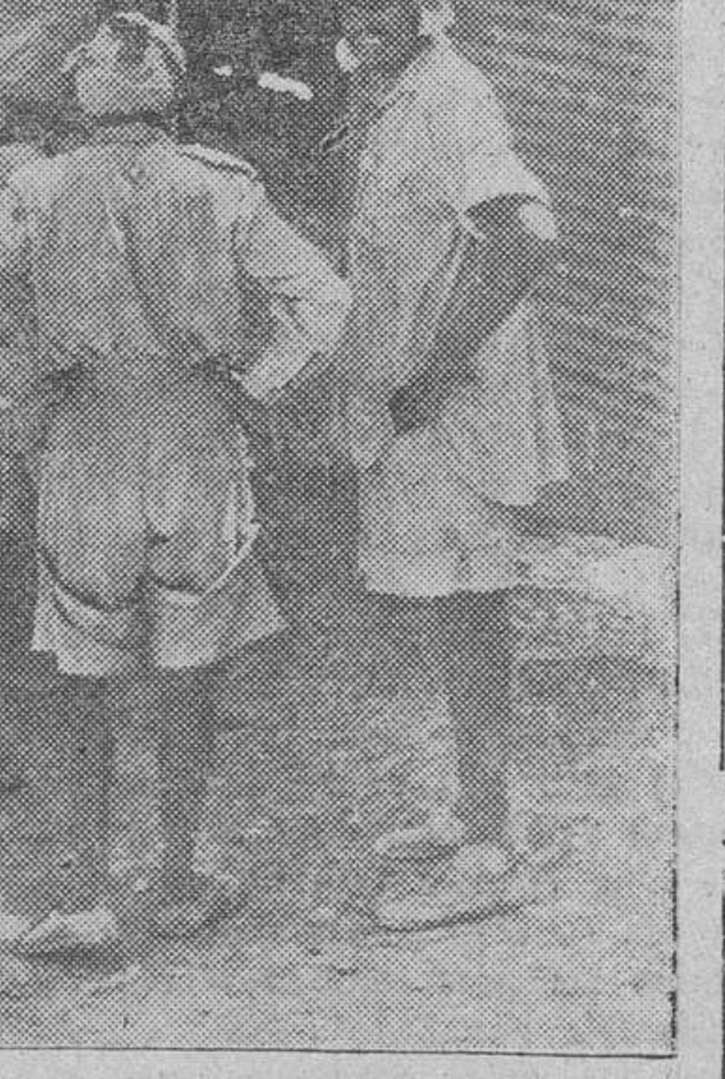
Prisioneros indios del frente africano ayudan a descargar un avión de transporte alemán

El Cairo.—En el comunicado técnico del Oriente Medio se anuncia que a primera hora del miércoles las tropas británicas realizaron un avance en la región de Munassif del sector central. En el curso de la jornada consolidaron sus posiciones y el contraataque enemigo fué rechazado. En el curso de la noche del miércoles al jueves, las patrullas se manifestaron activas. La artillería británica, atacó las posiciones enemigas en el sector norte. Una importante formación de bombarderos medios, obtuvo impactos directos en un ataque contra Tobruk, en la noche del 30 de septiembre al primero de octubre. Ayer, en el curso de un combate entre cazas británi-