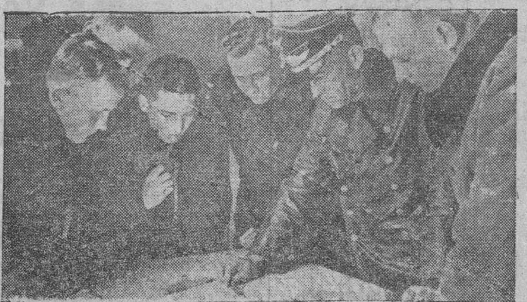
El comandante de una escuadrilla de aviación explica, sirviéndose de los modelos, la táctica que se proponen seguir las unidades de la marina para que con arreglo a ella desarrolle su actividad la aviación