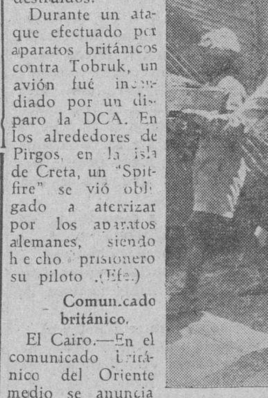
Prisioneros indios del frente africano ayudan a descargar un avión de transporte alemán

El Cairo.—En el comunicado técnico del Oriente Medio se anuncia que a primera hora del miércoles las tropas británicas realizaron un avance en la región de Munassif del sector central. En el curso de la jornada consolidaron sus posiciones y el contraataque enemigo fué rechazado. En el curso de la noche del miércoles al jueves, las patrullas se manifestaron activas. La artillería británica, atacó las posiciones enemigas en el sector norte. Una importante formación de bombarderos medios, obtuvo impactos directos en un ataque contra Tobruk, en la noche del 30 de septiembre al primero de octubre. Ayer, en el curso de un combate entre cazas británi-