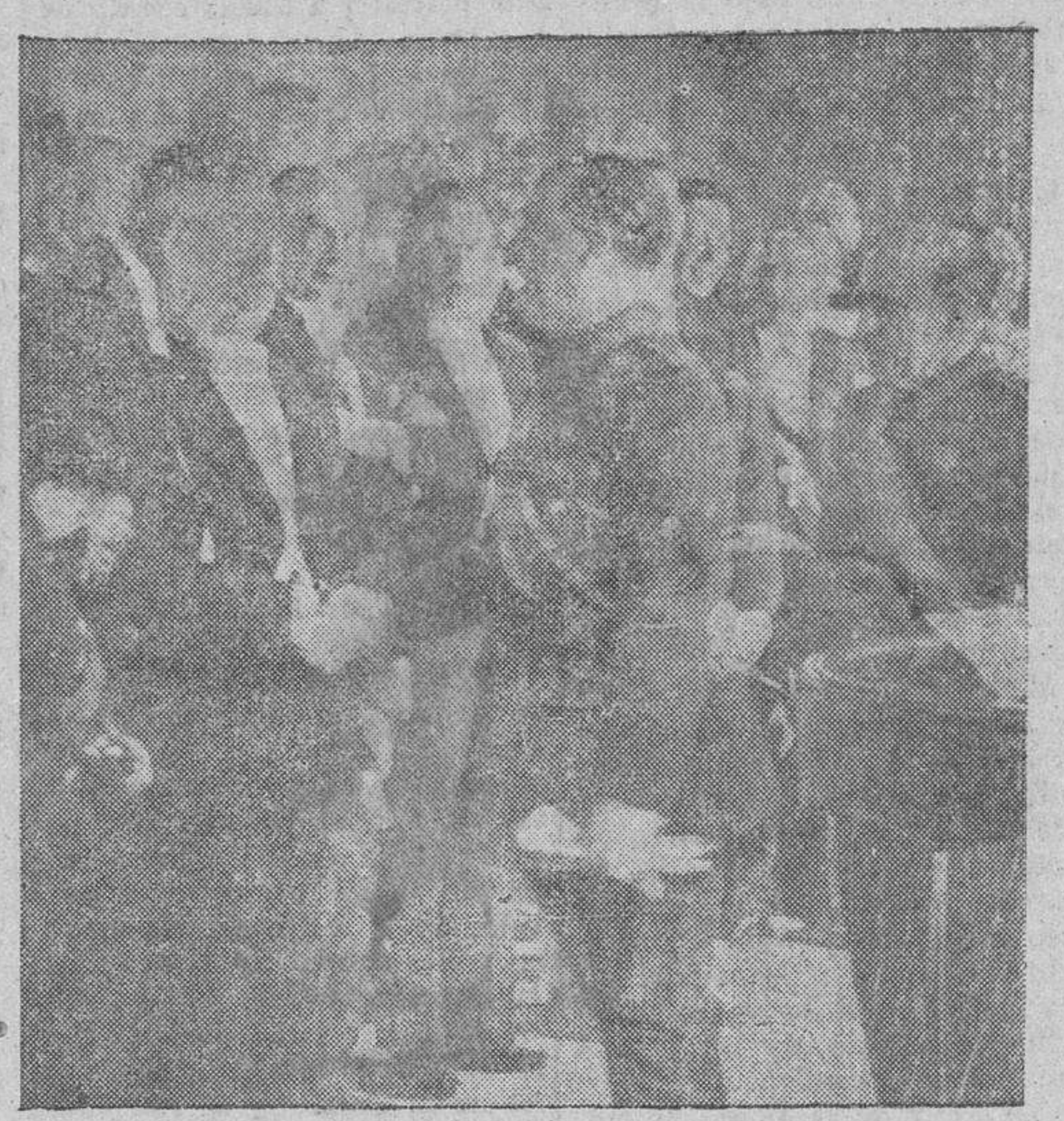
España entera ha rendido a su Caudillo, en la histórica y gloriosa fecha de su exaltación a la Jefatura del Estado, un emocionado homenaje. Las altas representaciones nacionales acudieron a Palacio para hacerle presente su absoluta y total adhesión. En nuestra fotografía se reproduce el momento en que Su Excelencia, al entrar en el Salón del Trono, saluda al Cuerpo diplomático