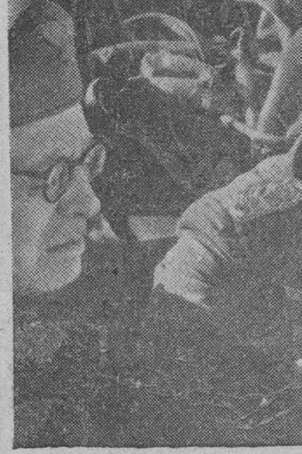
El mariscal Rommel, en unión de los altos mandos de las fuerzas del Tje, estudiando un plan de operaciones