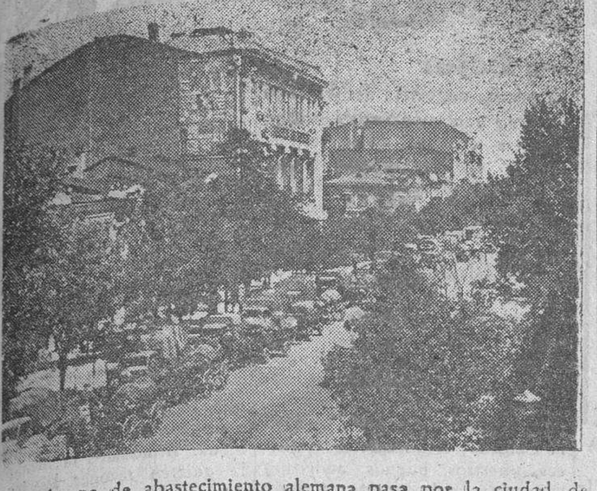
Una columna de abastecimiento alemana pasa por la ciudad de Rostov, con destino al frente, ya lejos de la ciudad industrial.