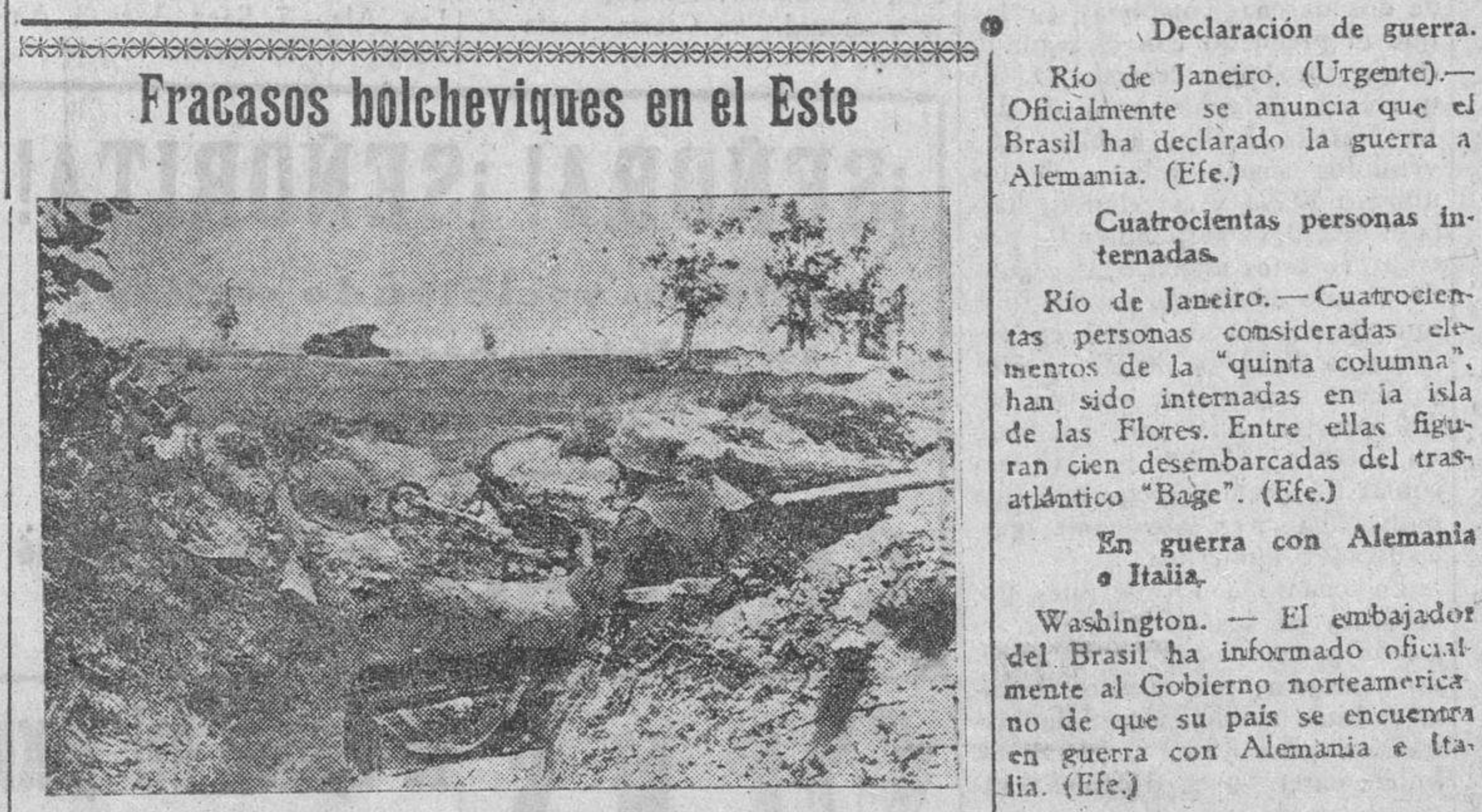
Sin efecto ninguno, intentaron los soviets con sus contraataques de romper las líneas alemanas, siendo siempre enérgicamente rechazados por la infantería. La foto muestra un puesto de ametralladora alemán, situado en una trinchera.

Los alemanes residentes en Brasil, han sido detenidos e internados