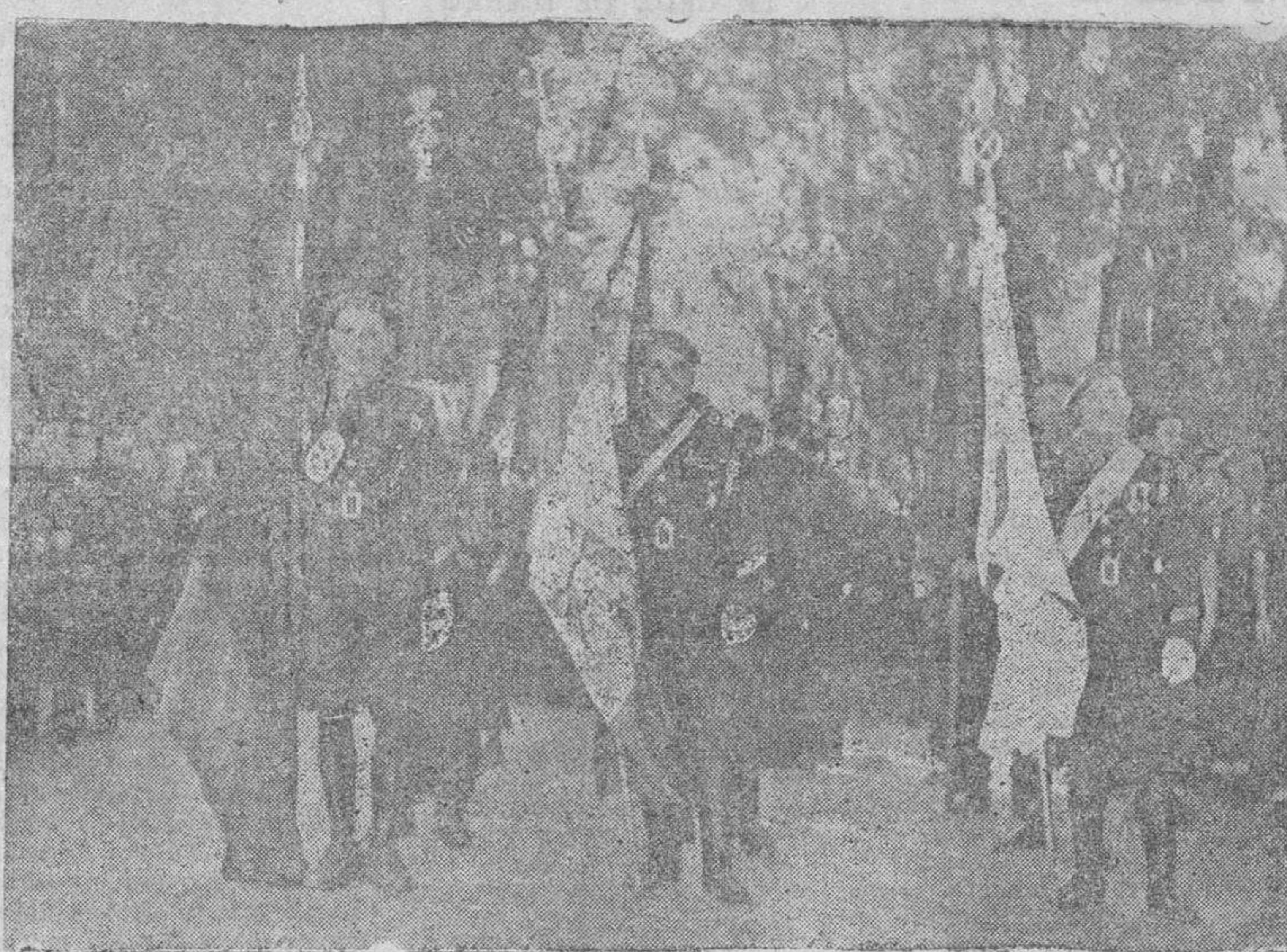
Los abanderados en la concentración nacional-sindicalista de ayer, ante la Cruz de los Caídos