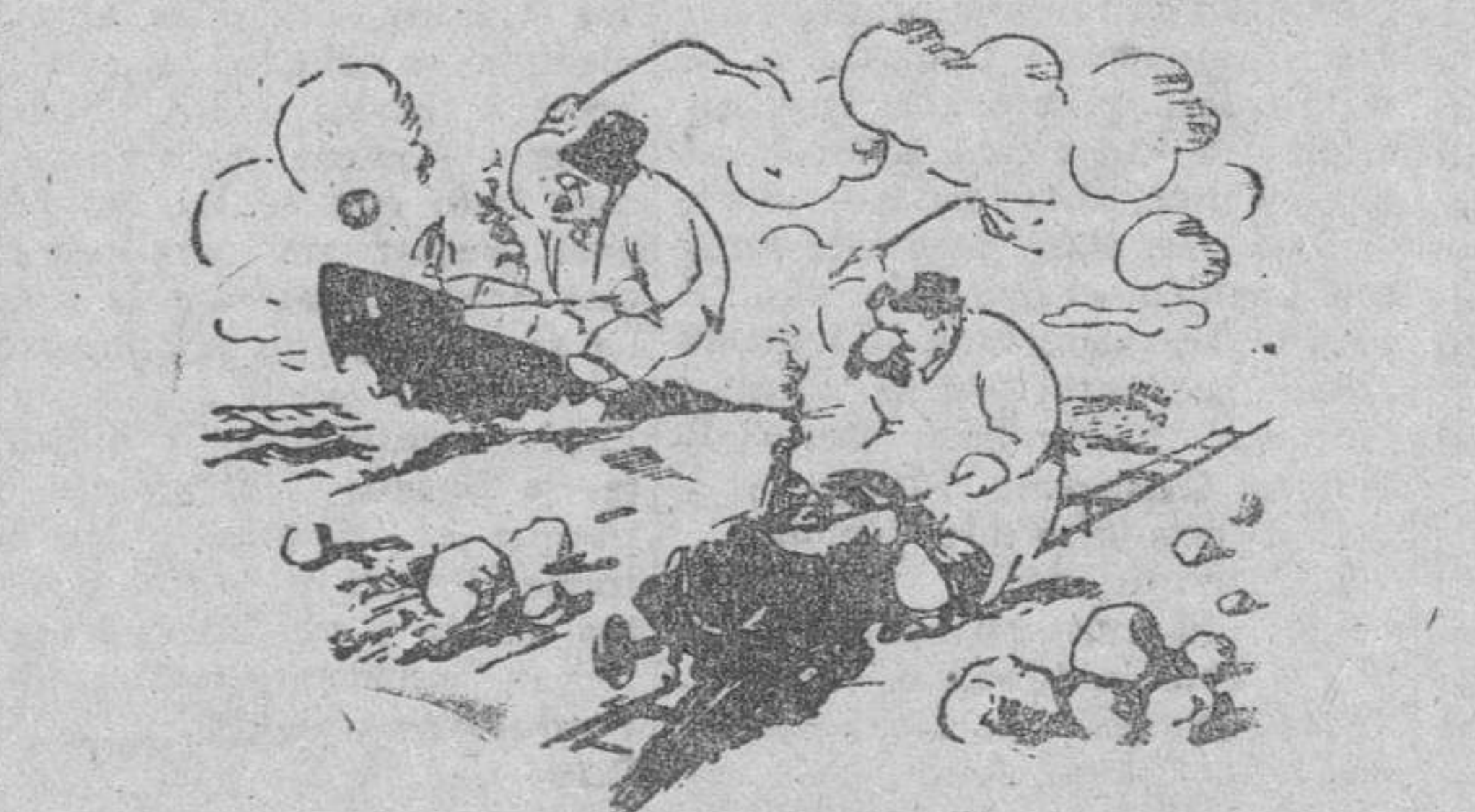
Preocupaciones de los transportes de los aliados. (De "Die Grüne Post", Berlín.)