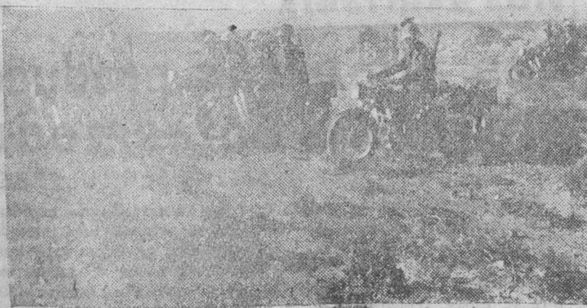
Columna motorizada italiana avanzando por el desierto africano

Trece aviones ingleses derribados en la jornada de ayer