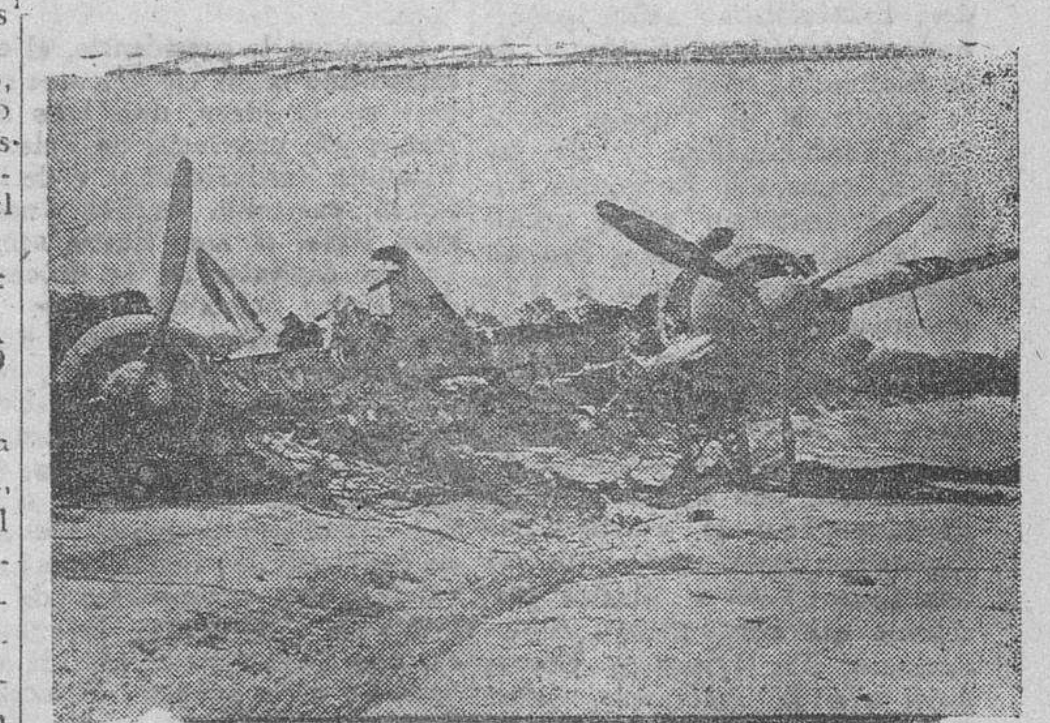
Restos de un avión británico Bristol-Blenheim, derribado por la defensa antiáerea costera italiana en Africa del Norte