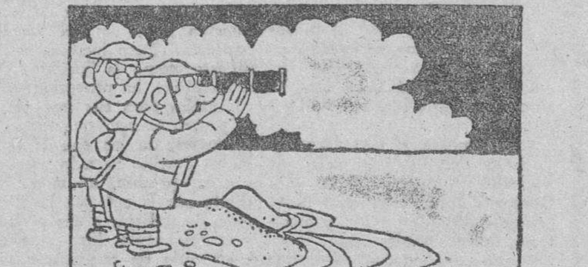
EN MALTA.—¿No ves nada? —Nada. —Entonces debe ser un convoy nuestro. (De "Stampa", Turín.)