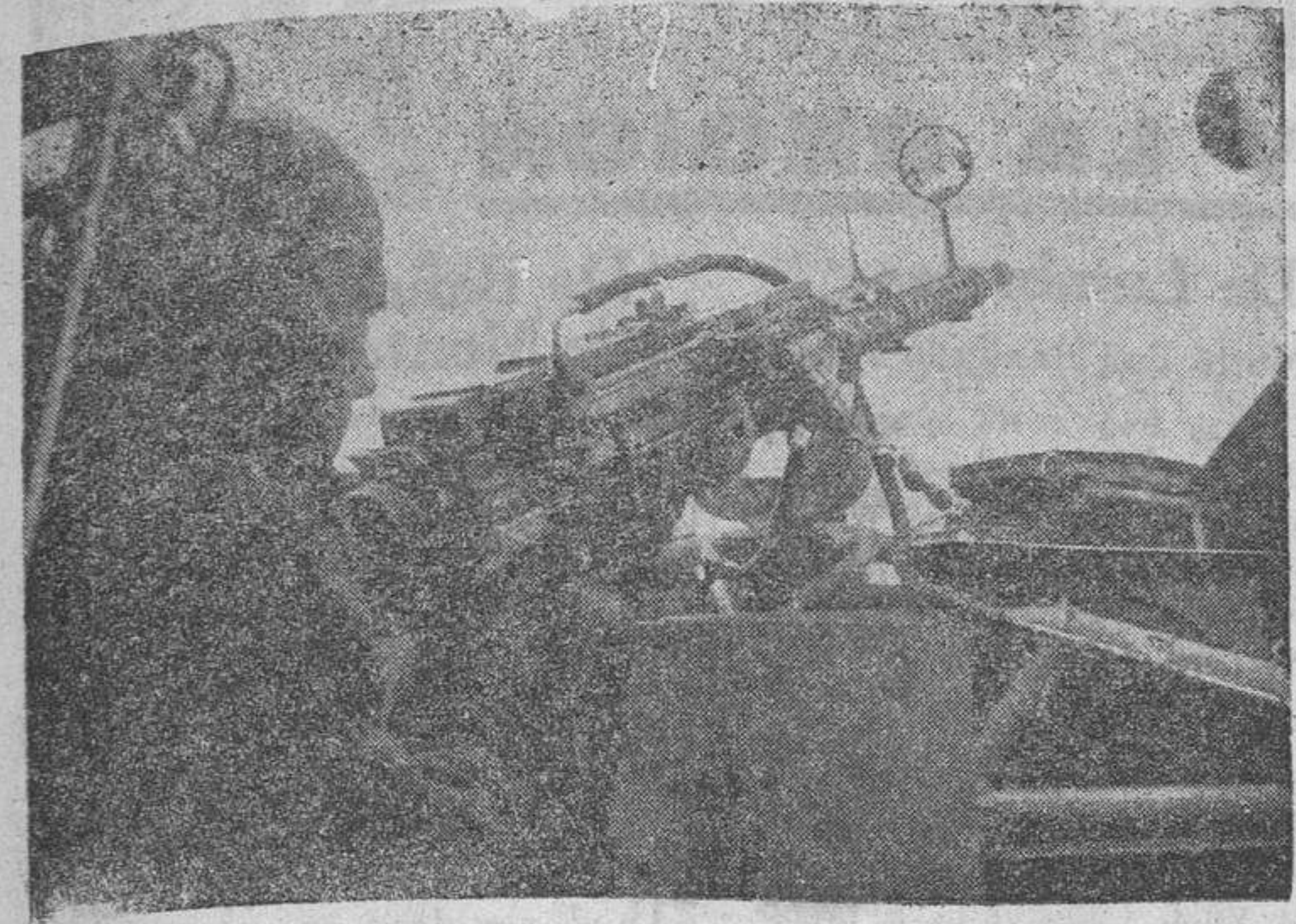
El servidori de la ametralladora de un avión italiano, prueba el arma antes de emprender el vuelo.