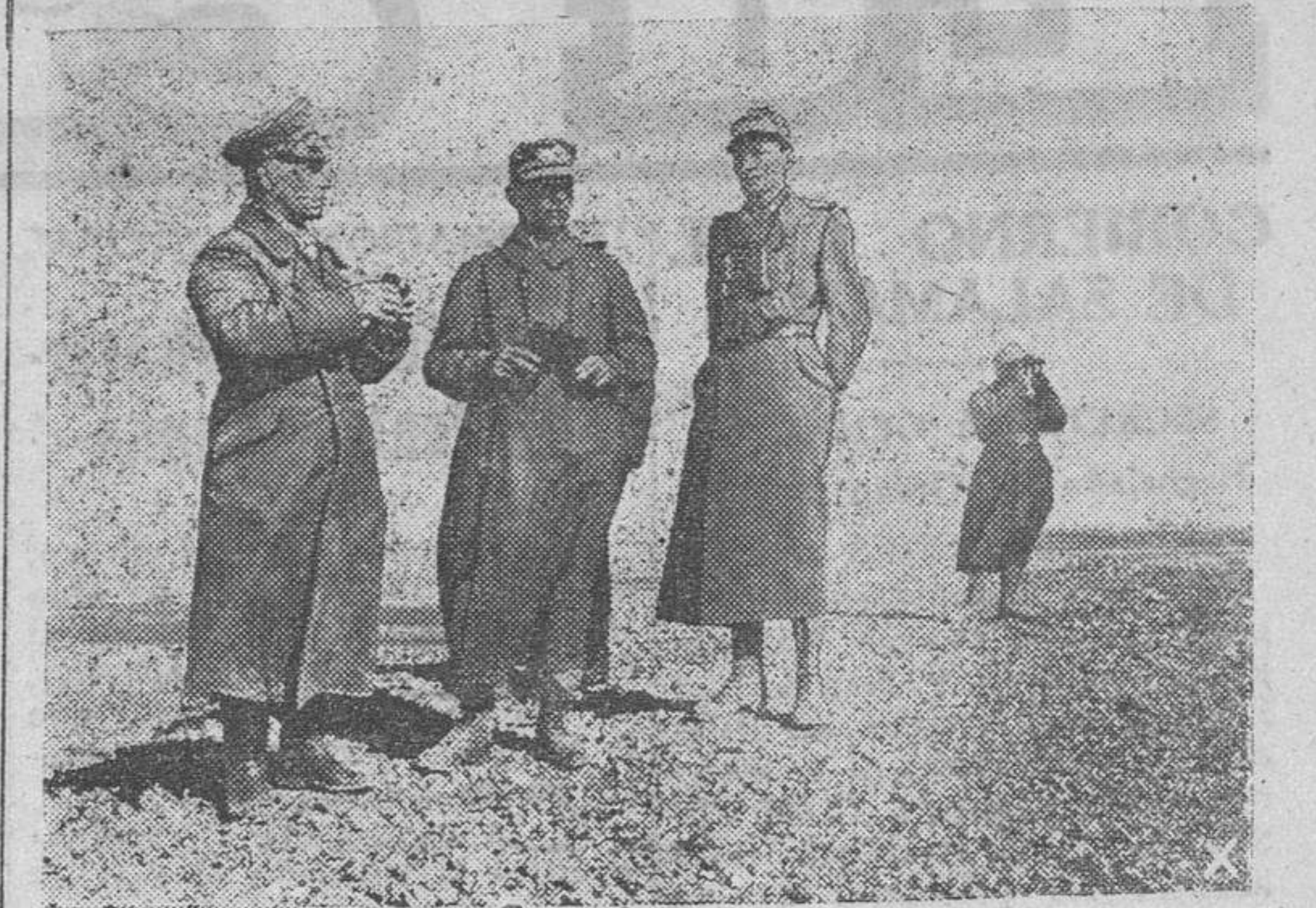
El mariscal Rommel conversando con dos de sus oficiales en la zona de los combates de Africa