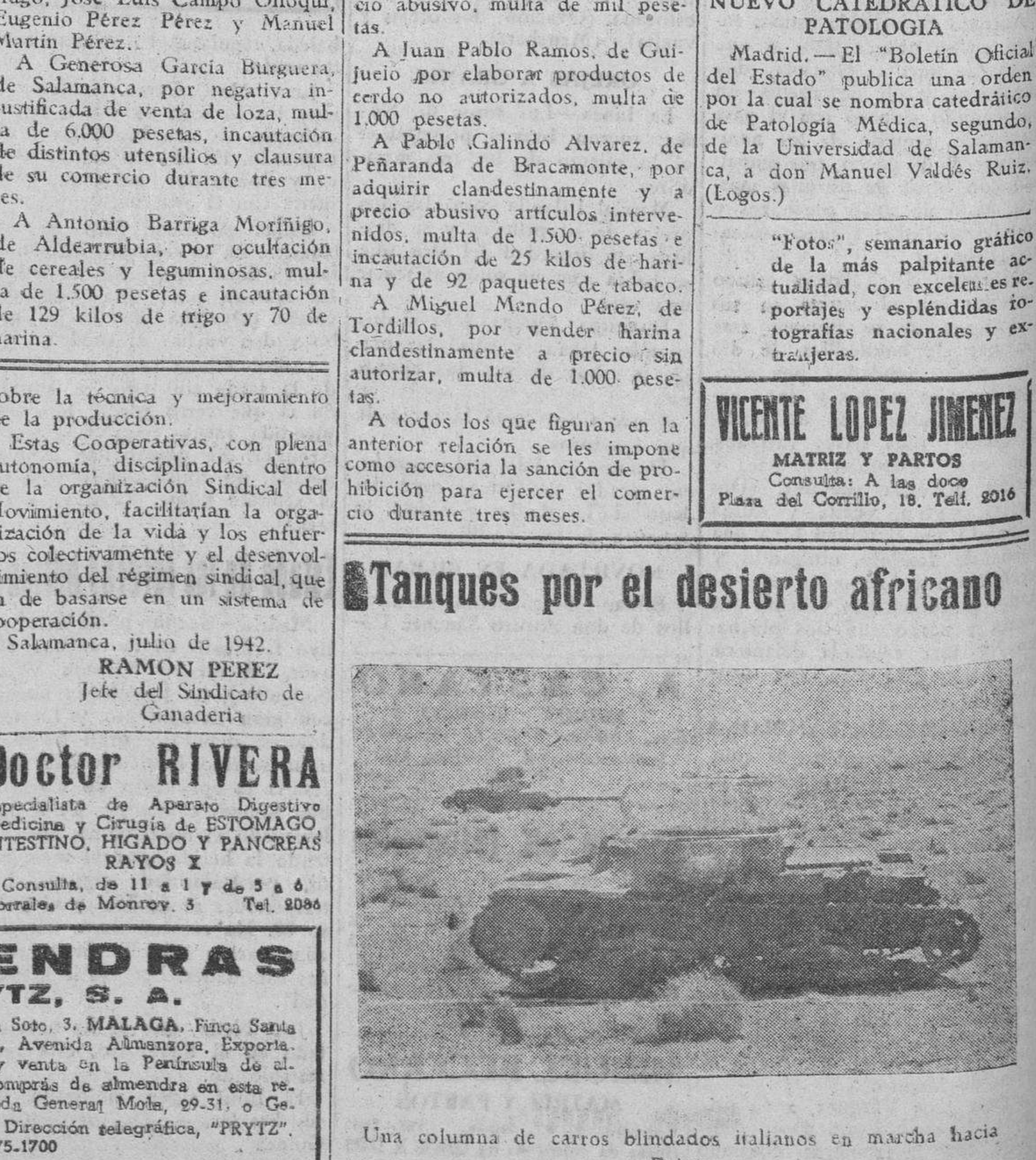
Una columna de carros blindados italianos en marcha hacia Egipto