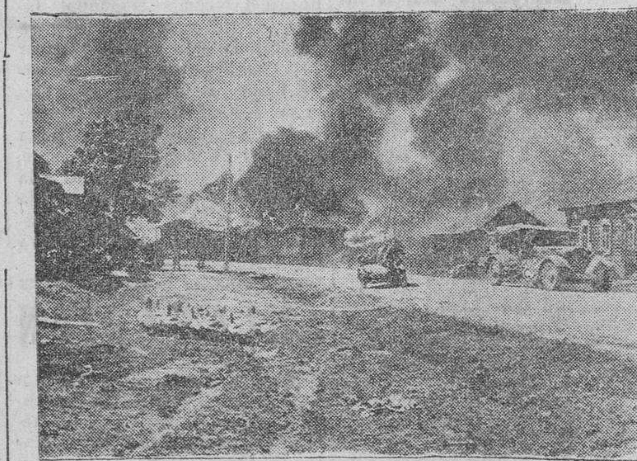
Las columnas motorizadas alemanas atraviesan una aldea en llamas recientemente conquistada en el frente ruso