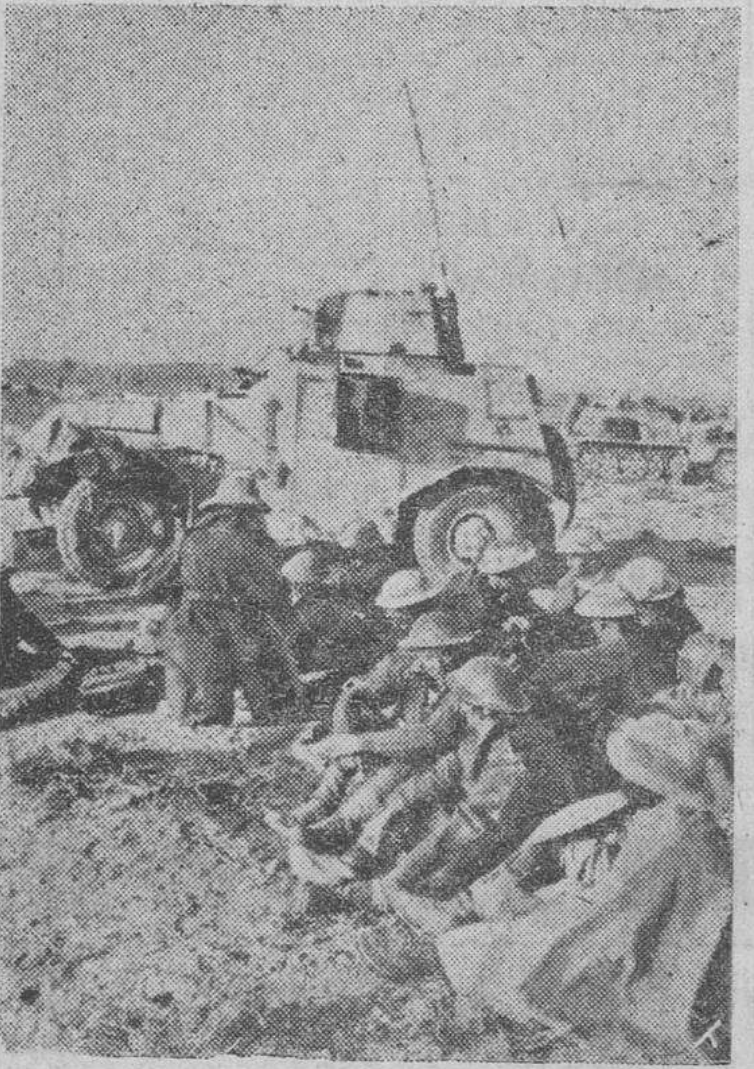
Un grupo de prisioneros ingleses y surafricanos capturados por las tropas alemanas del mariscal Rommel en sus últimas recientes victorias

Comunicado del Almirante. Londres.—"Nuestros submarinos siguen infligiendo pérdidas a las comunicaciones enemigas en el Mediterráneo. Un submarino mandado por el teniente Mackenzie, destruyó otros dos buques adversarios que se dirigían a Libia y torpedeó y hundió a un mercante de tonelaje medio que formaba parte de un convoy fuertemente protegido, con abastecimientos para Libia. Un navío auxiliar de desplazamiento medio fué interceptado y atacado por el mismo submarino y después de ser alcanzado por los torpedos se fué a pique." (Efe.)