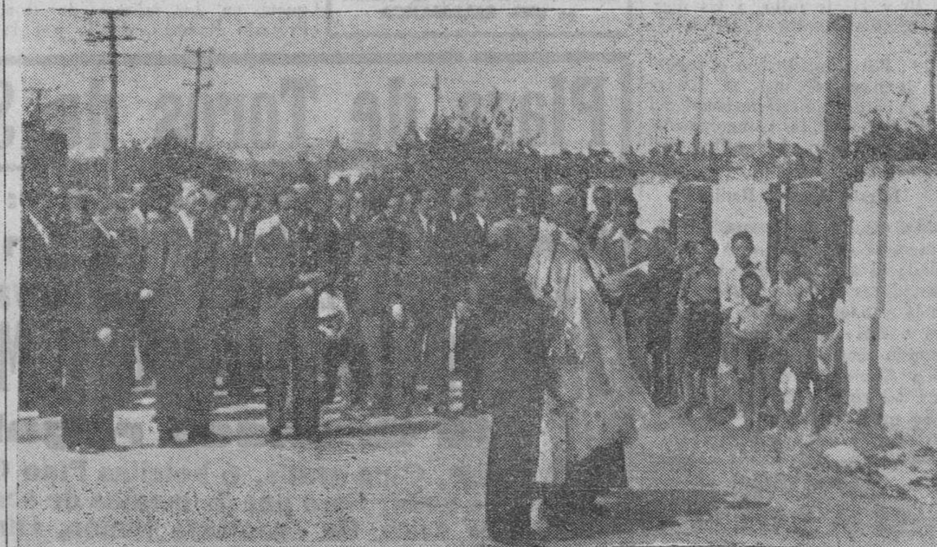
El párroco de la iglesia de San Miguel, de Peñaranda, bendiciendo la nueva fábrica de harinas de la Compañía Viguera, ante la hornacina de la Virgen Milagrosa, colocada en una de las fachadas del edificio

OBRERO: Cualquiera que sea tu caso sobre Seguros, acude a la Hermandad y ella te lo solucionará gratis.