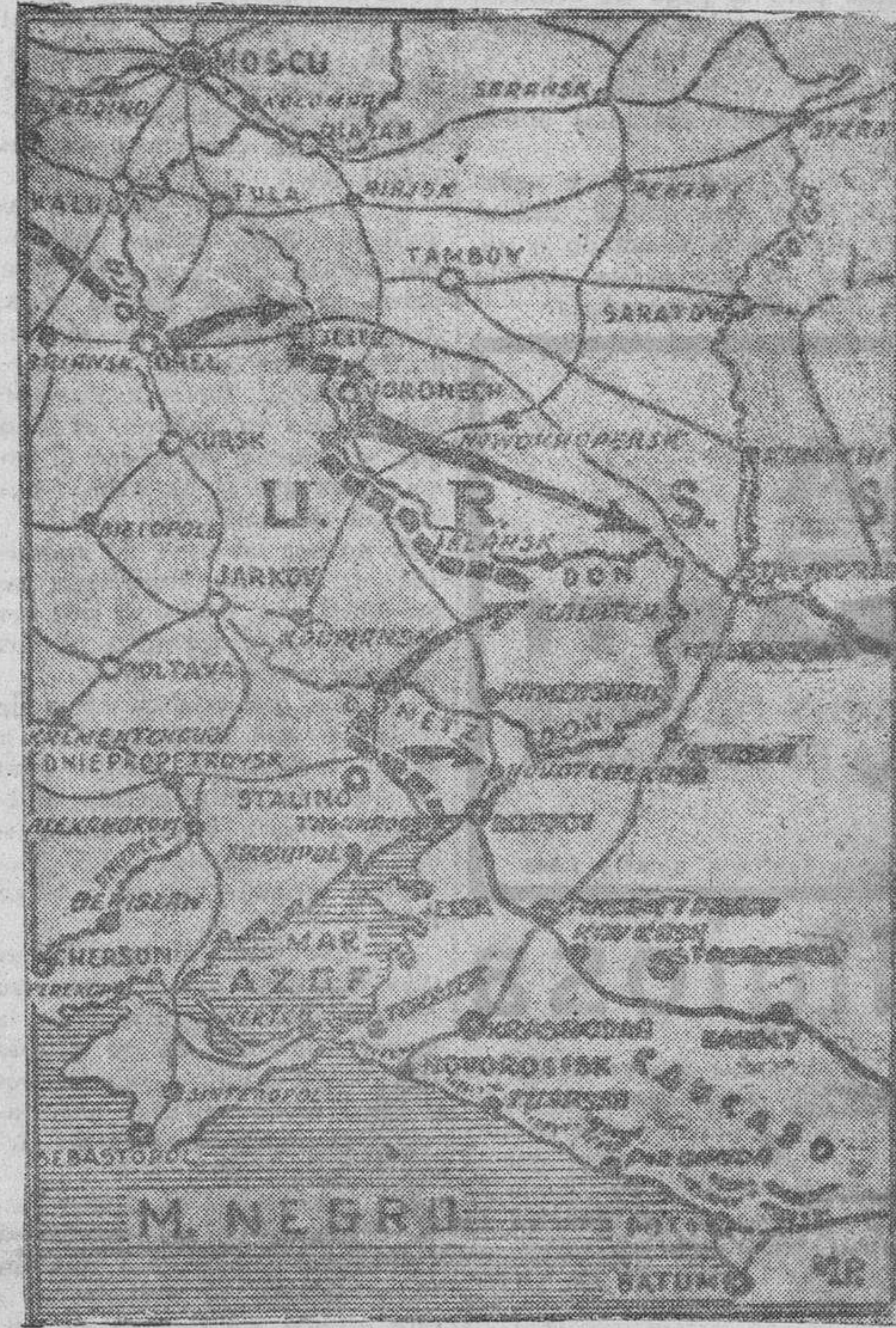
Las flechas señalan la situación de las fuerzas alemanas en la nueva ofensiva del sector Sur de Rusia

Otros tres barcos del convoy norteamericano hundidos por los submarinos alemanes