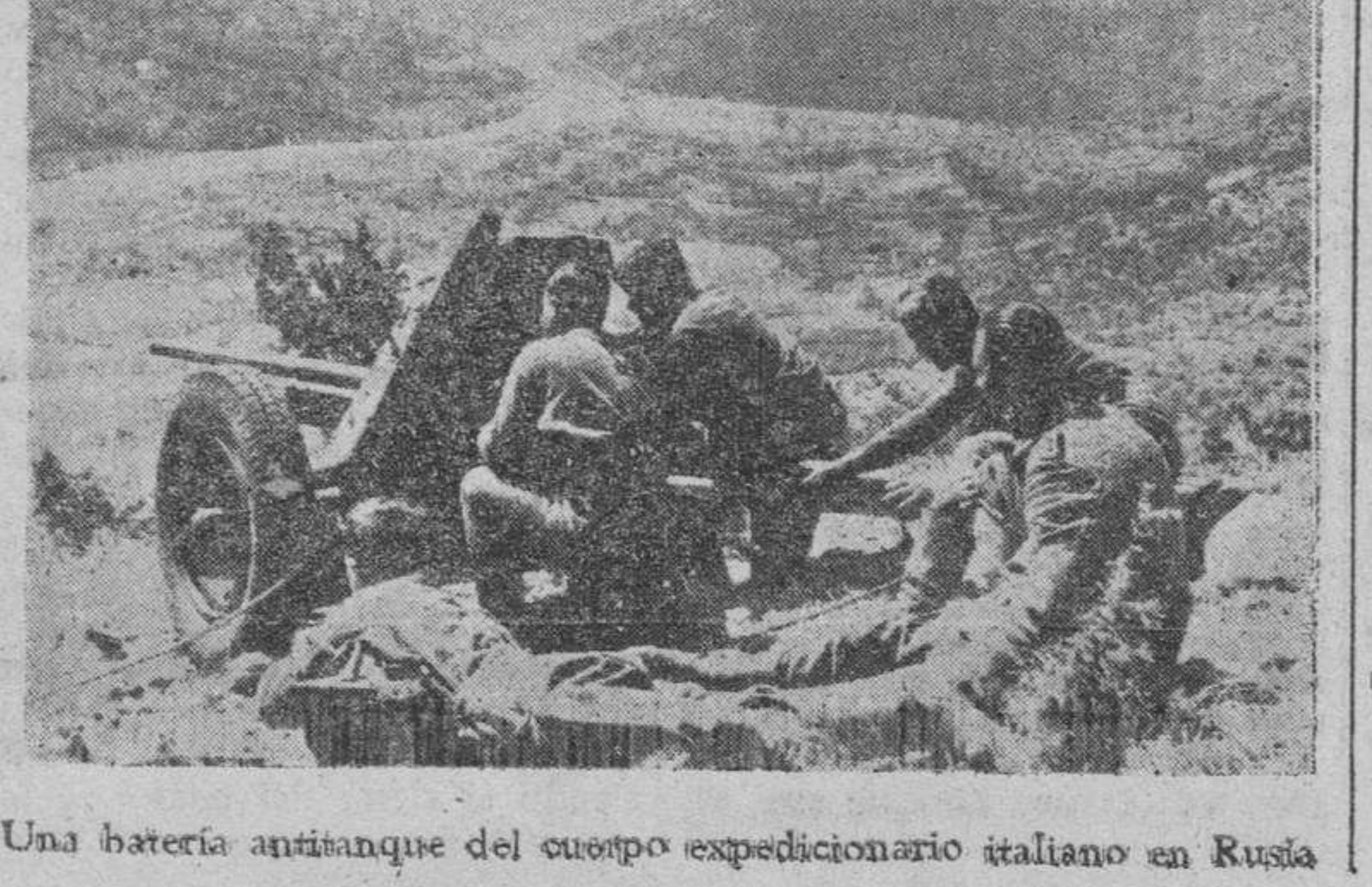
Una batería antiaérea del cuerpo expedicionario italiano en Rusia