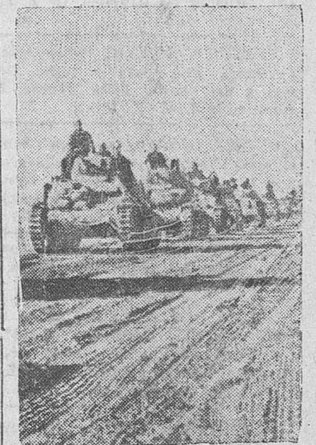
Los tanques alemanes e italianos forman interminables caravanas, avanzando en el desierto.