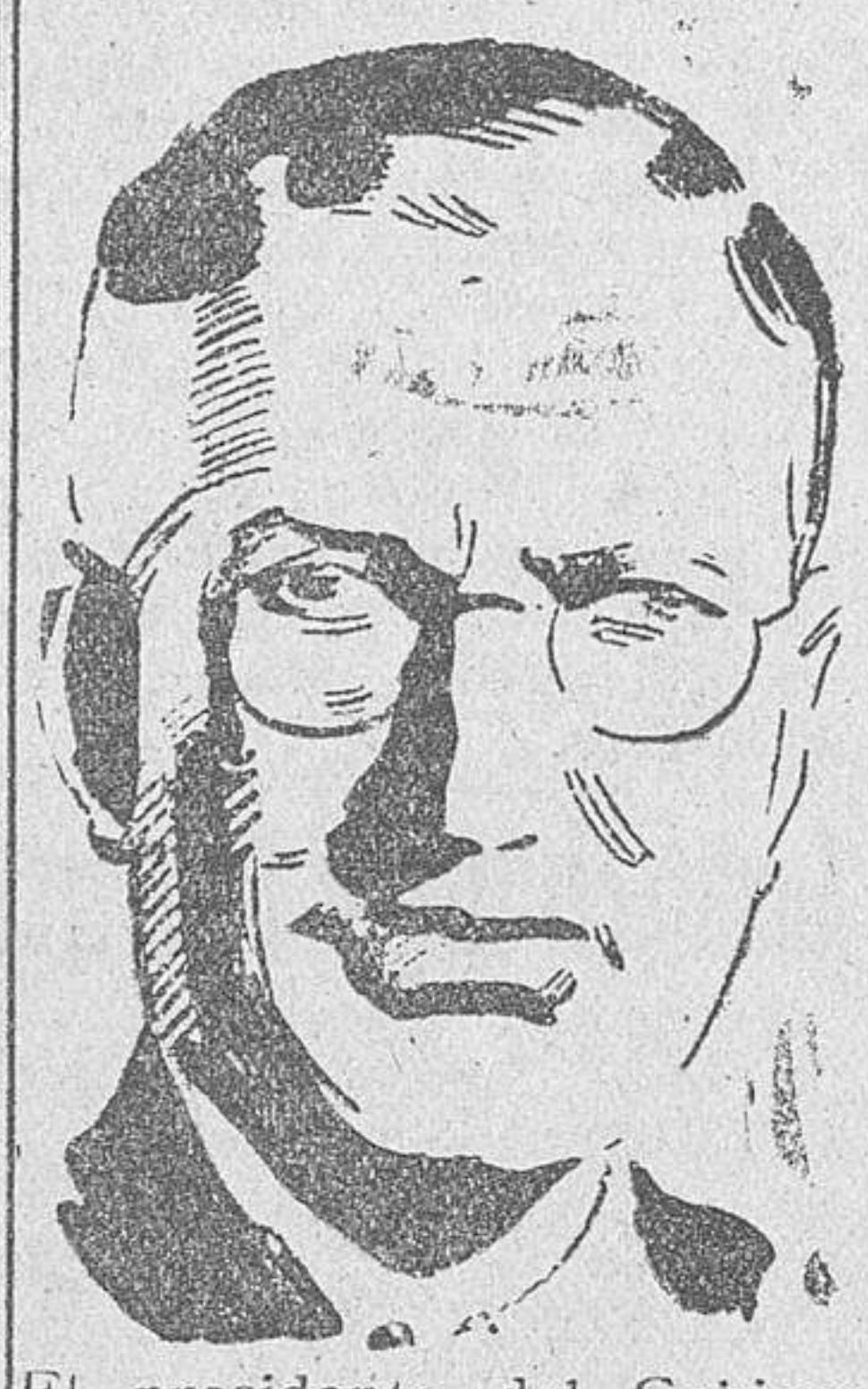
El presidente del Gobierno australiano, Curtin