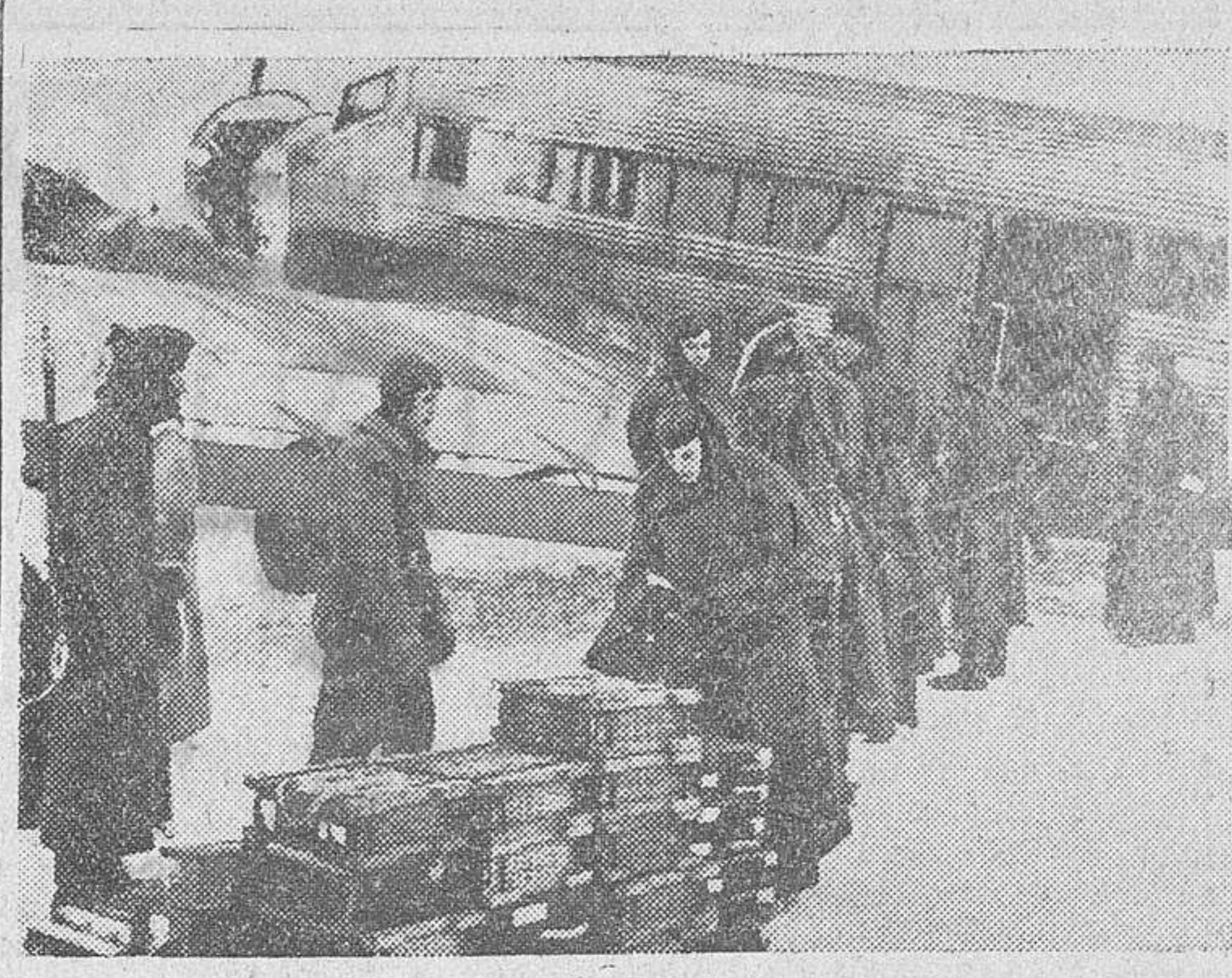
Un avión de transporte alemán llega a un aeródromo del frente Oriental con una carga de municiones.