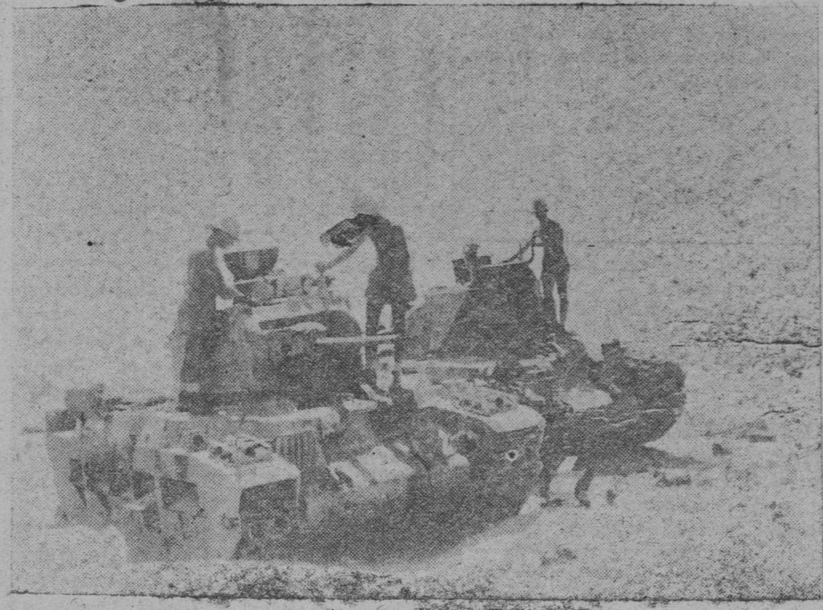
Tanques británicos inmovilizados por la artillería italiana en el Africa Septentrional

No olvides finalizar el día 1 el plazo de declarar los artículos que posees.