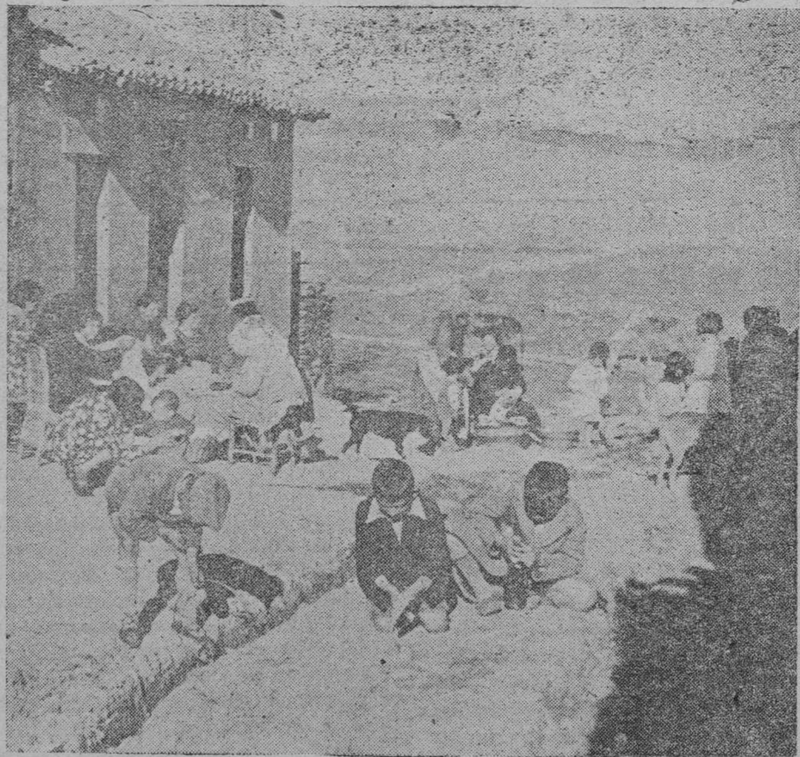
He aquí una prueba de la anarquía que presidió el ensanche: construcción sin plan alguno, en terrenos de labor, sin servicios urbanos, ni alineaciones, ni rasantes

Consecuentemente con este criterio, la reforma principal en la ordenación general del sistema circulatorio—para facilitar el tráfico rodado en el centro y descongestionar del mismo a la Plaza Mayor, llegando incluso a cortarlo en determinados momentos, así como a las calles afluentes a la misma en los tramos de desembocadura a dicha Plaza—consiste en convertir el actual sistema fundamental radial en sistema secundario, disponiendo