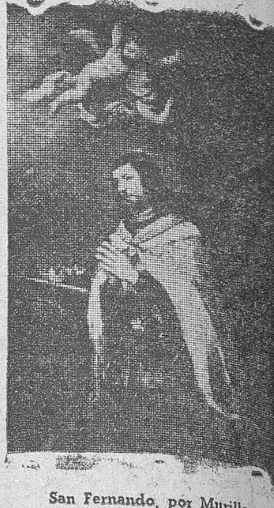
San Fernando, por Muzillo

LA FUNCION DE GALA A las diez y media de la noche se celebró en el Teatro Liceo la anunciada función de gala, organizada por el regimiento de Ingenieros con motivo