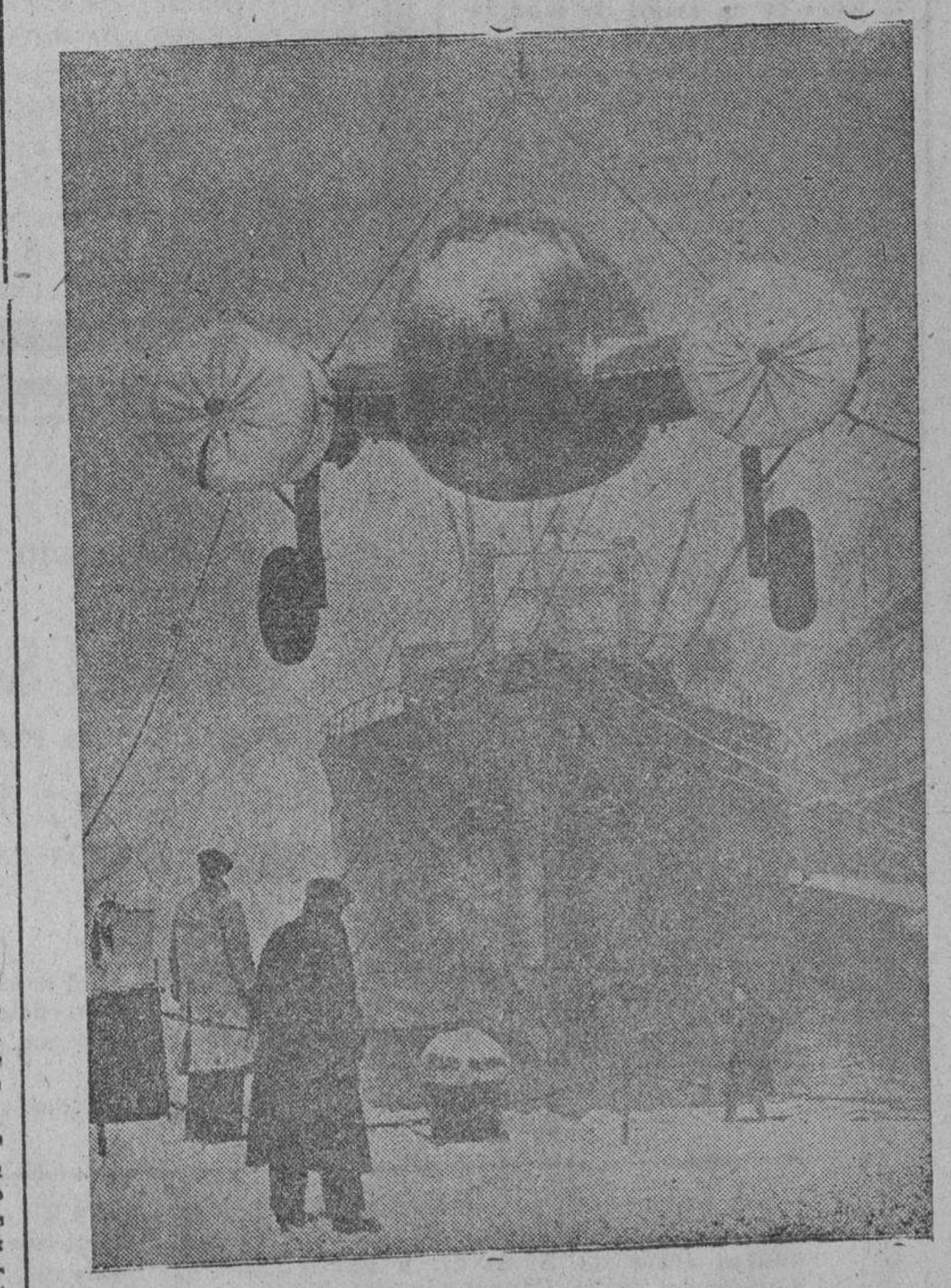
Empiezan a llegar a los puertos ingleses los aviones comprados en Norteamérica para la guerra de las potencias aliadas contra Alemania. Nuestra fotografía reproduce el momento de desembarcar uno de dichos aparatos, tipo "Lockheed".