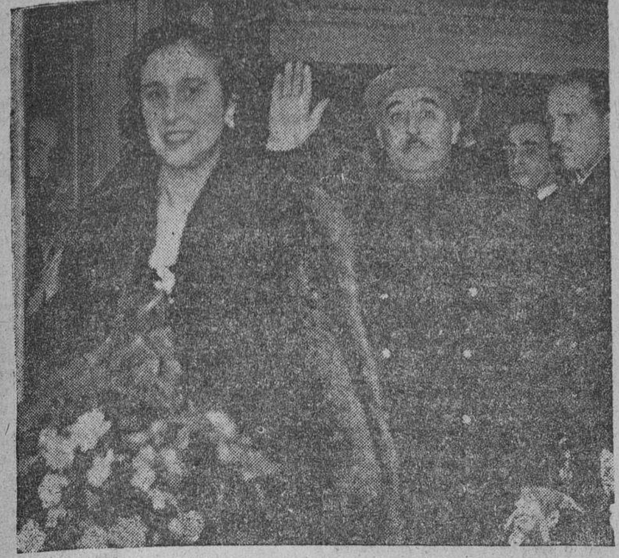
El Caudillo y su esposa a la salida del Teatro Calderón, donde asistieron a la representación de "La Bohème"