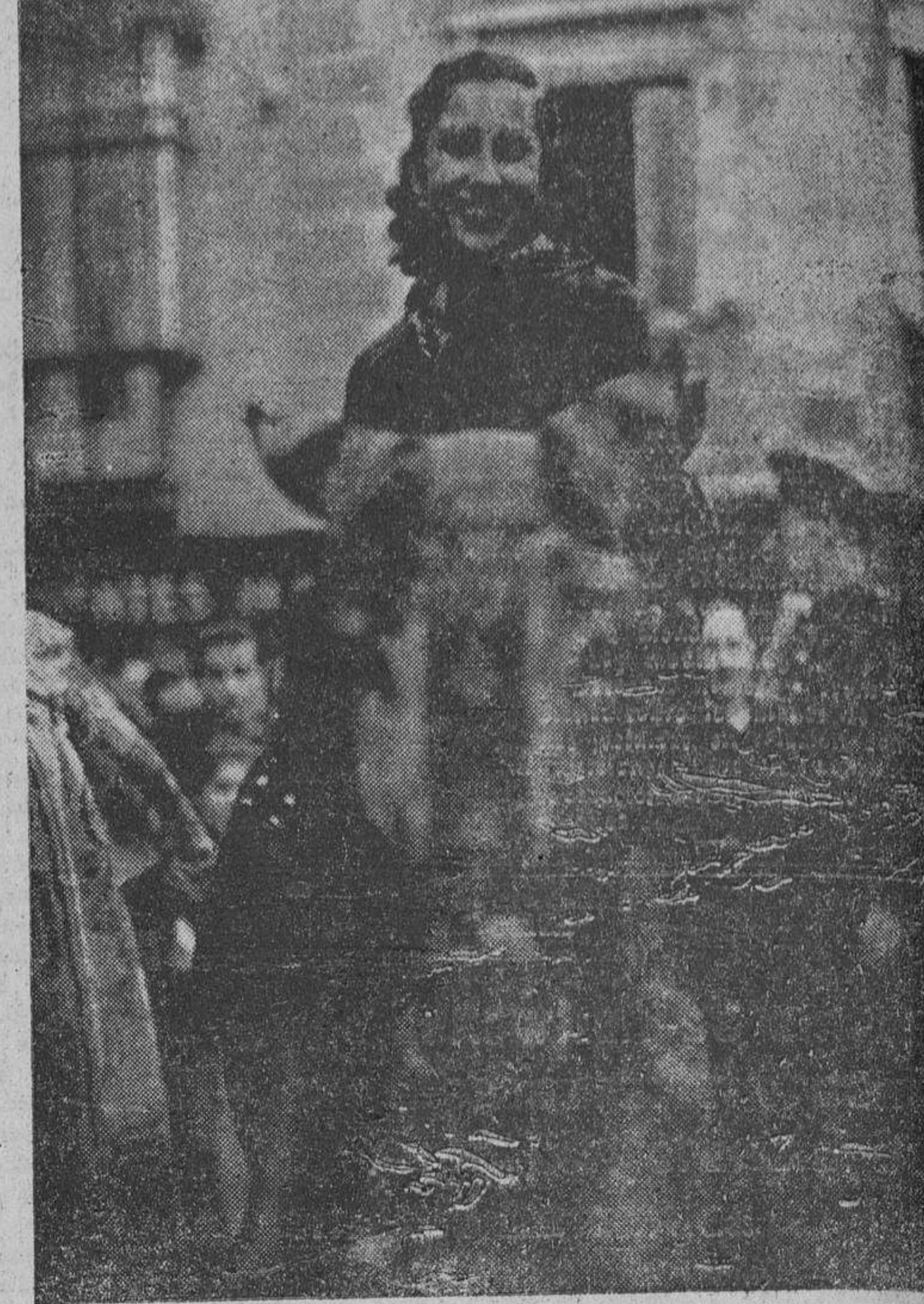
Este año se celebró con gran esplendor, habiendo concurrido para ser bendecidos gran número de animales. Una castiza madrileña sobre su cabalgadura a su paso por la calle de Hortaleza.