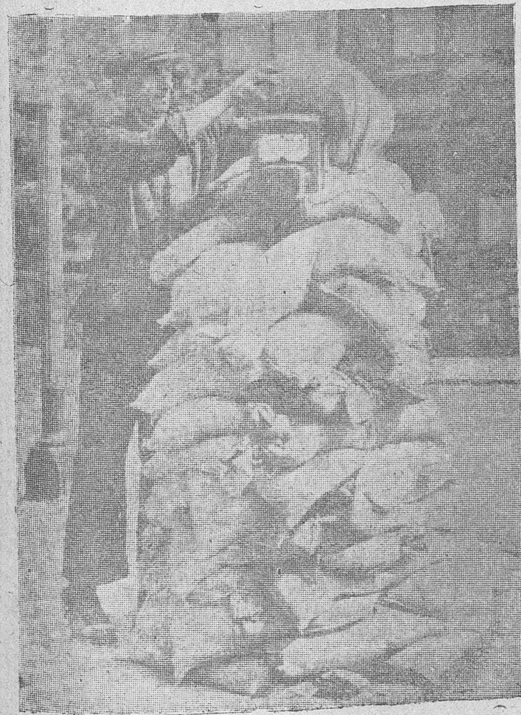
La defensa pasiva en Londres alcanza hasta a los teléfonos públicos. He ahí uno de los instalados en la vía pública protegido por sacos terreros

El camino es difícil. Pero no hemos de detenernos a chapotear sobre la sangre tibia de los que cayeron. Sobre nuestra primera victoria se alza apremiante la bandera roja y negra de la Revolución y el Imperio. El 22 de Octubre habla el secretario nacional del S. E. U.!!