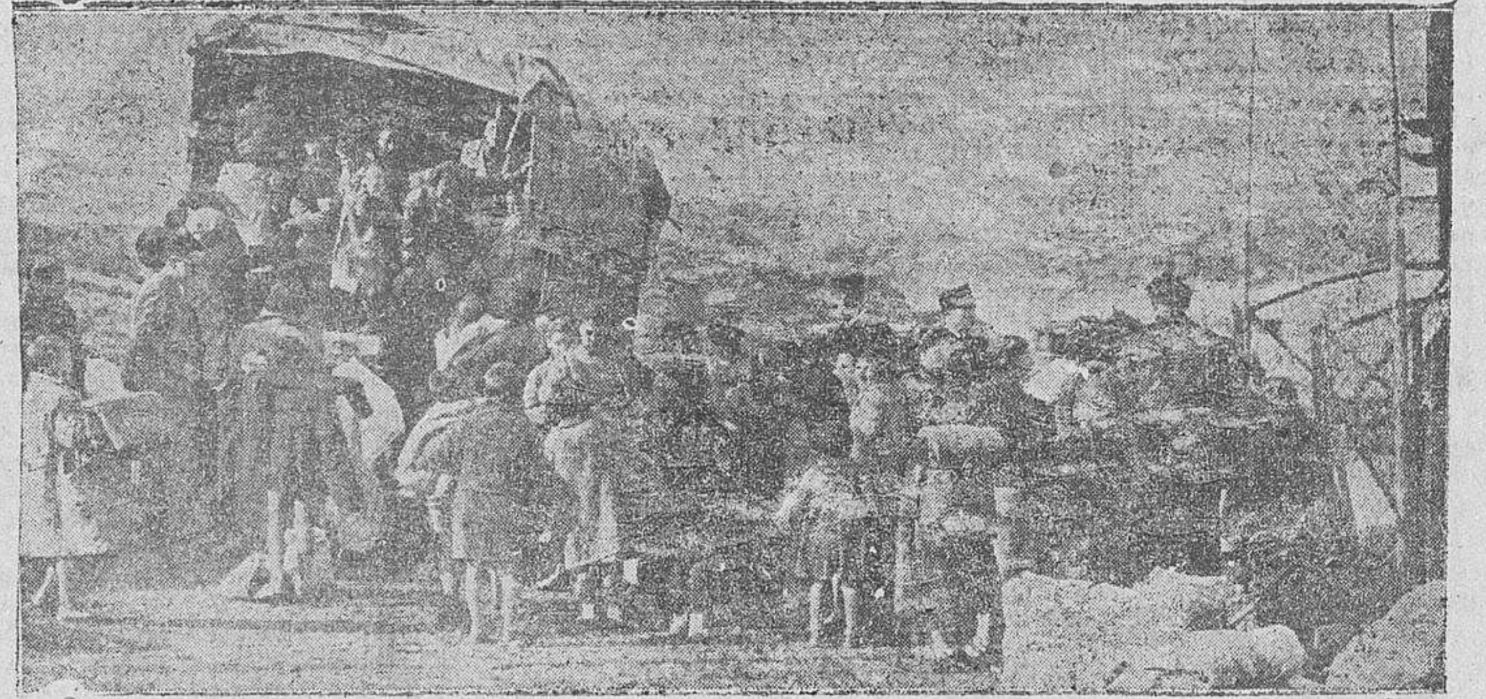
La frontera de los Pirineos presenta este lamentable aspecto de huida

Un manifiesto del partido Comunista, calificando de traidores a los que huyen