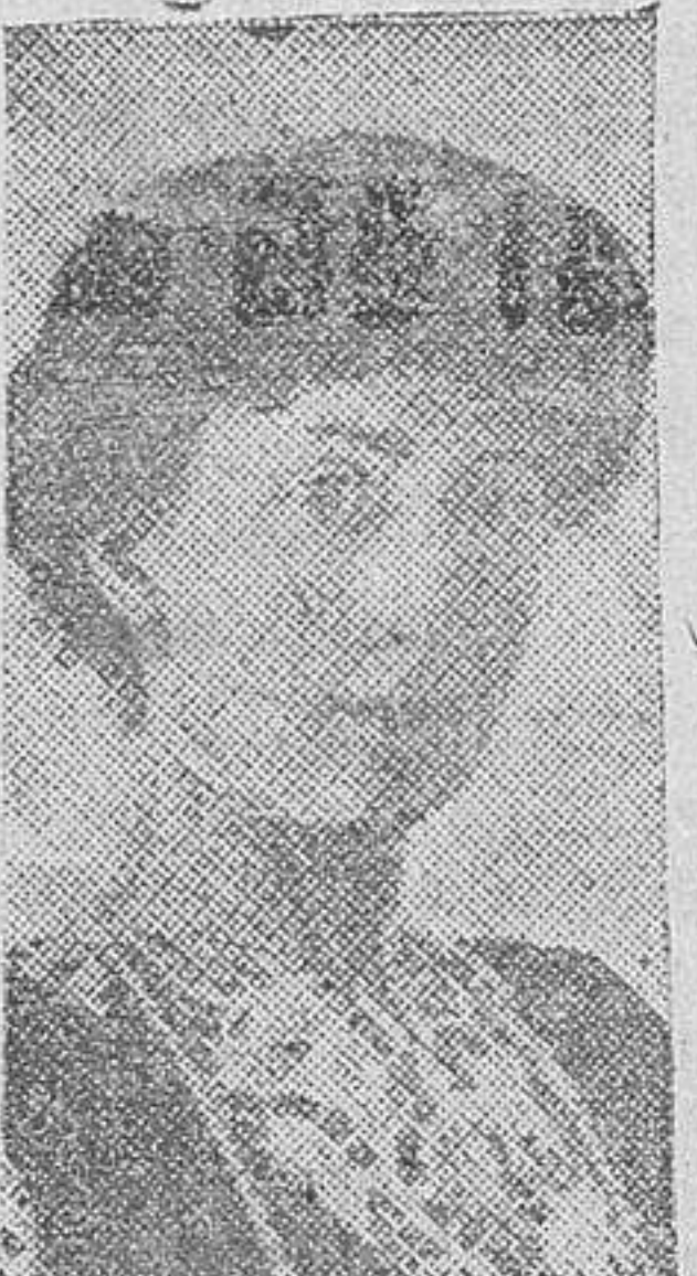
La Reina Maud

Hoy es día de luto nacional en Noruega, donde la Soberana difunta se había conquistado el amor unánime del pueblo