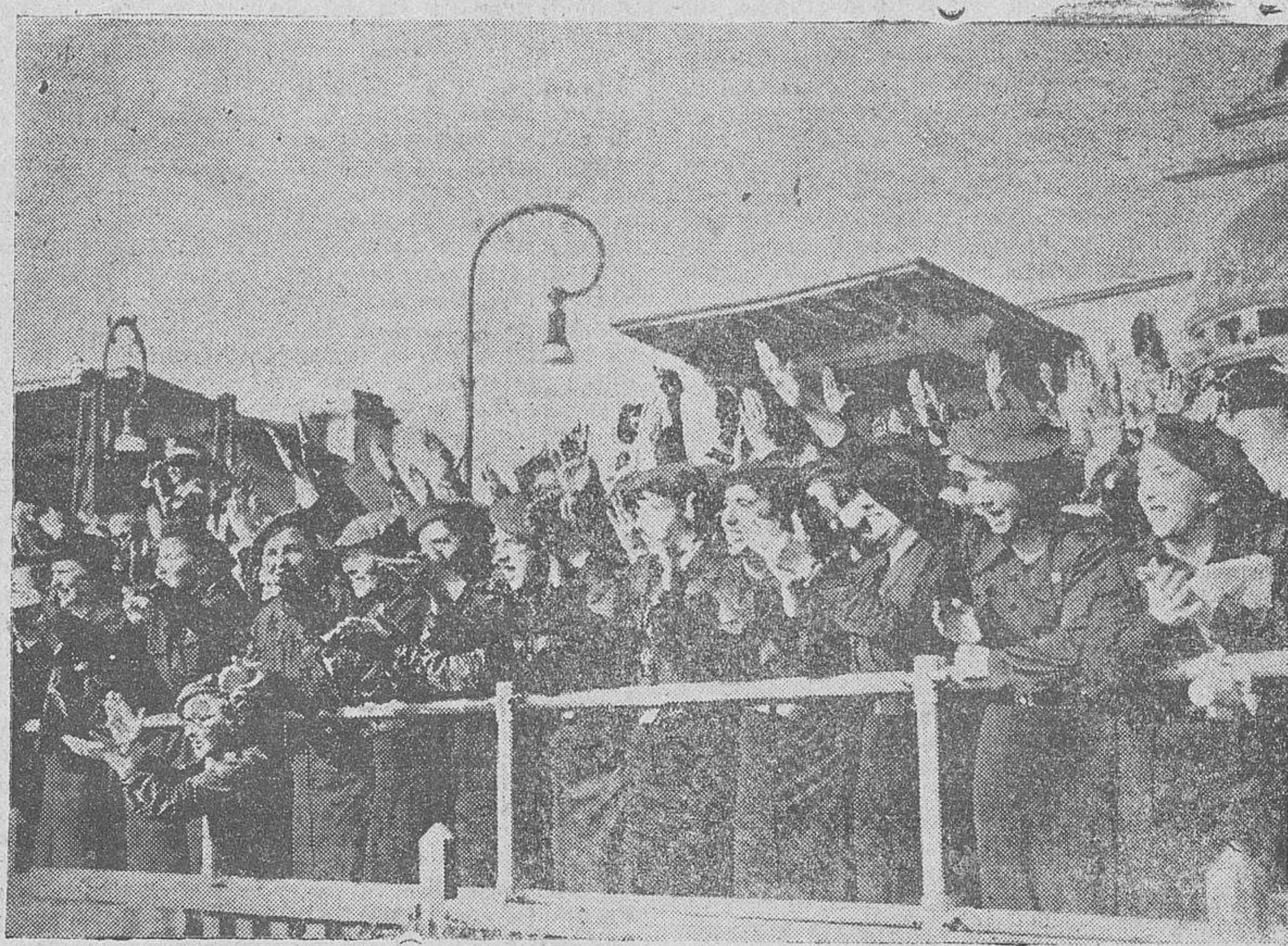
Las maestras españolas asisten al desfile de los agentes del P. S. en ocasión del XIII aniversario de la fundación del Cuerpo de los Metropolitanos.