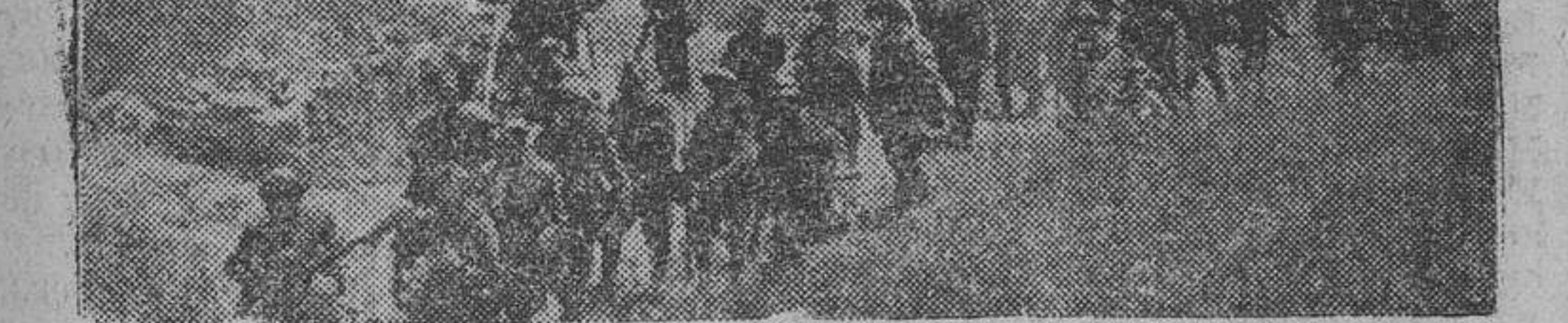
Las heroicas tropas del general Mola ocupan el importante caserío de San Miguelchu, donde el enemigo intentó vanamente hacer frente

Como detalles del ataque rojo de ayer a la posición de San Pedro, añadimos que entre los cadáveres cogidos figura el de un muchacho de quince años, con las insignias de capitán. También se hizo prisionero al cabecilla Malatesta, conocido comunista bilbaino.