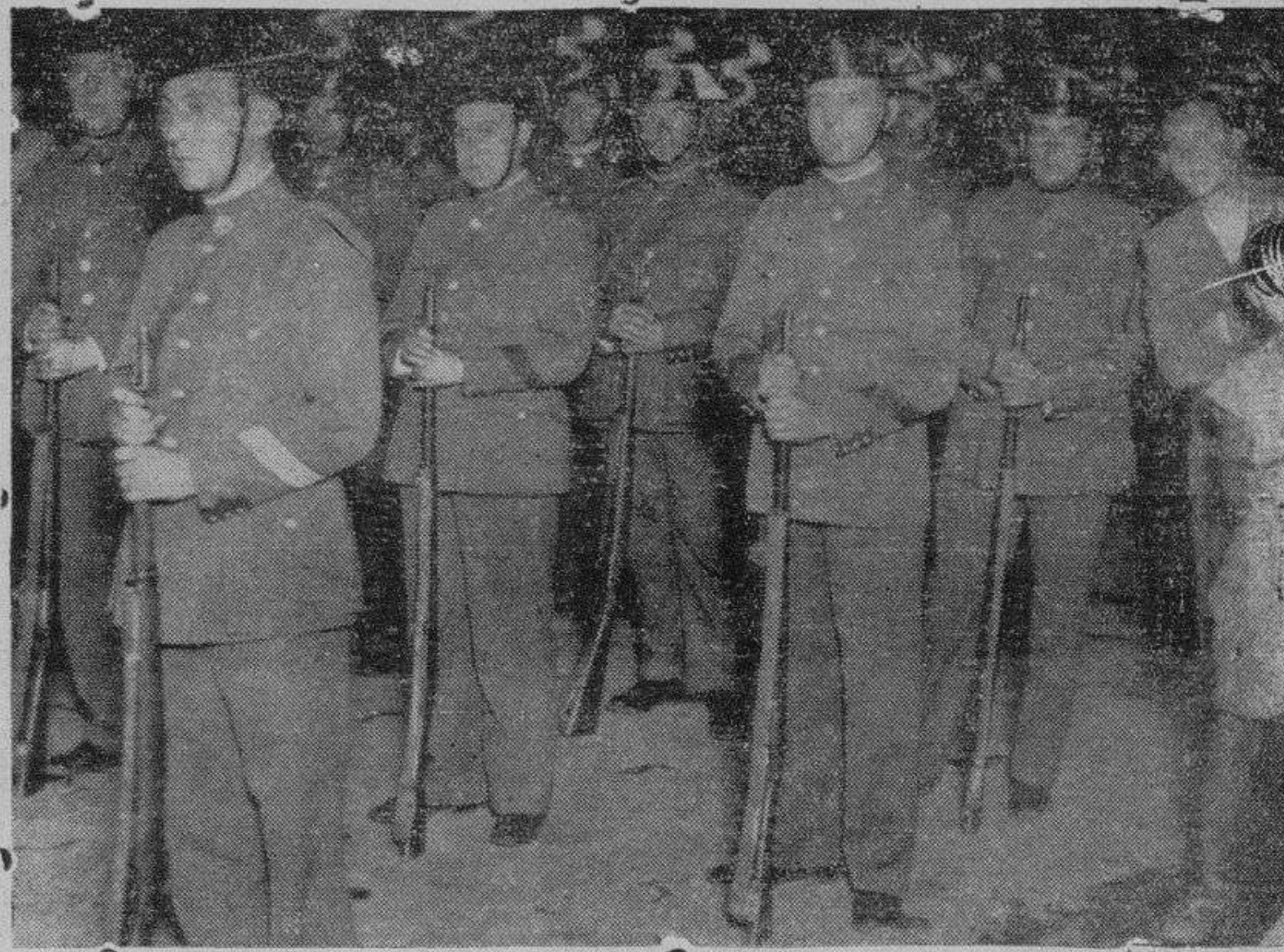
El benemérito Cuerpo de la Guardia civil, formado en la Plaza Mayor