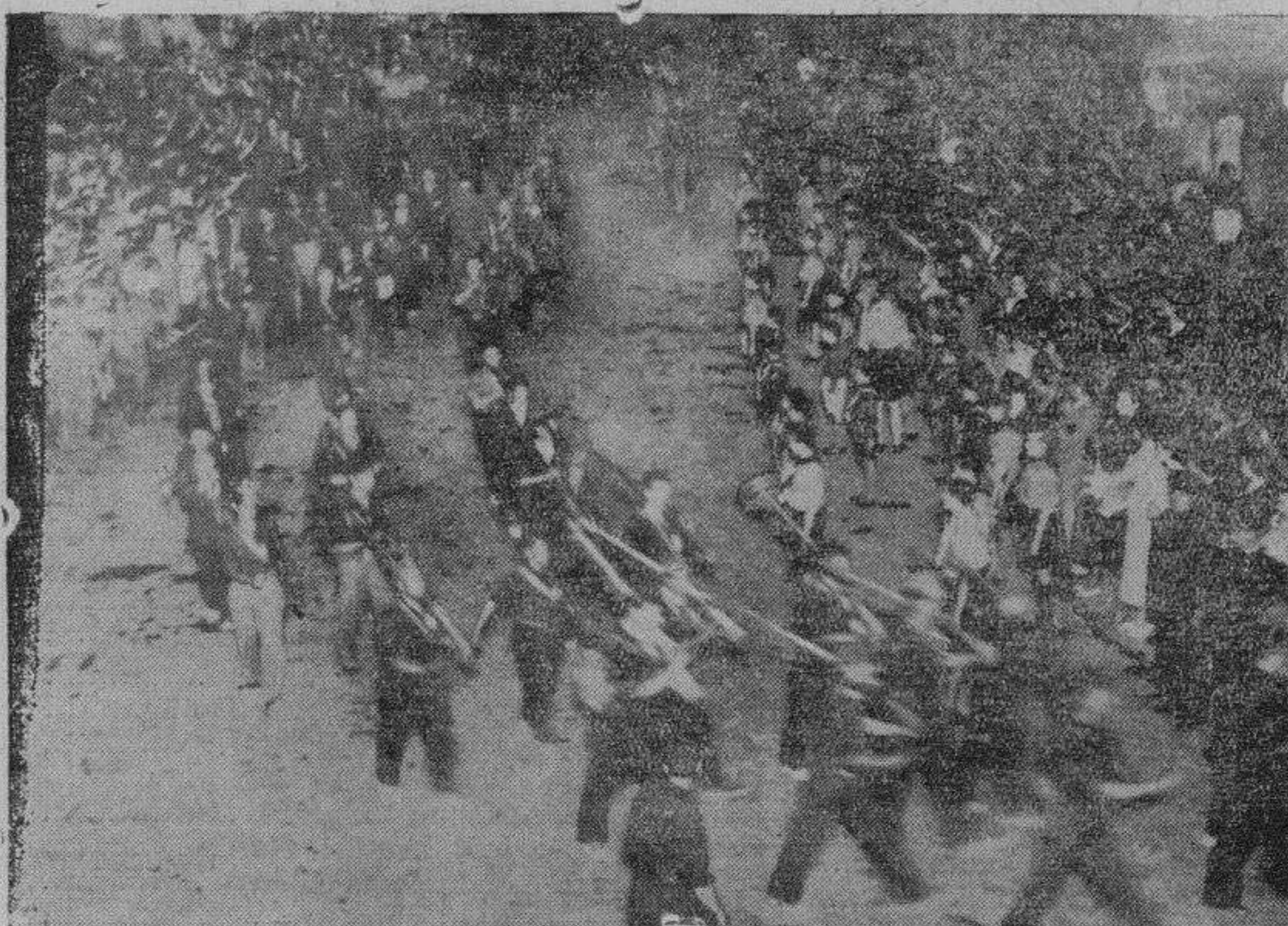
Aspecto de la Plaza Mayor durante el desfile de anteanoche

que tocaba su cabeza con la boina roja, dijo: —Salmantinos: Al llegar esta tarde a Salamanca, me encuentro con este espectáculo grandioso y representativo de la unión que liga a todos para defender y salvar la Patria, estando todos dispuestos, en esta sacrosanta cruzada, a exterminar y aplastar