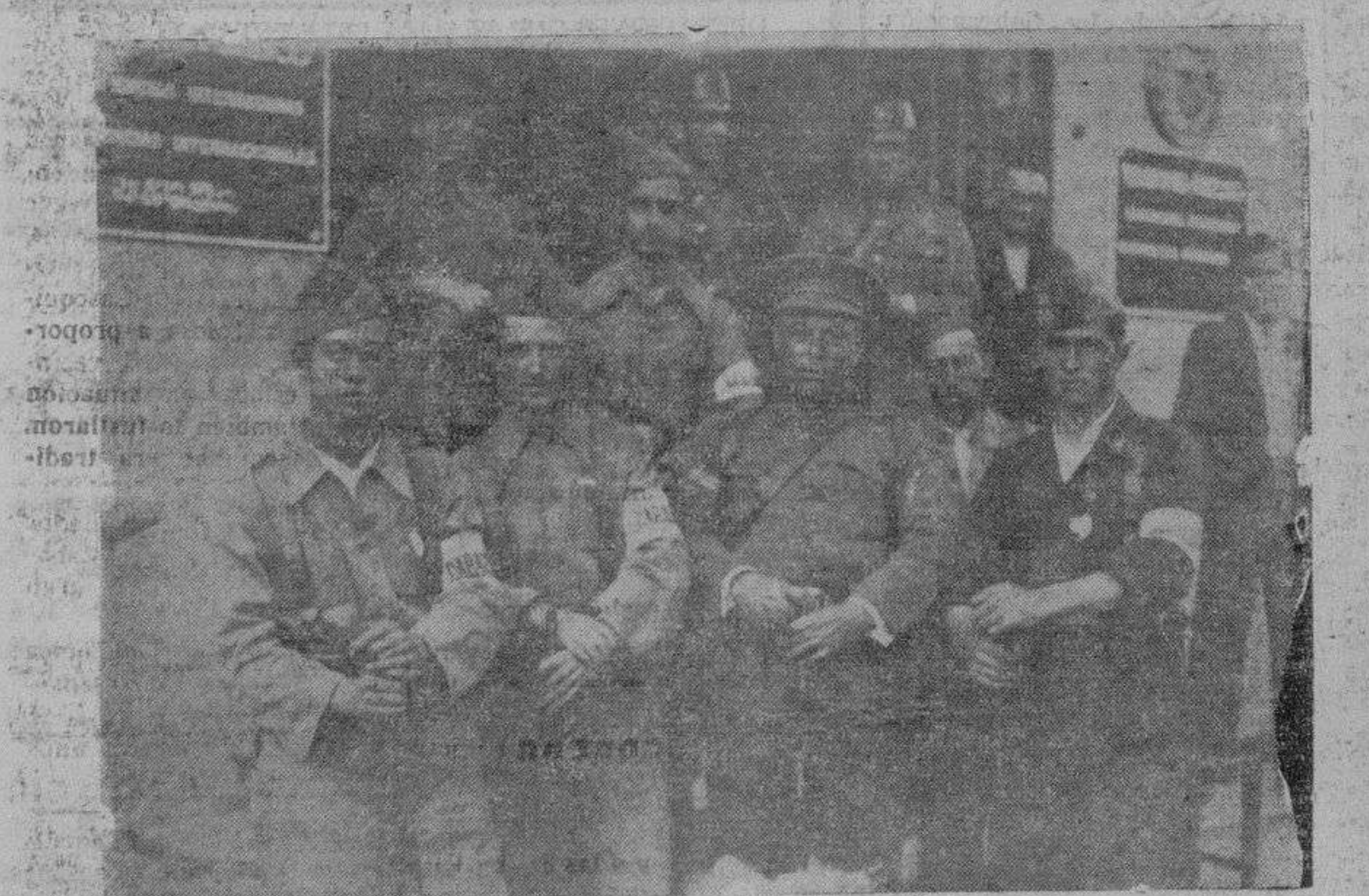
Los carabineros voluntarios prestando servicio de vigilancia en la Central Telefónica

Añade el preámbulo que desde los primeros días había tomado la Junta de Defensa Nacional medidas encaminadas a este fin; pero teniendo noticias que hay industrias cuyos directores locales aparecen con ánimo tibio ante la causa de España, con el pretexto de su incommunicación con los Consejos de Administración, y en atención a estas circunstancias y condecoraciones, el presidente de la Junta de Defensa Nacional decreta la constitución de Comisiones provinciales, integradas por el Gobernador civil de la provincia, Delegado de Hacienda, director de la Sucursal del Banco de España, Ingeniero