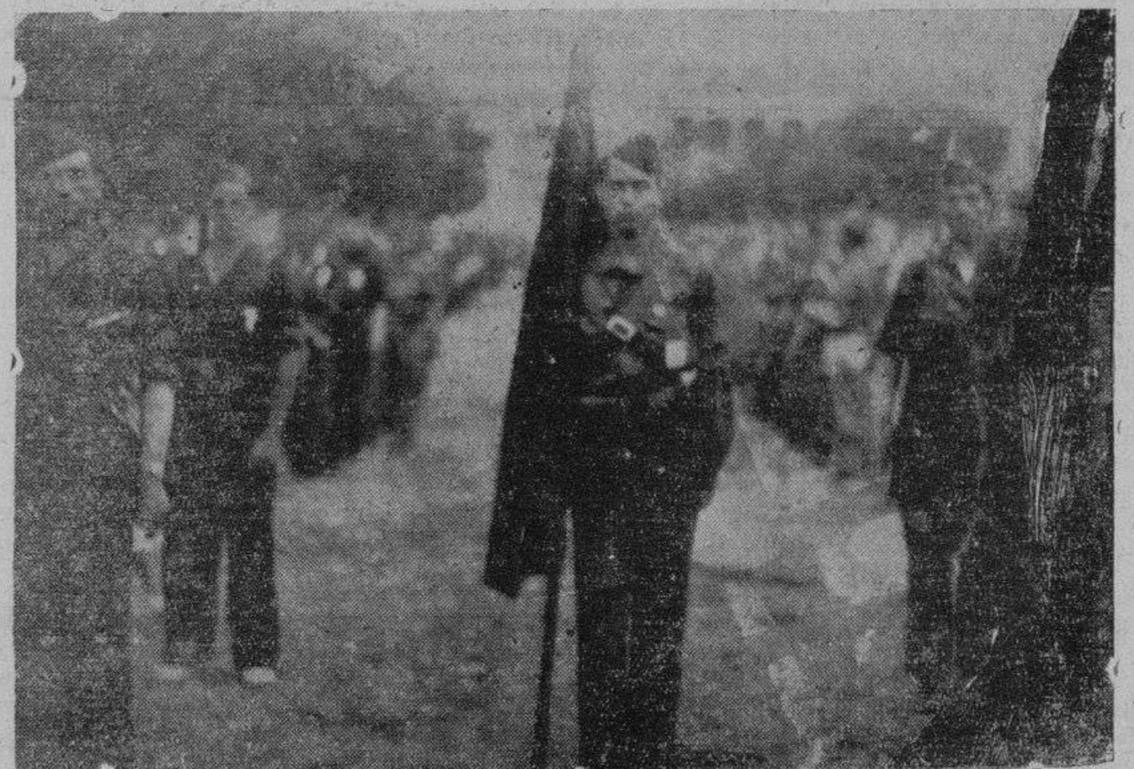
La bandera de Falange Española, preparada para iniciar el desfile