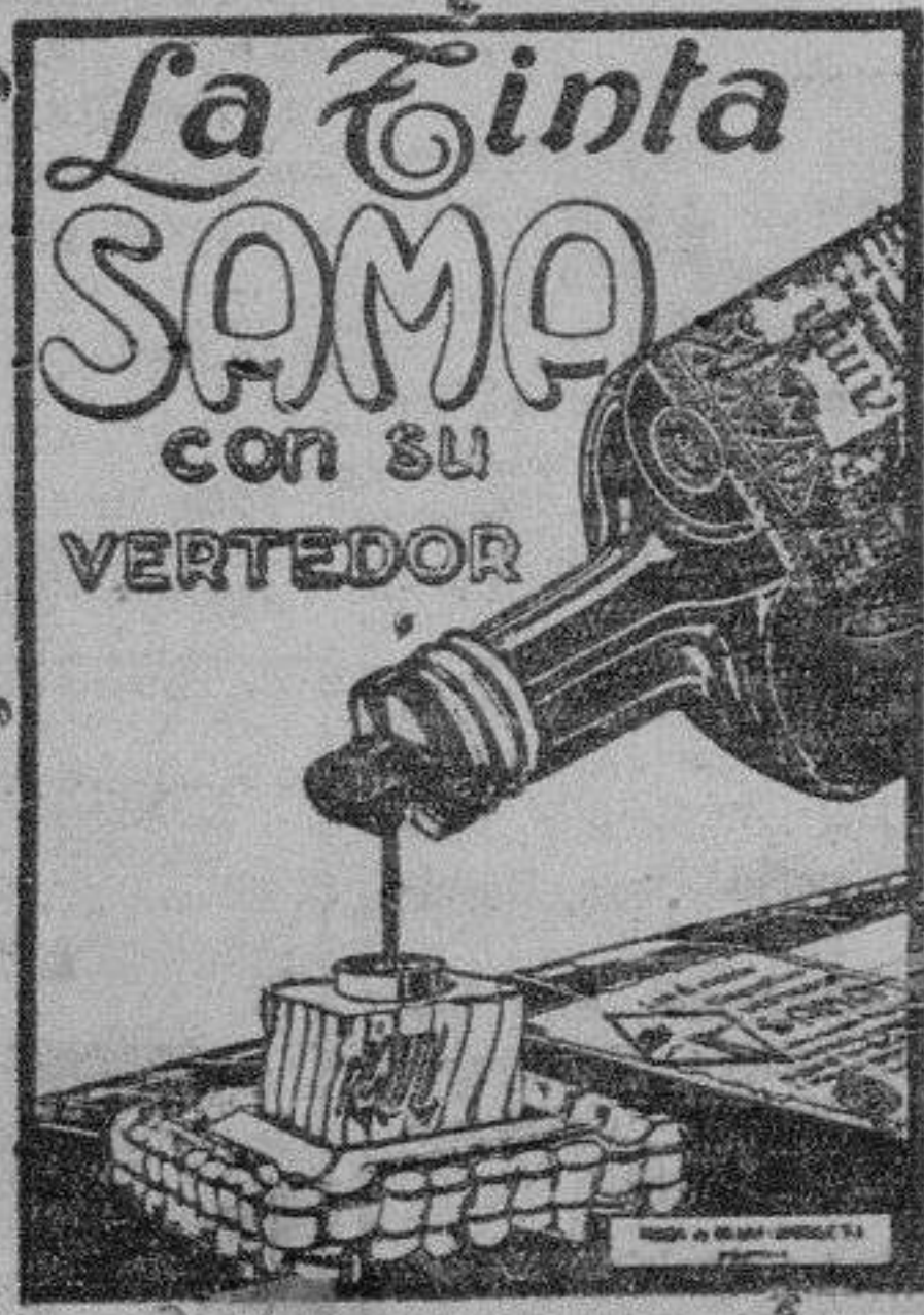
DE VENTA EN LAS BUENAS PAPELERIAS