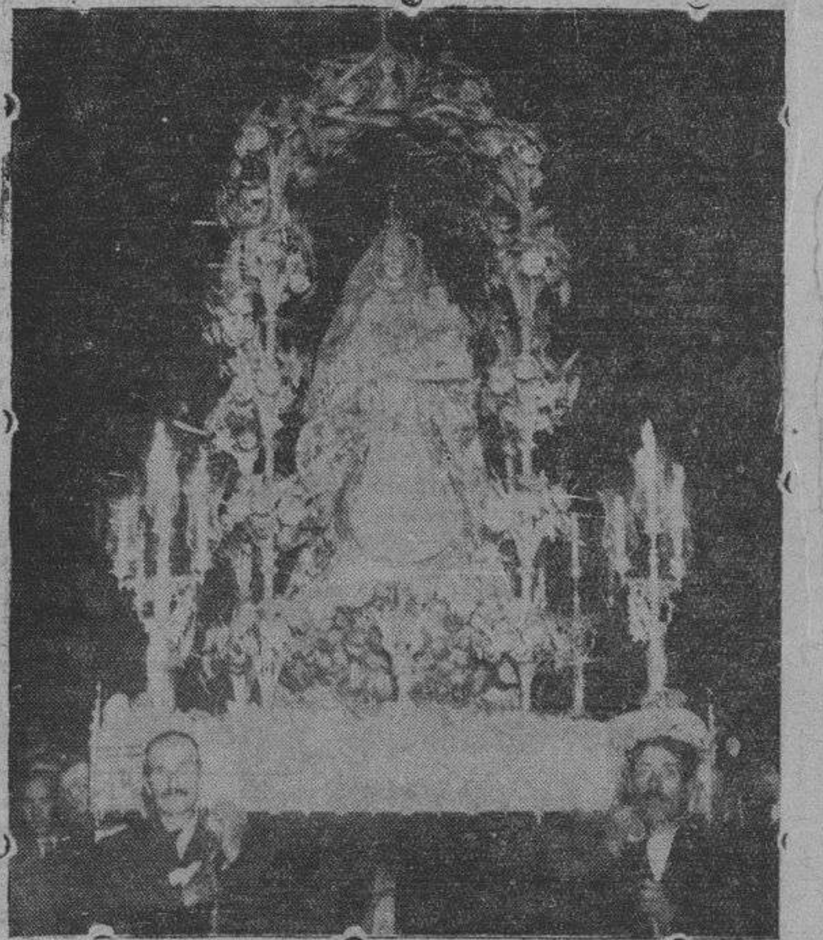
La imagen de Nuestra Señora del Rosario, a su paso por la calle de San Pablo, durante la procesión celebrada el domingo