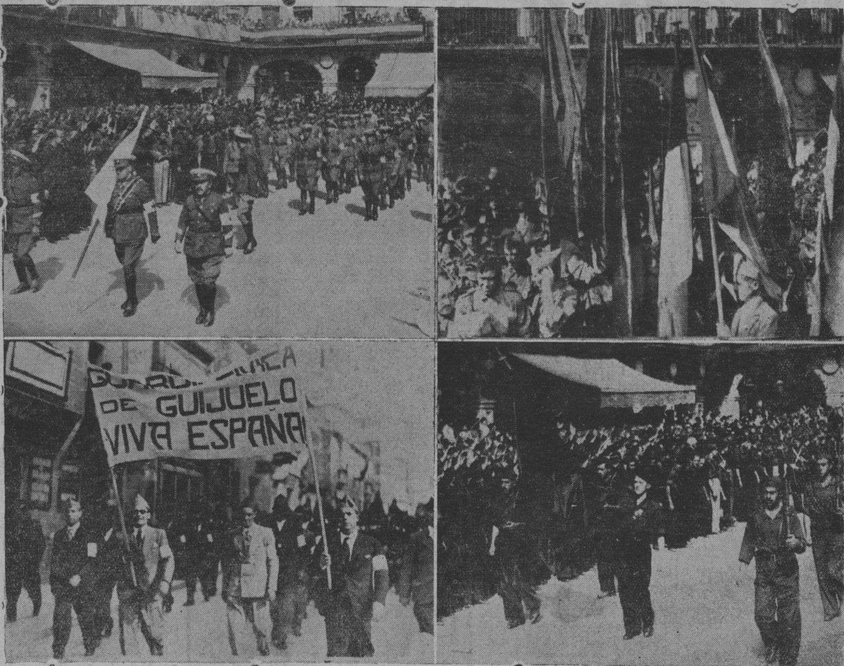
Notas gráficas de los brillantes actos del domingo: La sección de la Cruz Roja, las banderas de las distintas milicias, la Guardia Civil de Guijuelo y la enseña de Falange Española, durante el desfile por la Plaza Mayor

INVERNADERO DE OVEJAS. —Se arrienda el de HERNANDECHO y LAS CUESTAS. Informarán, Avenida de Mirat, 6, segundo derecha. 15-a-1