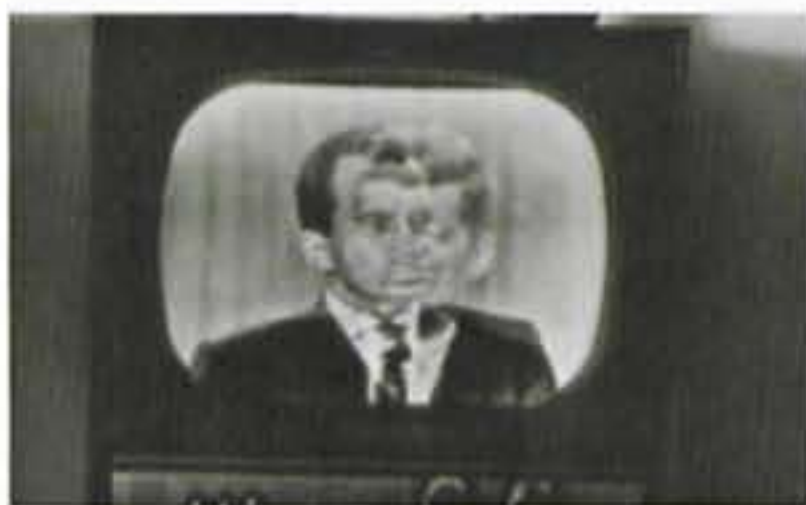
UN POLÍTICO EN LA FAMILIA