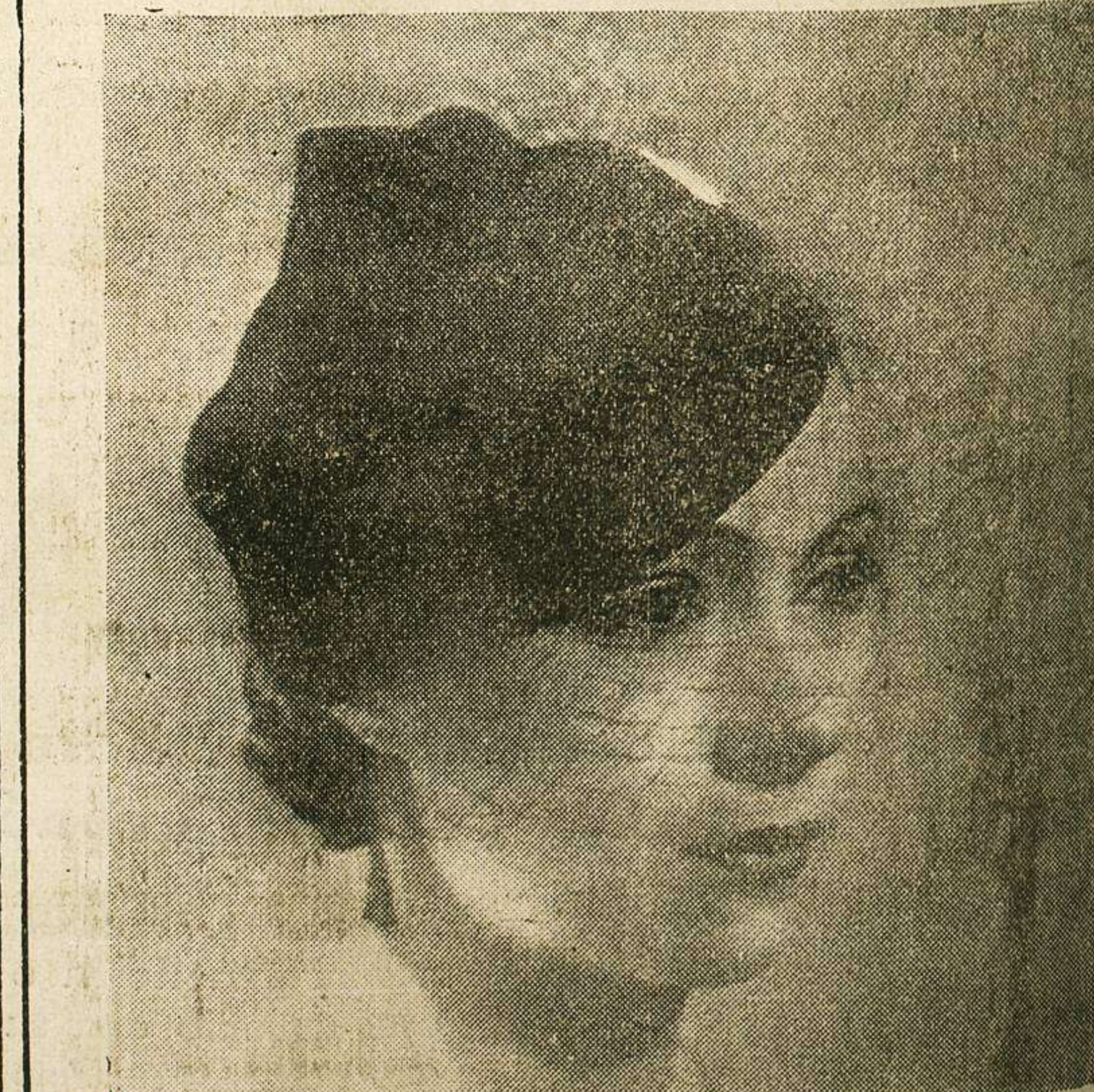
El velillo se hace ahora con rejillas muy anchas y espesas; no se sujeta con nada, y sólo se mantiene sobre el sombrero gracias a la consistencia de la materia. Ved este velillo que adorna una toca de terciopelo negro en forma cómica