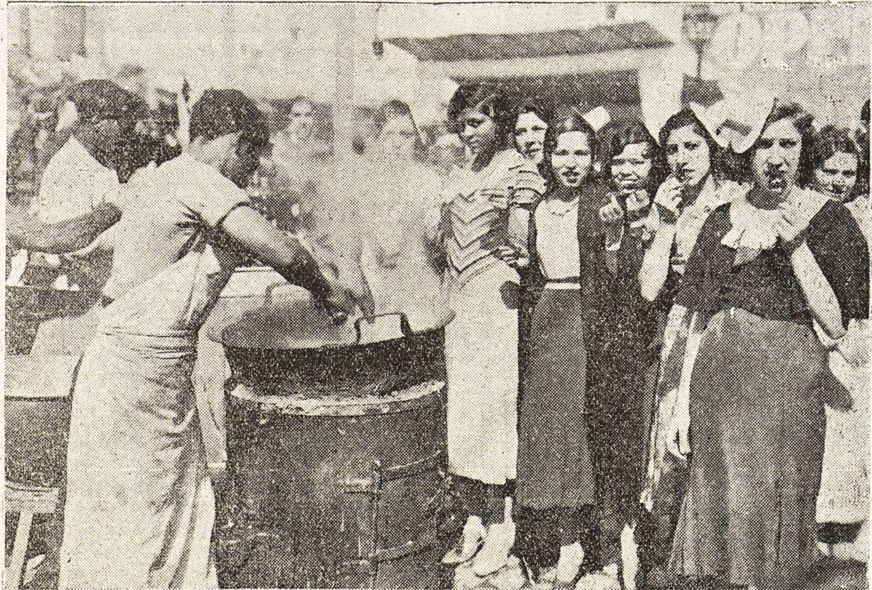
Estas castizas madrileñas no faltan a una verbena, como tampoco dejan de comerse los churros calentitos.