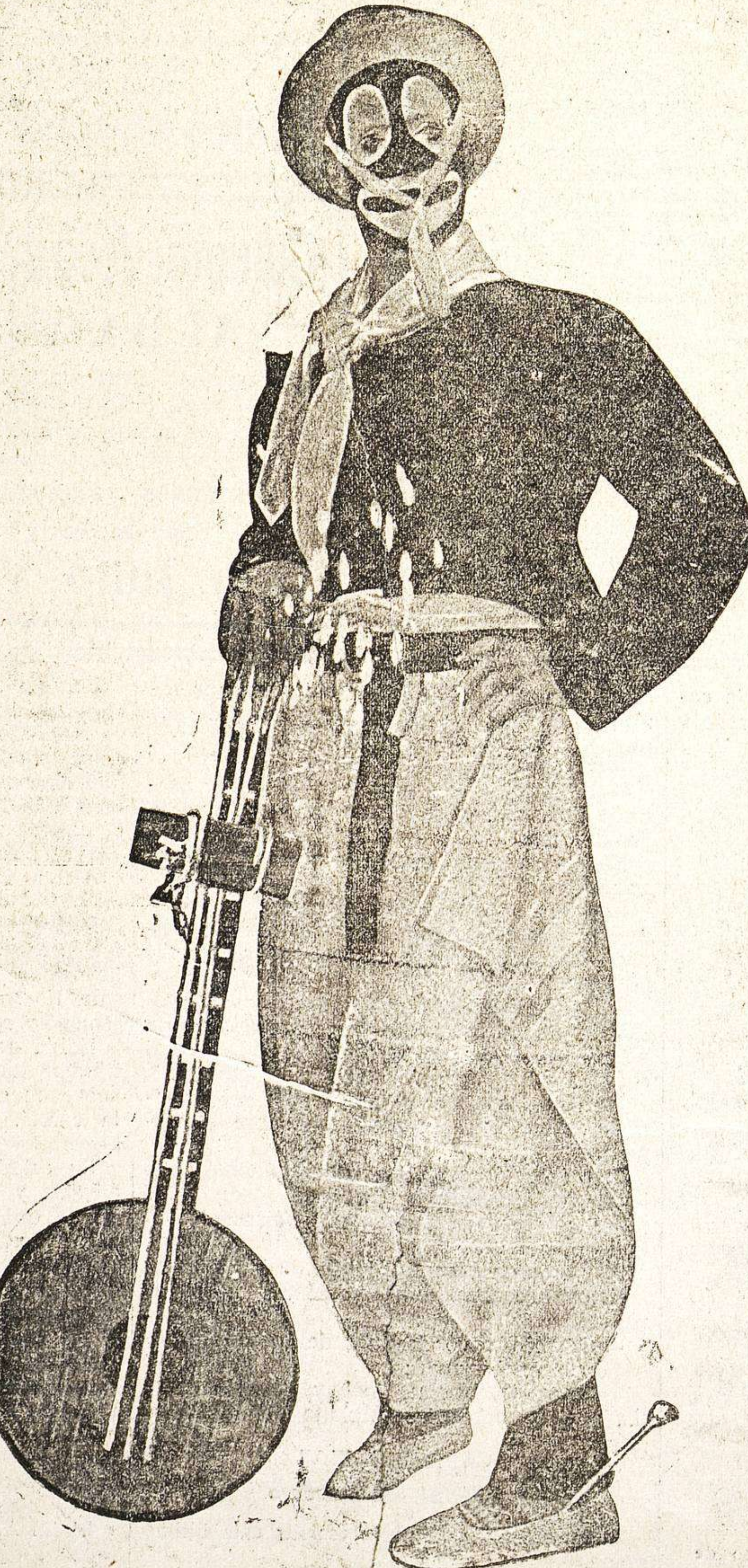
RAMPER, el célebre caricató, que con su gran Compañía debutará mañana en el teatro Bretón

Buscaron amparo en las tapias de un huerto propiedad de Isidro Formoso, y éste que se hallaba por allí con una escopeta, al verlos correr hacia el huerto y situarse junto a las tapias, creyó que trataban de cogerle la fruta y... ¡pum!, les soltó una perdigonada que les va a dar que hacer, antes de que puedan sentarse.