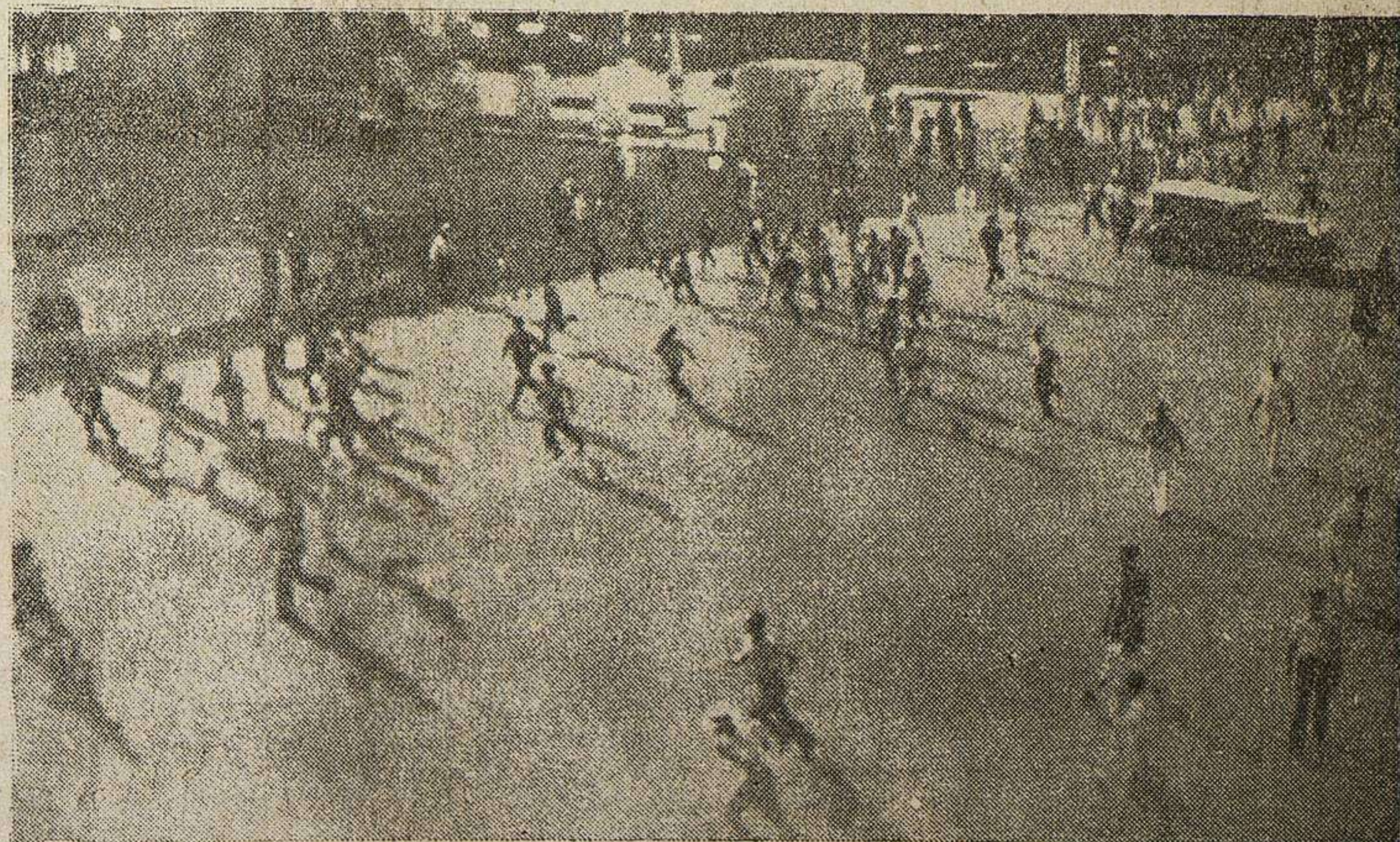
Durante los últimos días de la dictadura de Machado, se vieron con desgraciada frecuencia, escenas como la que recoge la foto, en que la multitud huye de los disparos de las ametralladoras, emplazadas en el Capitolio, donde el dictador cubano vivía la angustia de unas horas decisivas