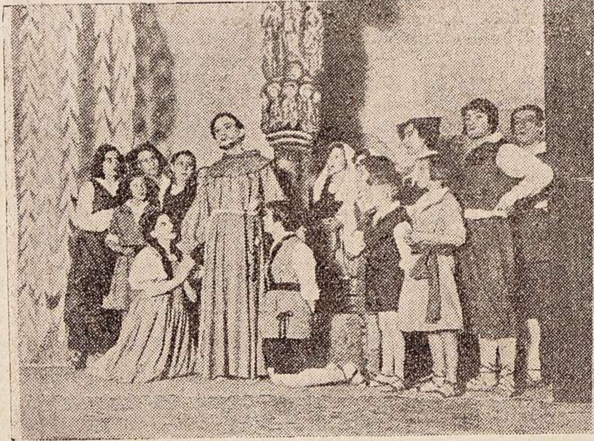
Una de las más emocionantes escenas del drama histórico religioso, de los señores del Campo y Martínez Tovar, «Francisco de Asís», estrenado con gran éxito en el Coliseum, de Madrid, y que hoy se representa por primera vez en el teatro Liceo, de esta

La segunda es el origen ilegal de esas autoridades, nacidas casi siempre de un golpe de mano o de un simulacro electoral. El punto de partida de las instituciones que representan el orden no es el más indicado para imponer respeto y ocurre a menudo que el ejemplo del éxito