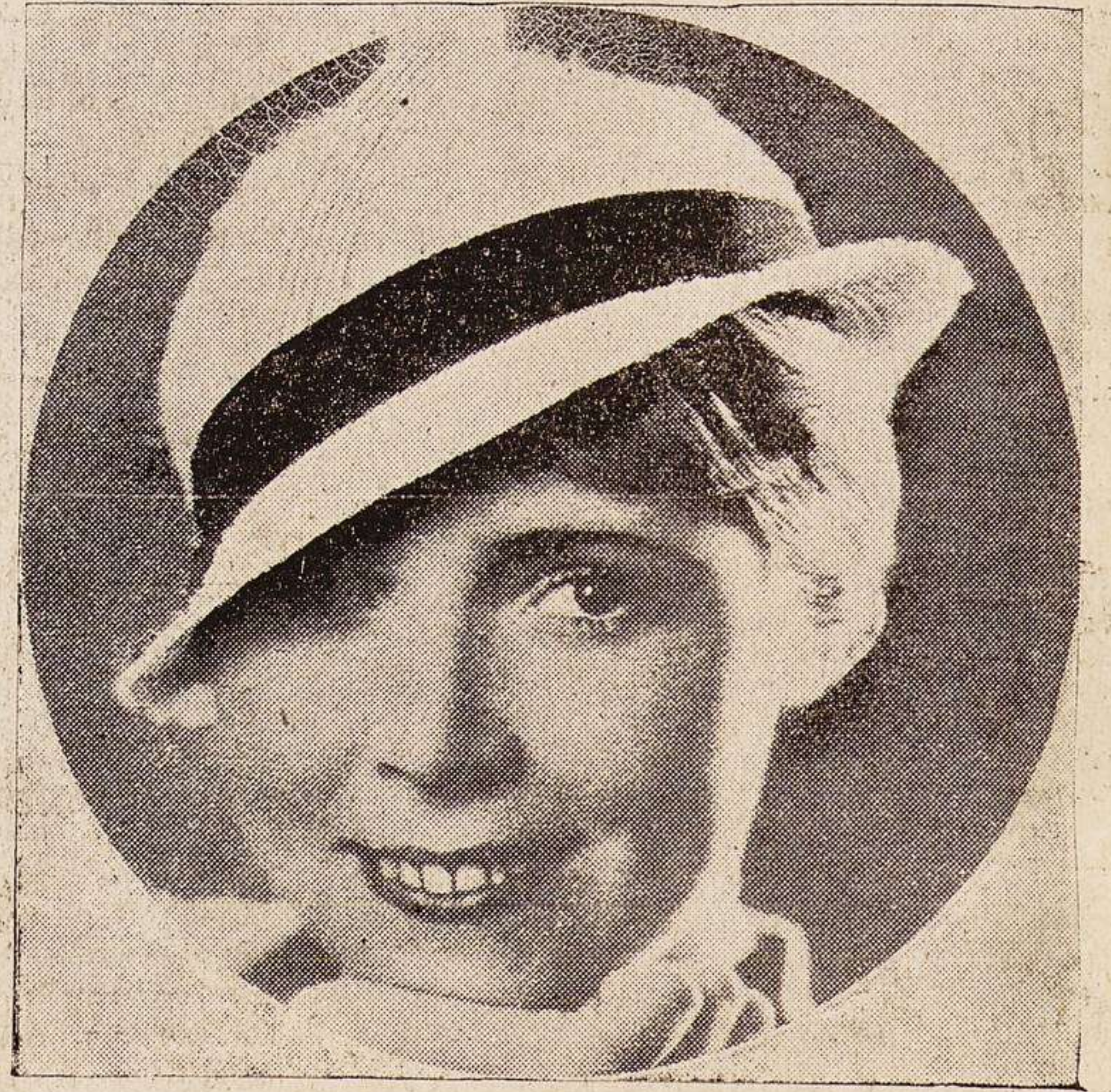
Nota de los sombreros de moda es la sobriedad. Este modelo es blanco, adornado sencillamente con una cinta de «reps» azul. No cabe mayor simplicidad de línea y de confección