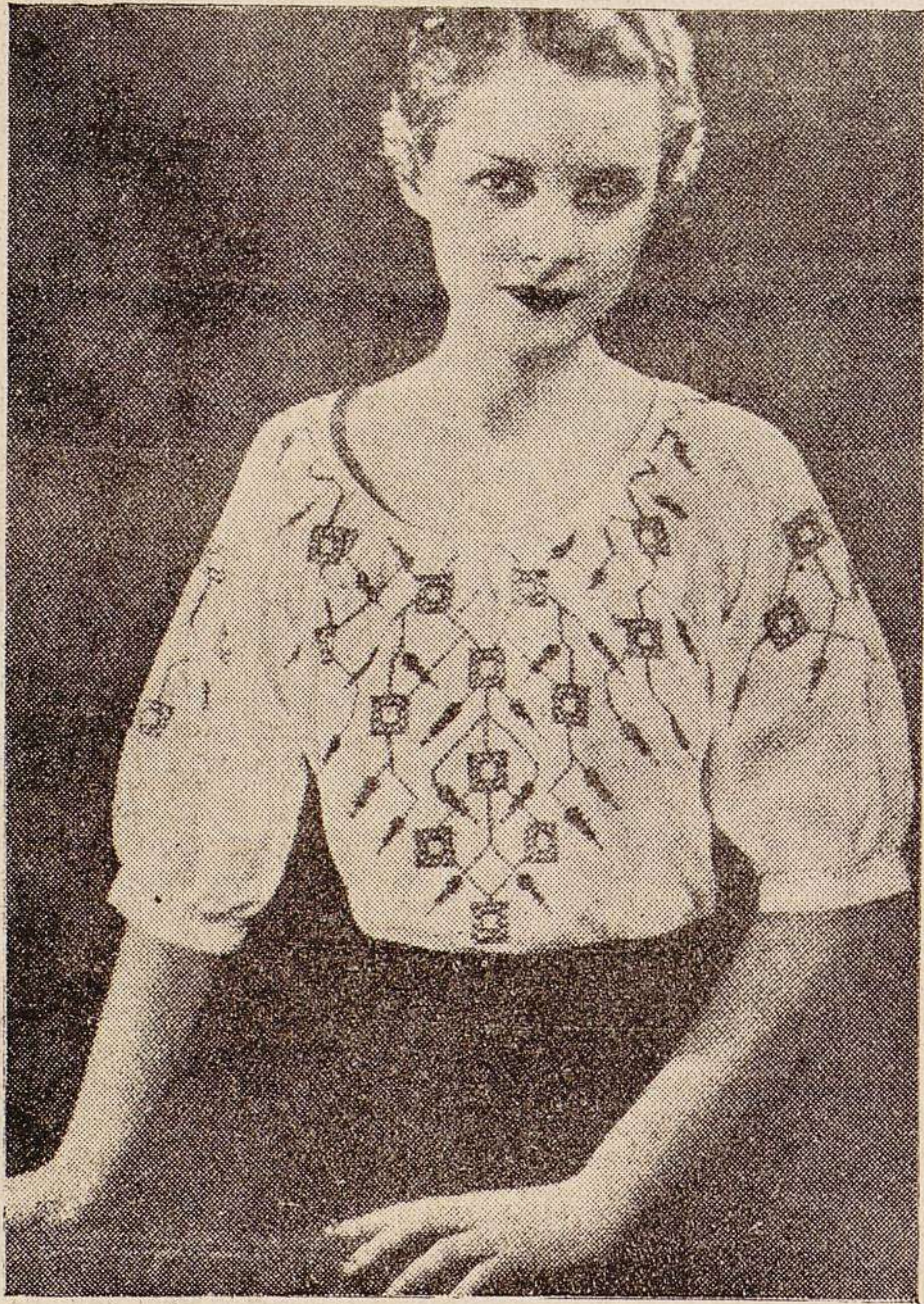
Blusa de voile, adornada con cuadros bordados con azul, y el resto del adorno, negro y rojo