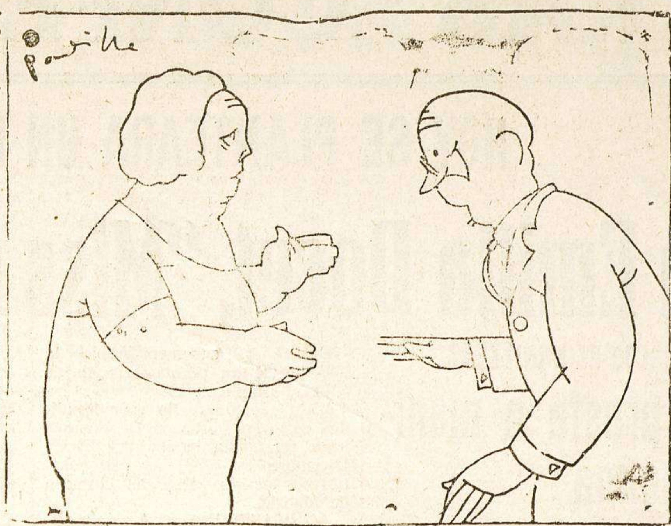
Deberia usted vacunarse, señora. A mi no me hace falta, doctor. ¿Ya lo cree? No ha oido usted decir que a la vejez viruelas?