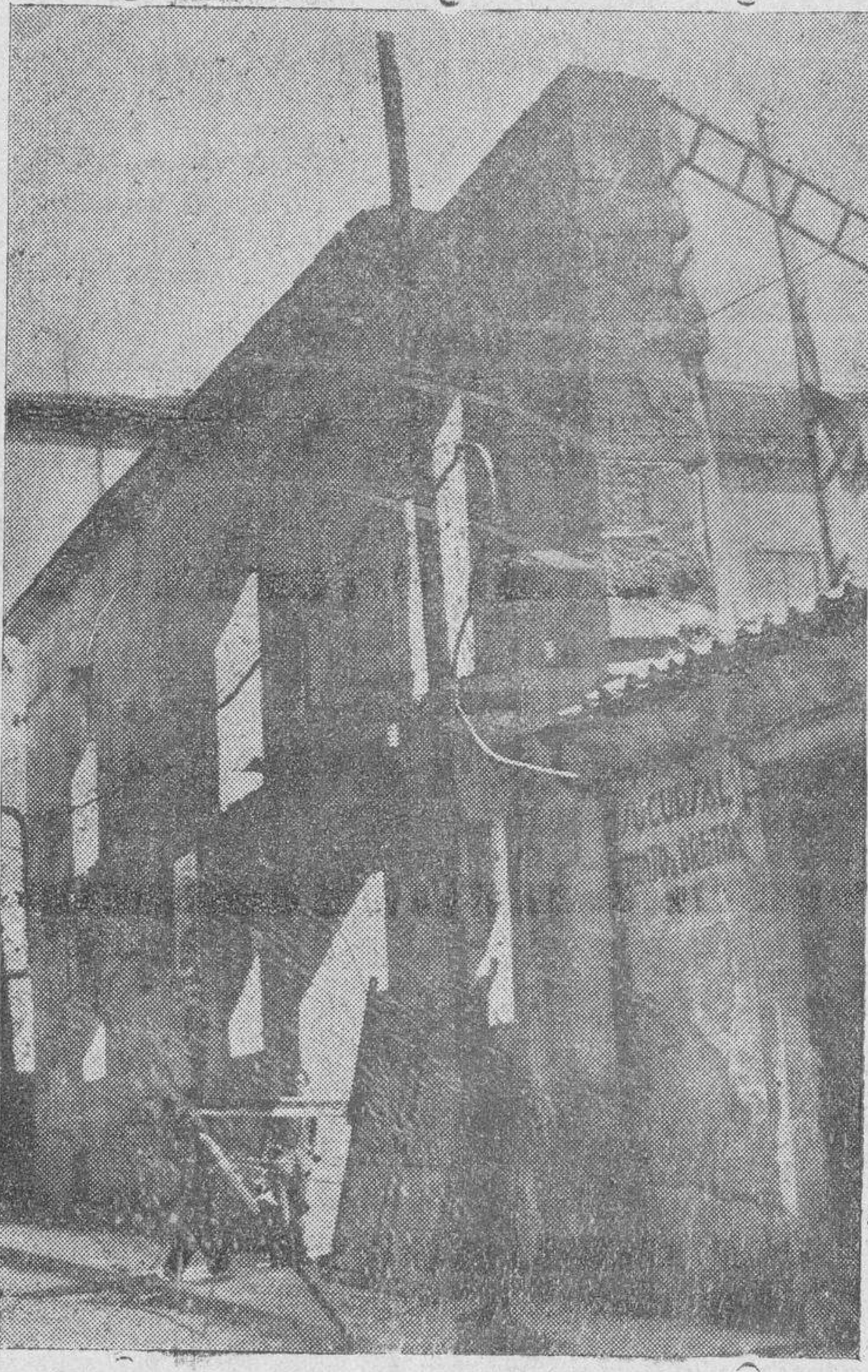
El lugar del accidente

Salamanca, 15 de Abril de 1936.—El Presidente, Manuel del Bus-to.