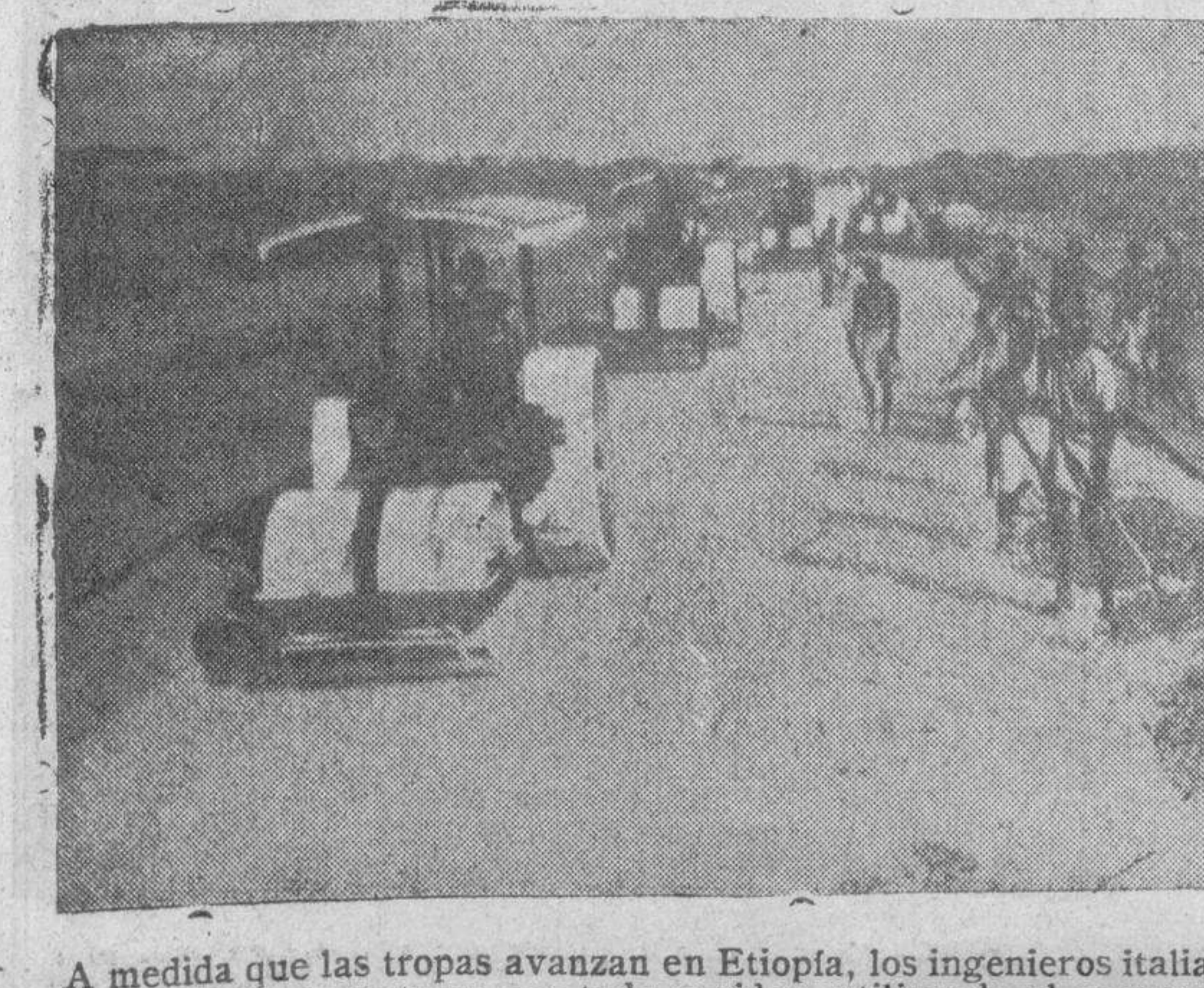
A medida que las tropas avanzan en Etiopía, los ingenieros italianos se ocupan en la construcción de carreteras con toda rapidez, utilizando el concurso de obreros indígenas