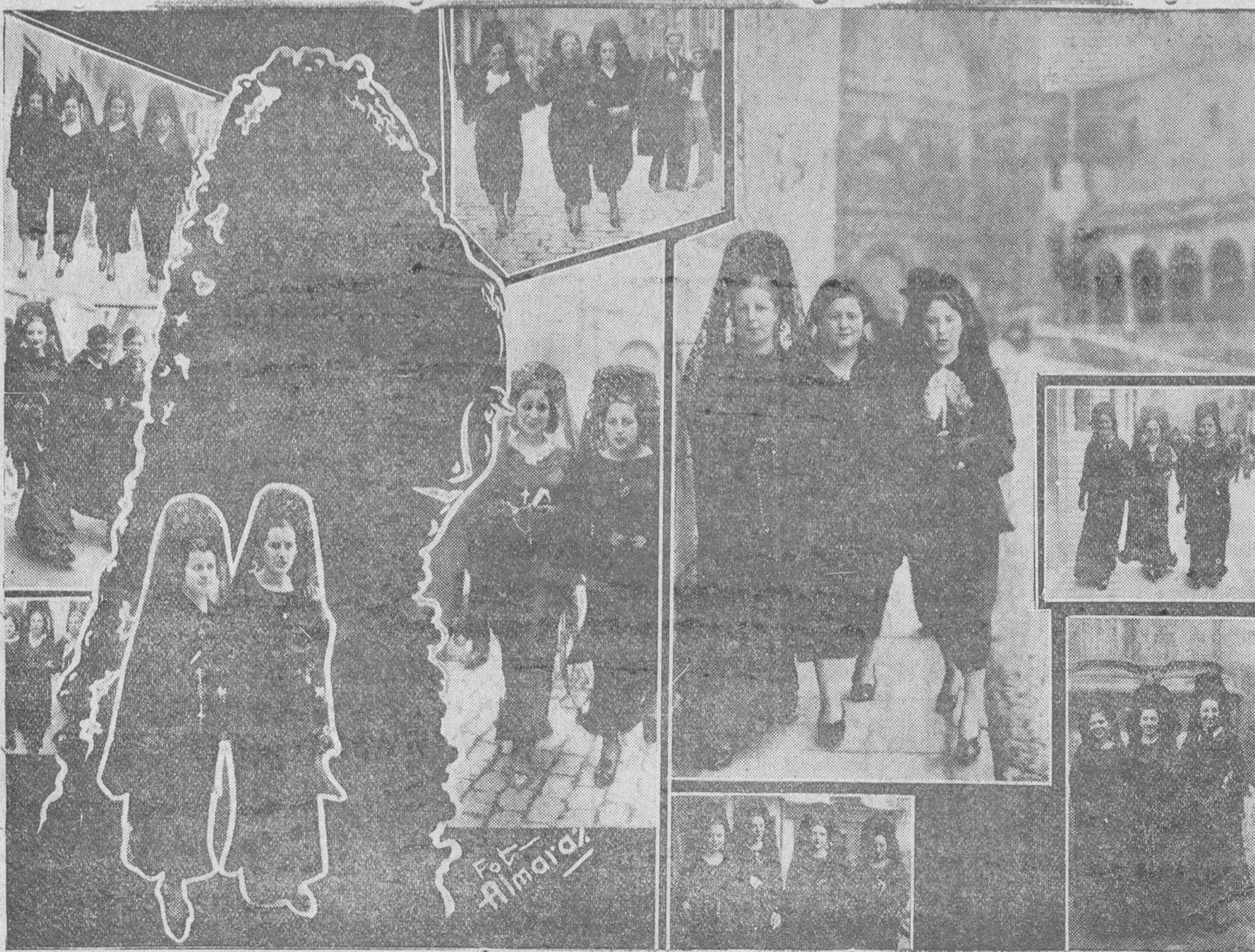
Grupos de bellas señoritas salmantinas que, ataviadas con la clásica mantilla española, desfilaron por las calles de nuestra ciudad durante el día de Jueves Santo, en la tradicional visita a los monumentos