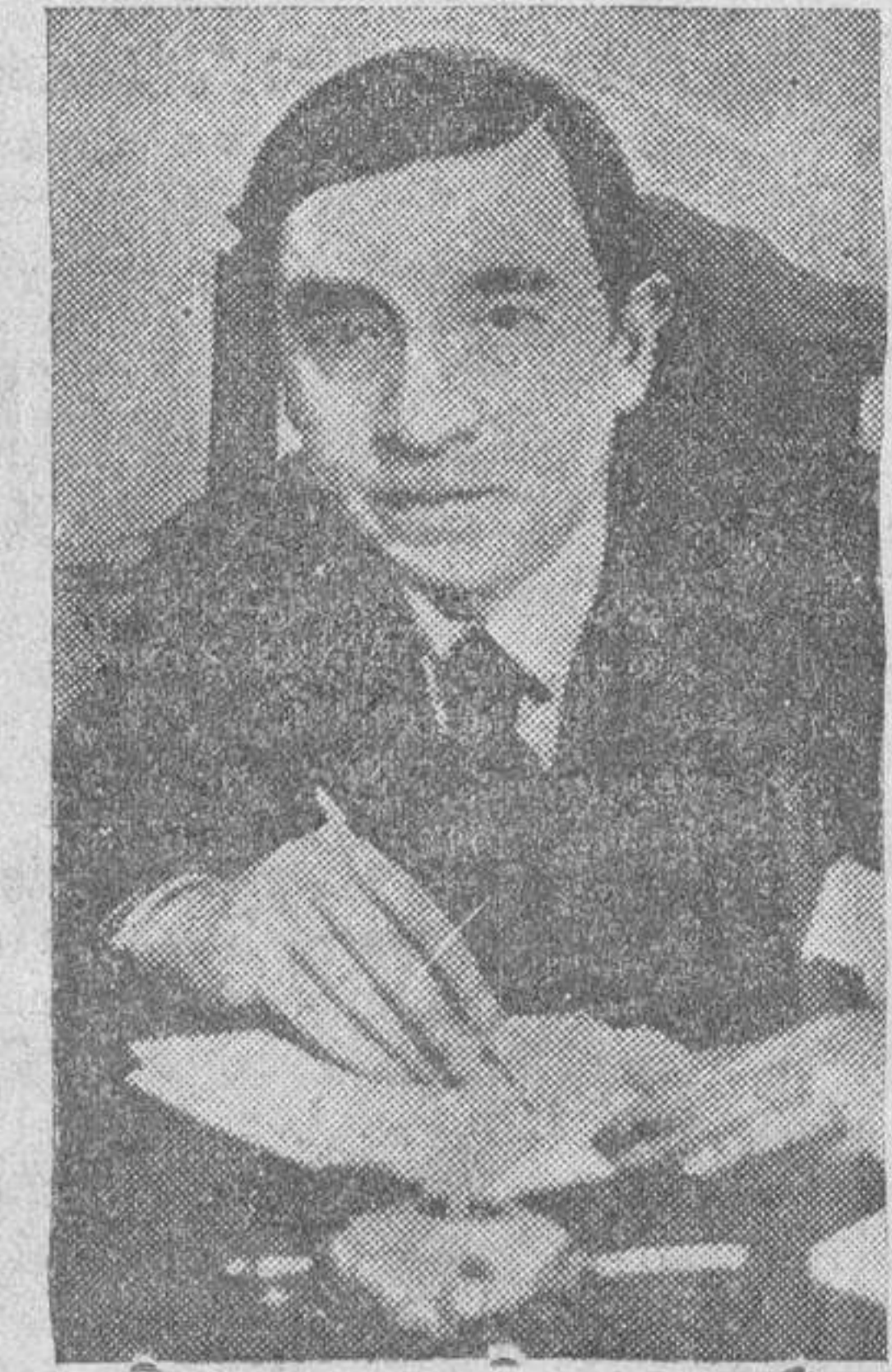
El ilustre poeta don Francisco Villaspesa, que falleció el pasado jueves en Madrid