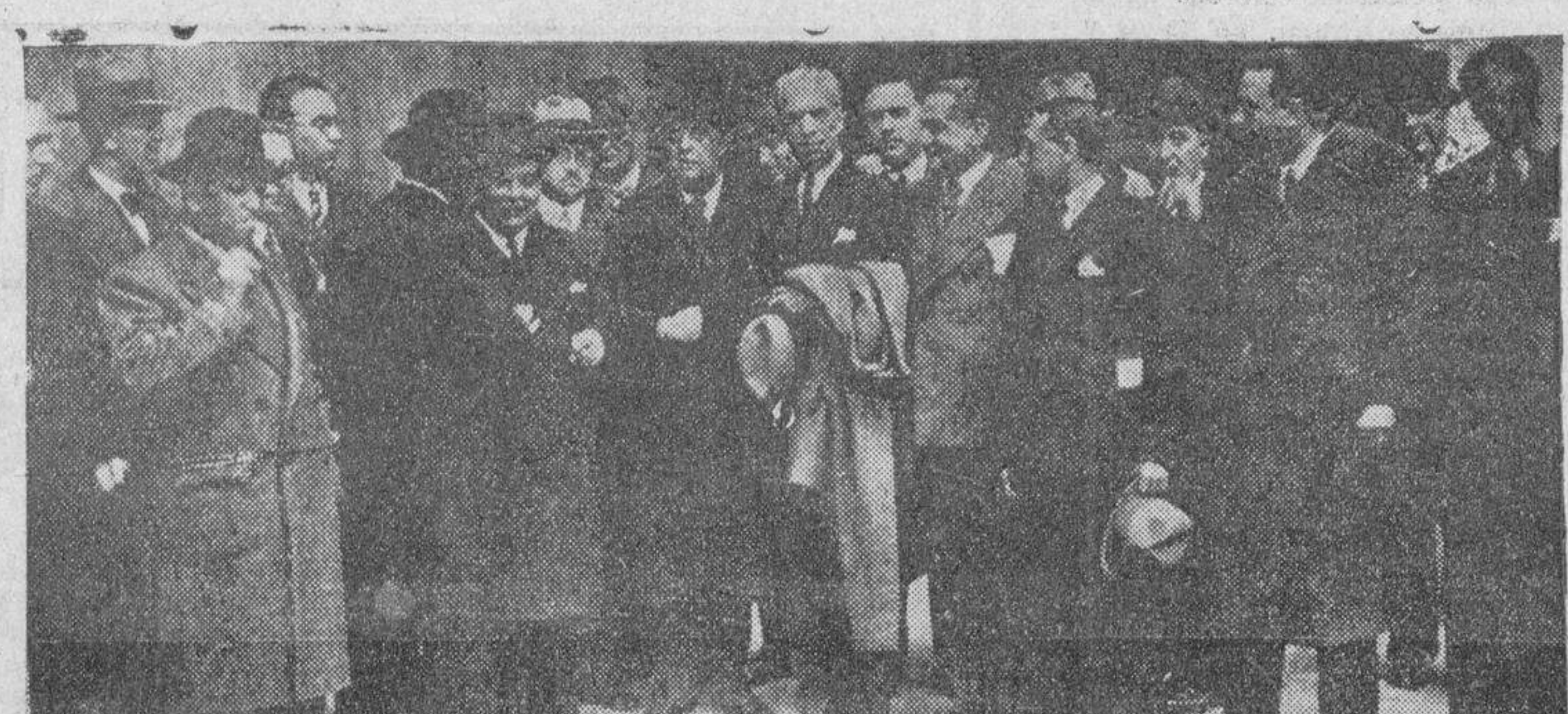
Diputados de la minoría de Unión Republicana, entre los que figuran los ministros de Justicia, Comunicaciones e Industria y Comercio, al salir de la visita que hicieron al Jefe interino del Estado, don Diego Martínez Barrio