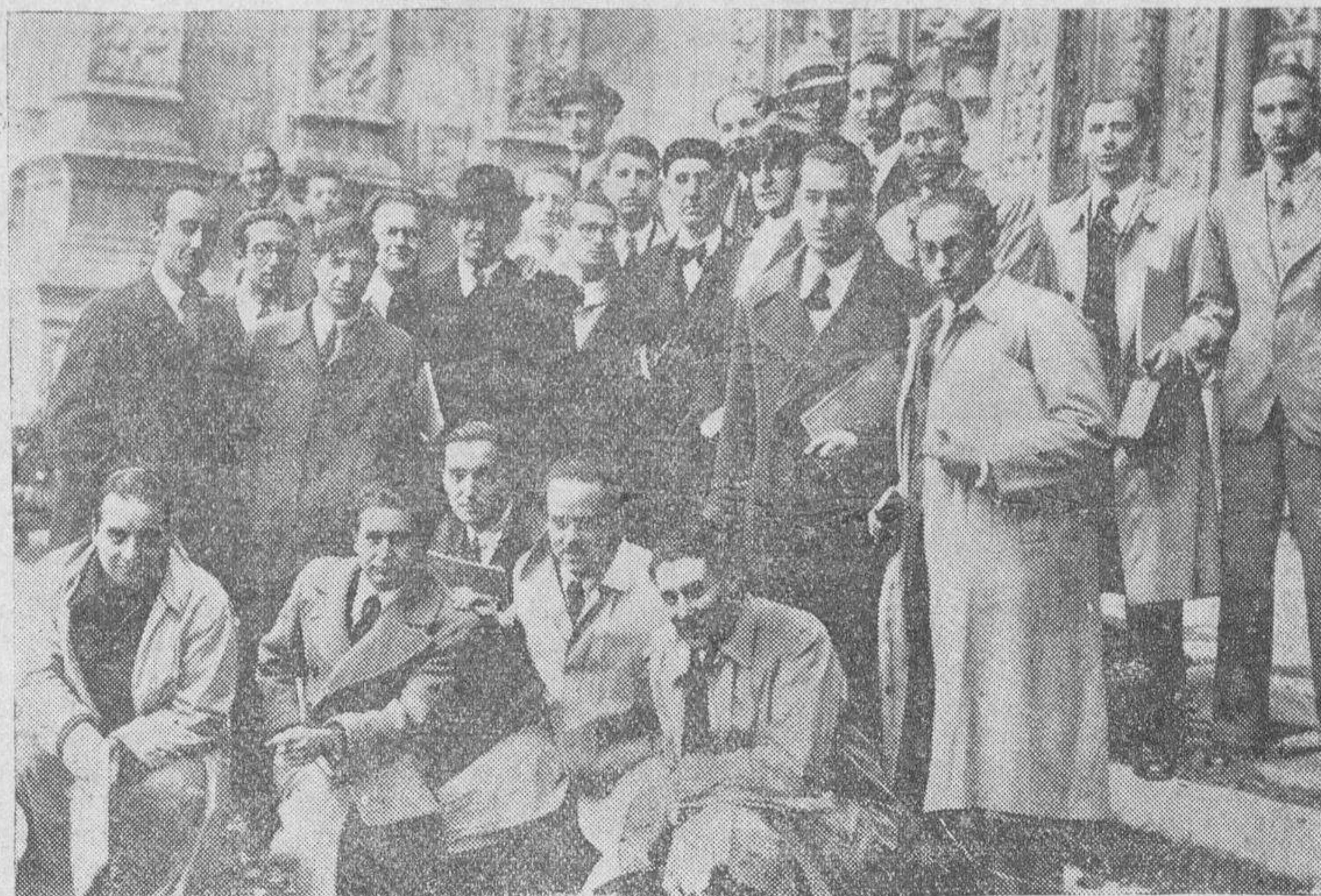
Los alumnos de la Escuela de Arquitectura, que han permanecido unos días en Salamanca en viaje de estudios