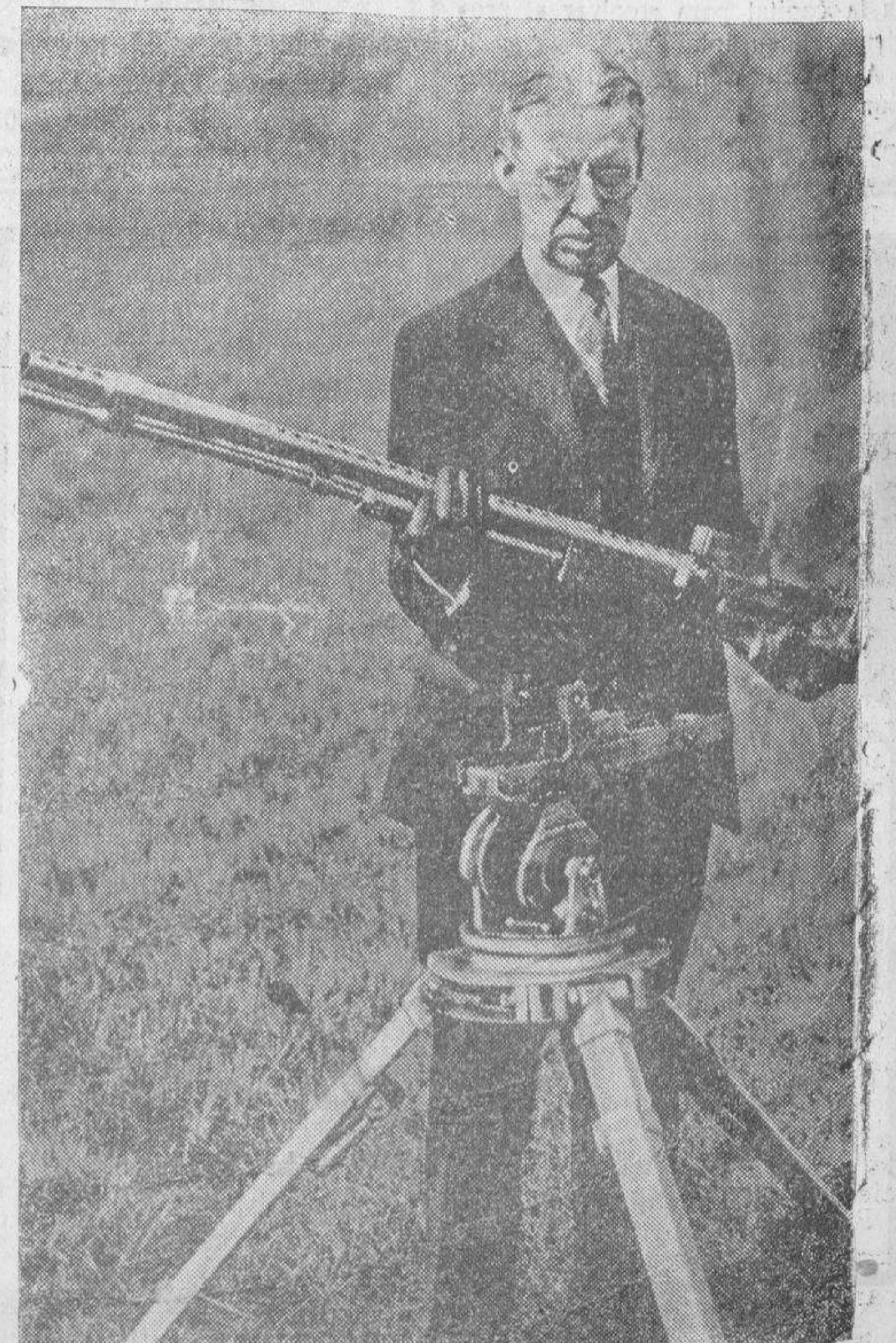
He aquí un nuevo modelo de ametralladora, que un ingeniero yanqui acaba de inventar y que alcanzará un blanco situado a diez kilómetros de distancia