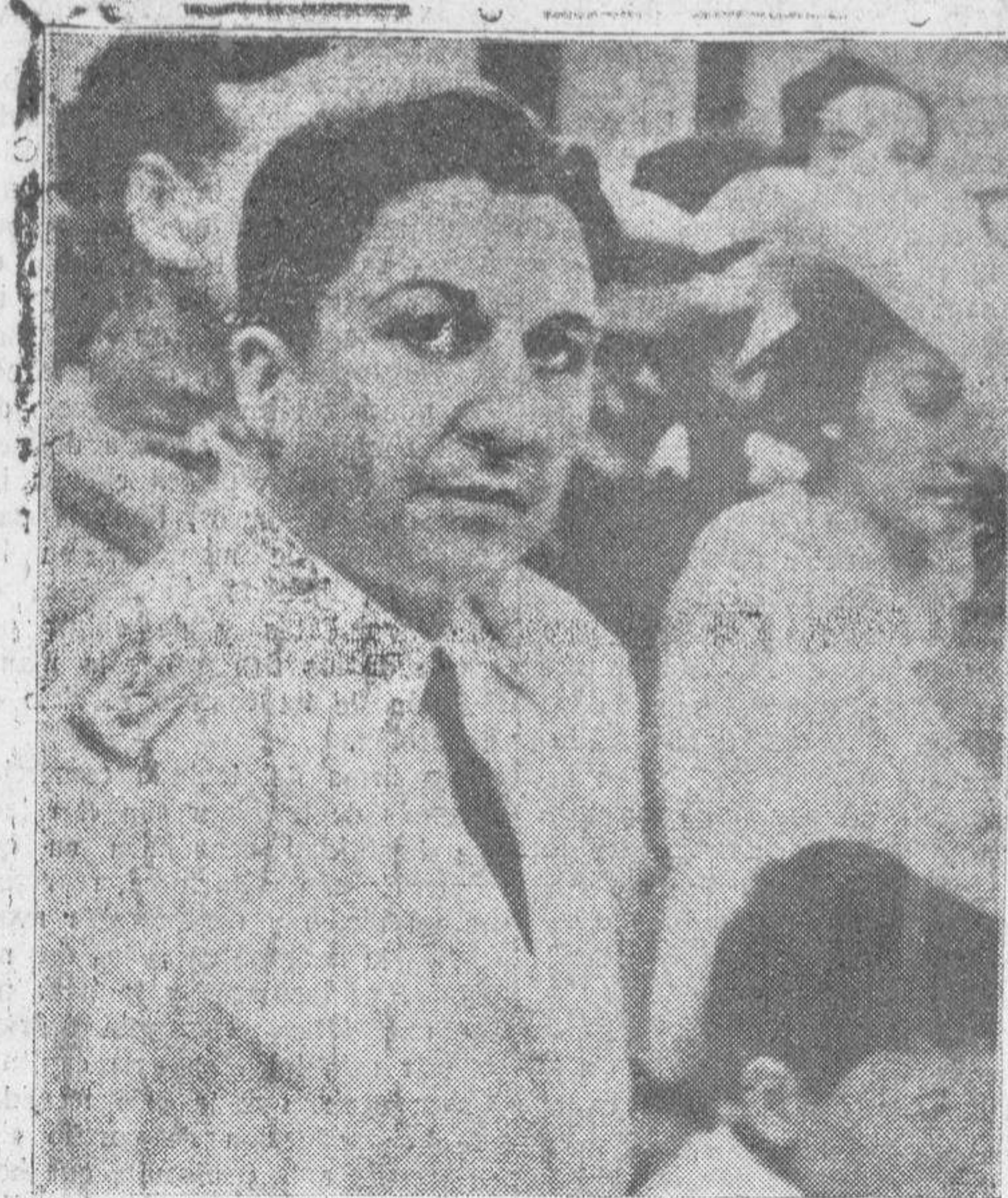
El general don Rafael Franco, héroe de la guerra del Chaco, que ha asumido la Presidencia del Gobierno militar de Paraguay, al que los Estados Unidos han prestado su reconocimiento