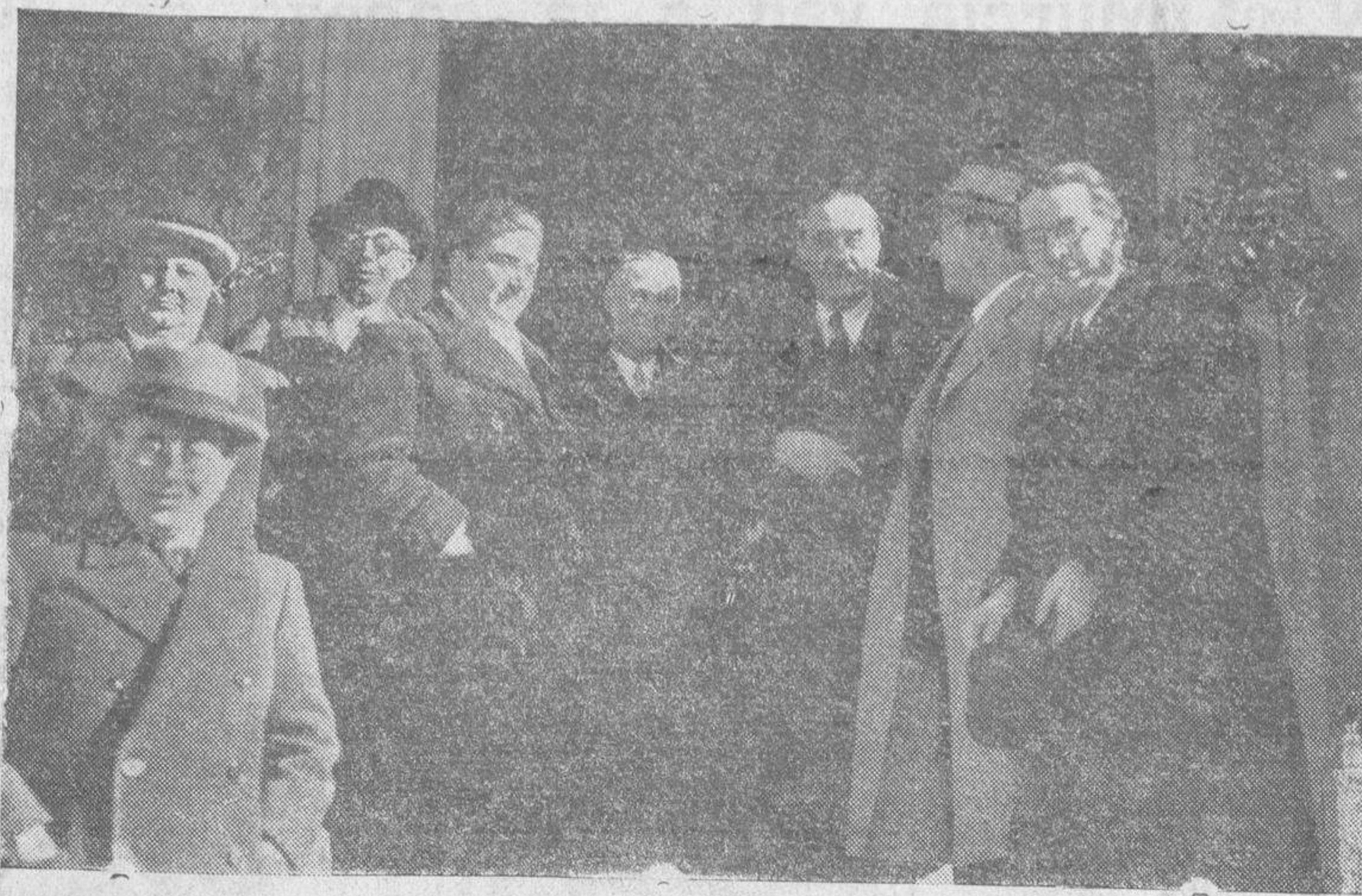
De paso para Zamora, el domingo estuvo unas horas en Salamanca el jefe del partido Republicano Conservador, don Miguel Maura. A saludarle al Gran Hotel, donde descansó unos momentos, acudieron numerosos correligionarios. He aquí al señor Maura con los miembros del Comité local del partido Republicano Conservador.