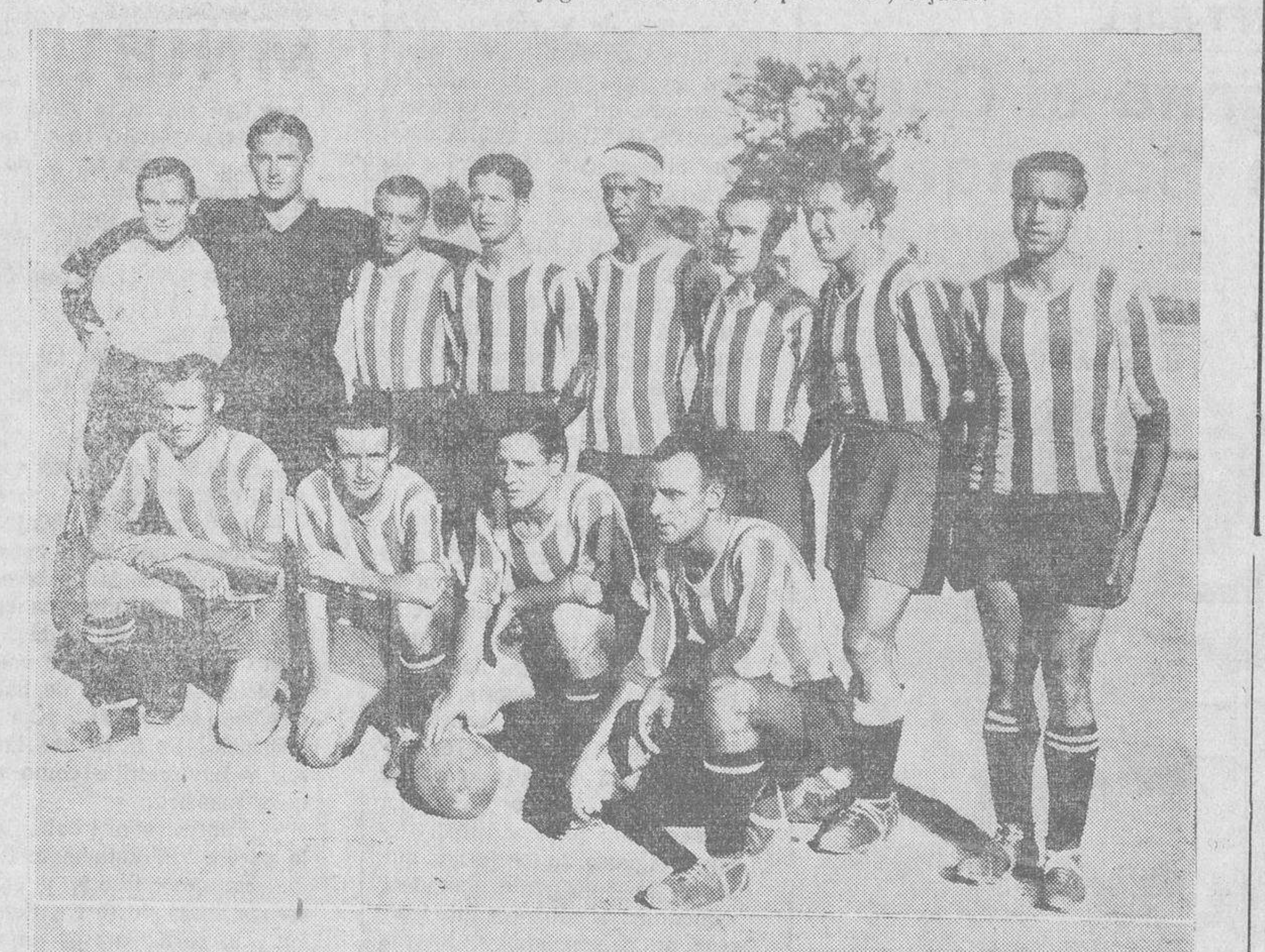
Los equipos del Patria y de la U. D. Salamanca que el domingo contendieron en el Campo de CaVARIO

Se jugó el encuentro de campeonato, primero de la temporada, en Salamanca, y nuestros muchachos, que en campos de Madrid y Aranjuez dieron la sensación de equipo cuajado, de saber adminis-