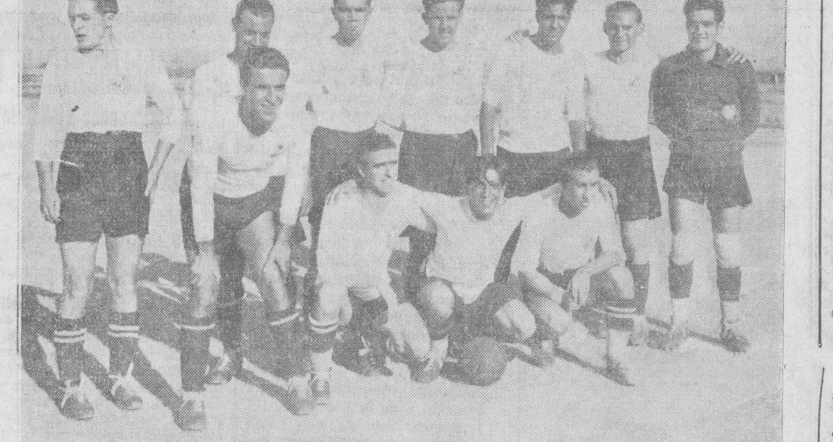
Los equipos del Patria y de la U. D. Salamanca que el domingo contendieron en el Campo de CaVARIO