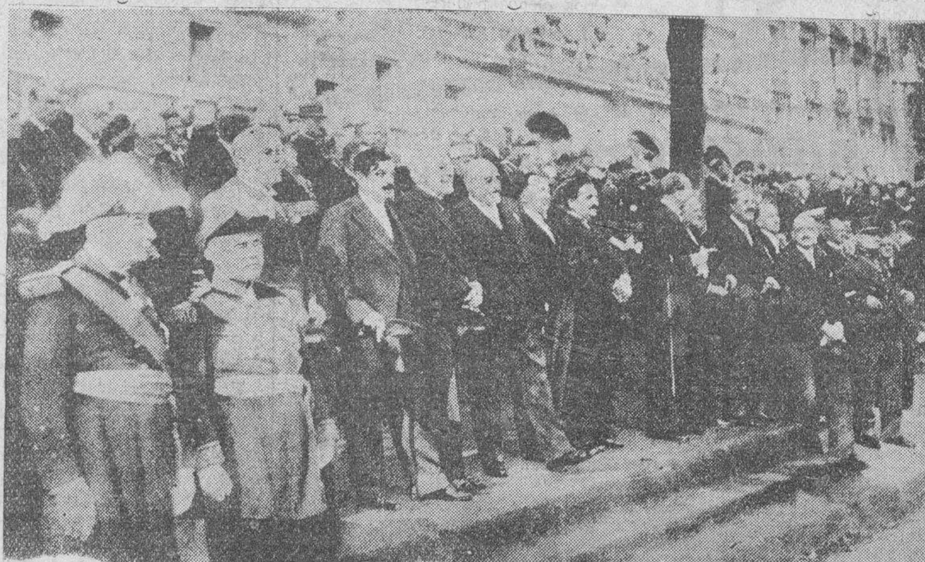
El Gobierno francés presenciando el desfile de las tropas en la gran fiesta militar celebrada el domingo último para conmemorar la toma de la Bastilla