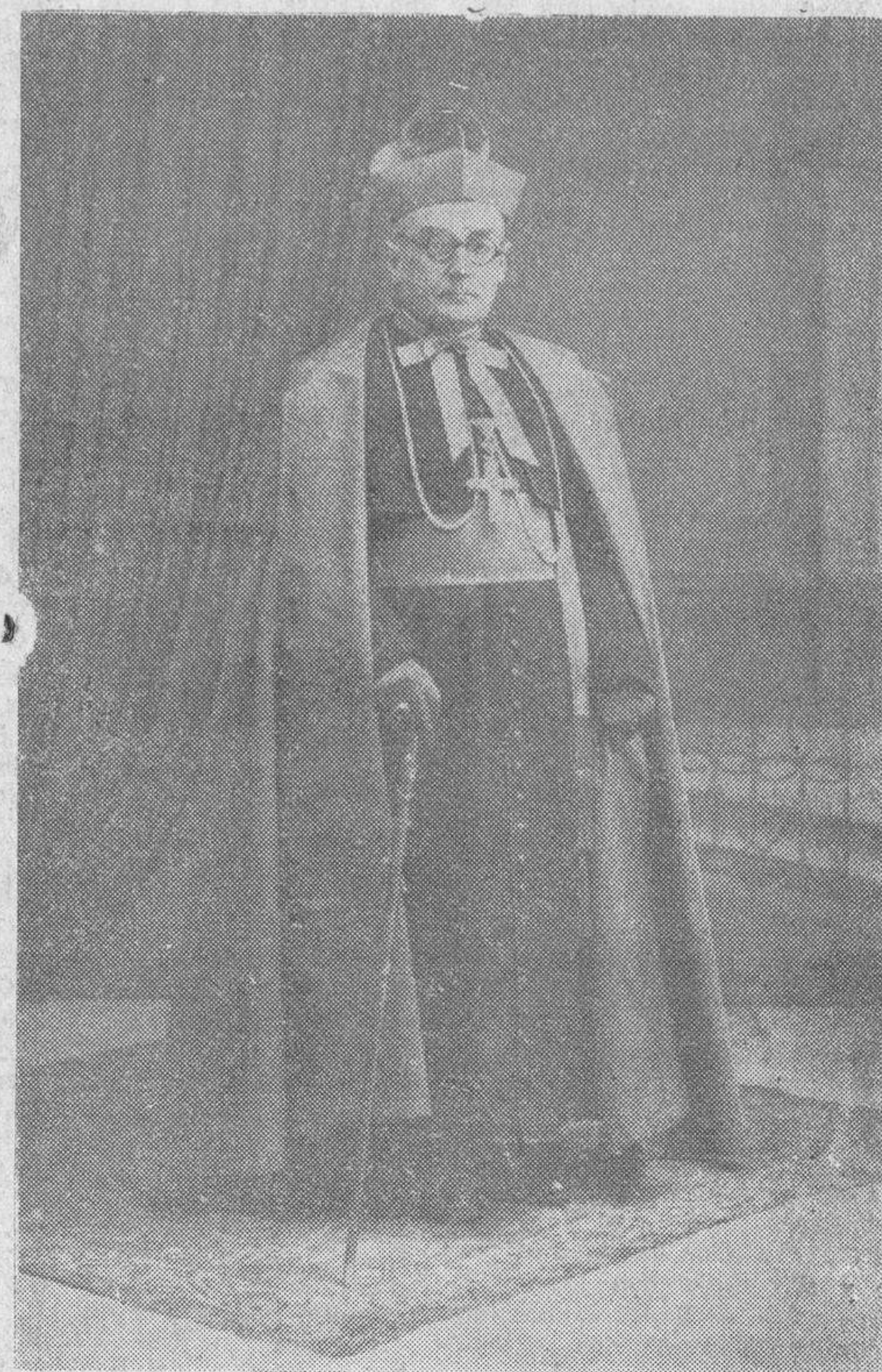
Una foto reciente del nuevo Obispo de Salamanca, Doctor Plá y Deniel, que hará su entrada en la Diócesis, pasado mañana, y al que se le prepara un grandioso recibimiento

"EL ADELANTO" ES EL PERIODICO DE MAYOR CIRCULACION DE LA PROVINCIA