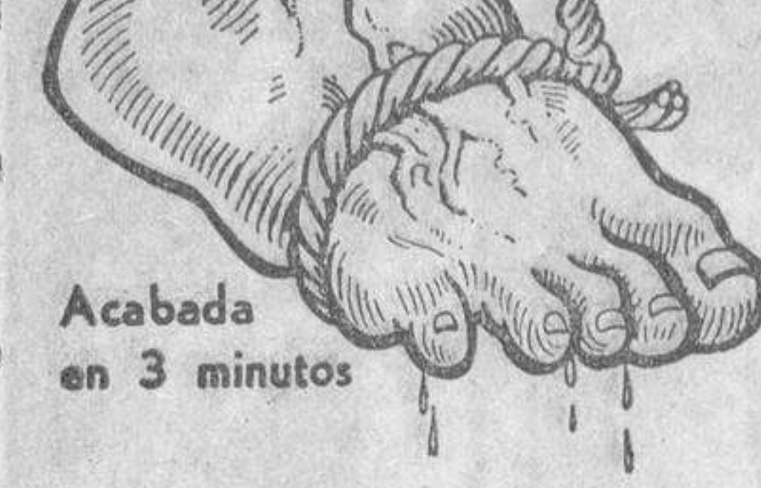
Acabada en 3 minutos

¡No se desespere usted, pues pasaron ya aquellos tiempos en que era inevitable aguantar un suplicio de tortura en los pies! Actualmente, puede usted librarse en el acto de las peores dolencias, quemazón y demás horrores en los pies sensibles, sea cual fuere la causa. Compre simplemente un paquete de Saltratos Rodell y eche un puñado de los mismos en agua caliente para un baño de pies. En el instante en que usted sumerja los pies en este baño oxigenado y curativo cesará toda inflamación en sus tejidos irritados, se restablecerá la circulación sanguínea de tal forma, que sus pies se encontrarán calmados y remozados. Con esta sencilla receta, diariamente millares de pacientes encuentran alivio en 3 minutos, cuando vivían desesperados por creer que no había medio de poner término a sus males de pies. Los callos y durezas se reblandecen, pudiendo extirparse por completo. Los Saltratos Rodell son de éxito seguro y por eso, podemos garantizar su resultado. Adquiera hoy mismo un paquete de estas maravillosas sales y empiece el tratamiento esta noche y se convencerá. Los Saltratos Rodell se recomiendan y venden, a un precio insignificante, en todas las farmacias, droguerías, perfumerías y centros de especícos.