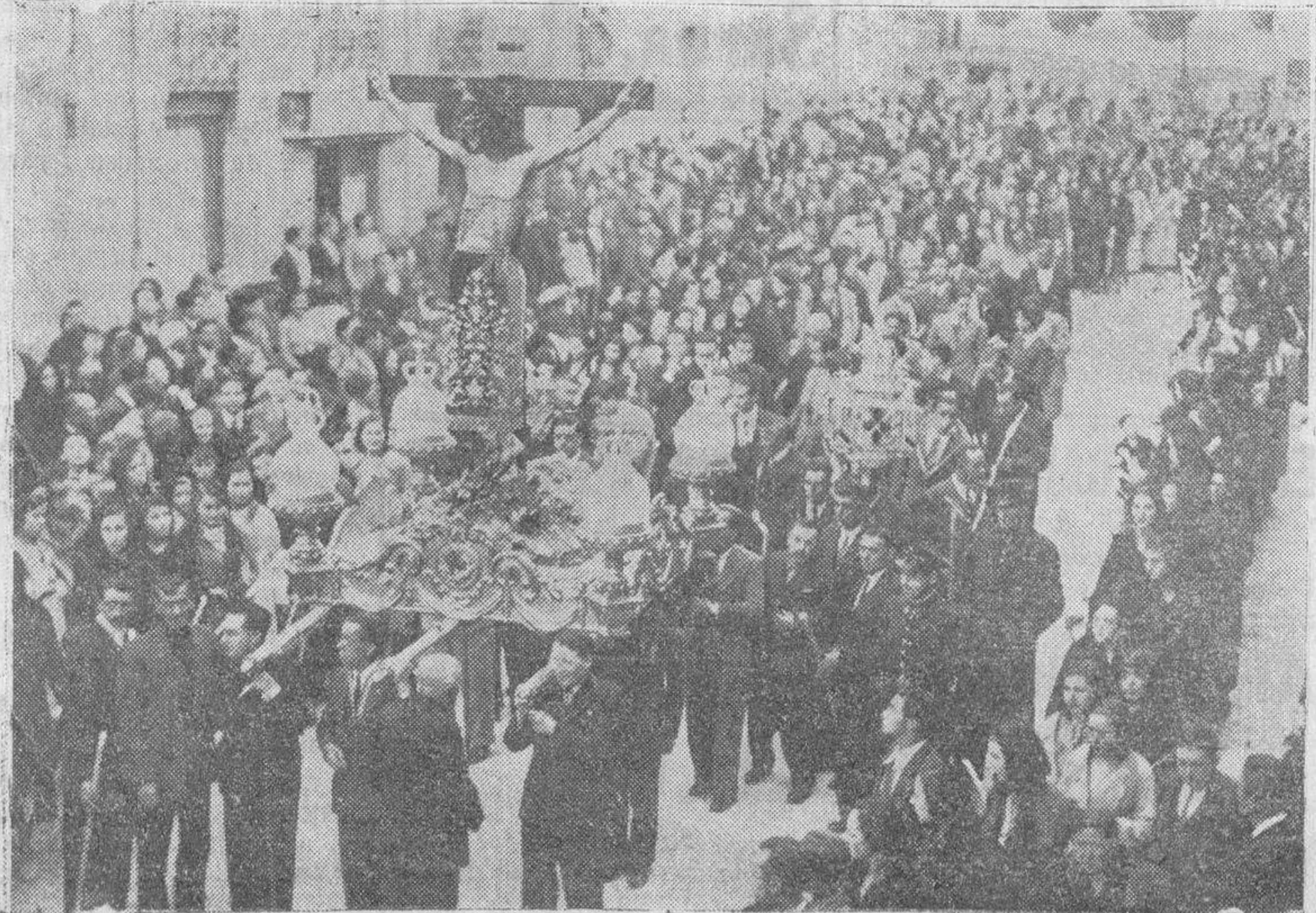
El paso de la procesión del Cristo de los Milagros por la calle del Doctor Risco