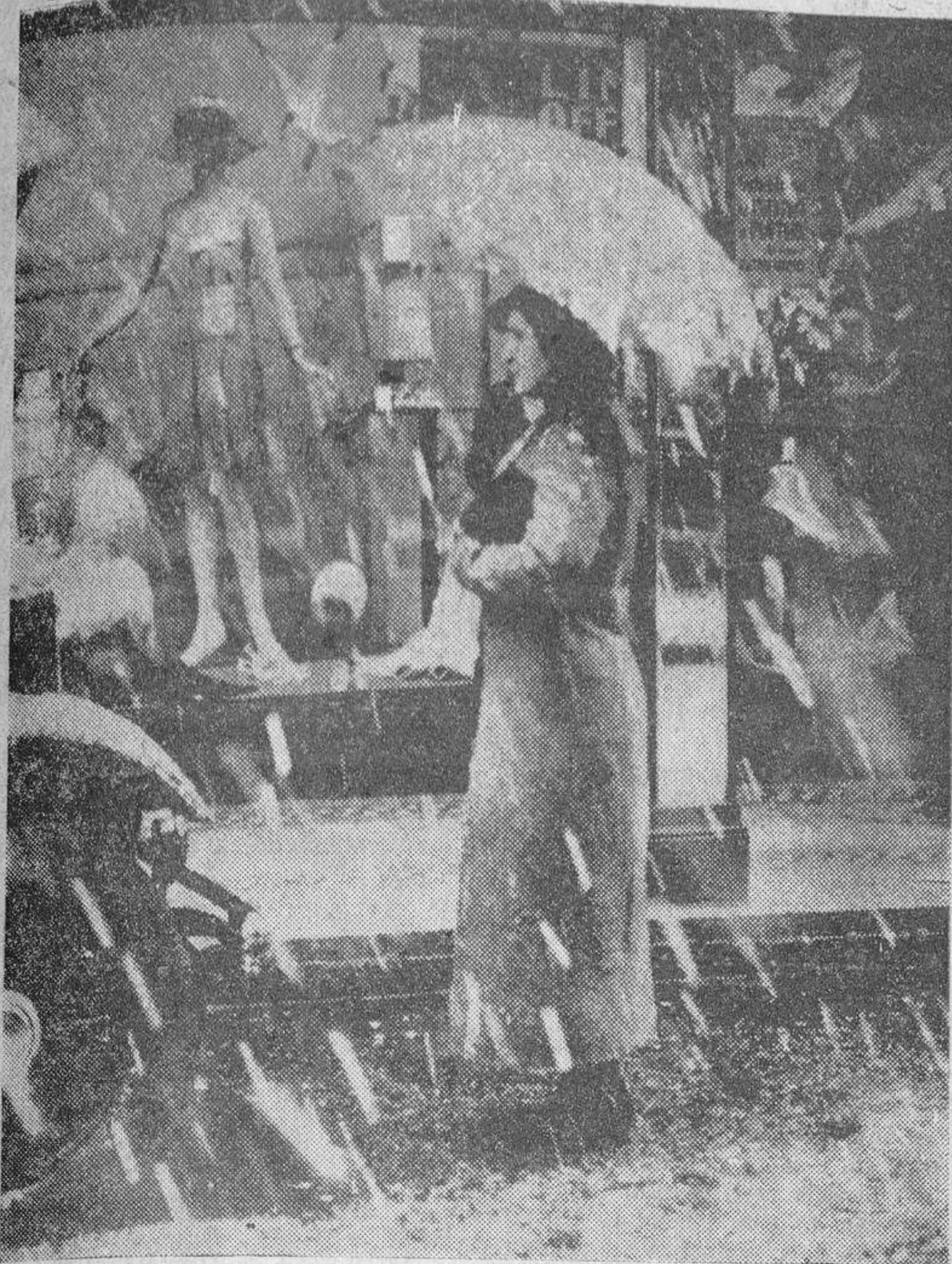
Como en todo el mundo, en Inglaterra ha vuelto el frío invernal, dando lugar, en Londres, a este contraste entre la nieve de la calle y los trajes de playa que anuncian los escaparates