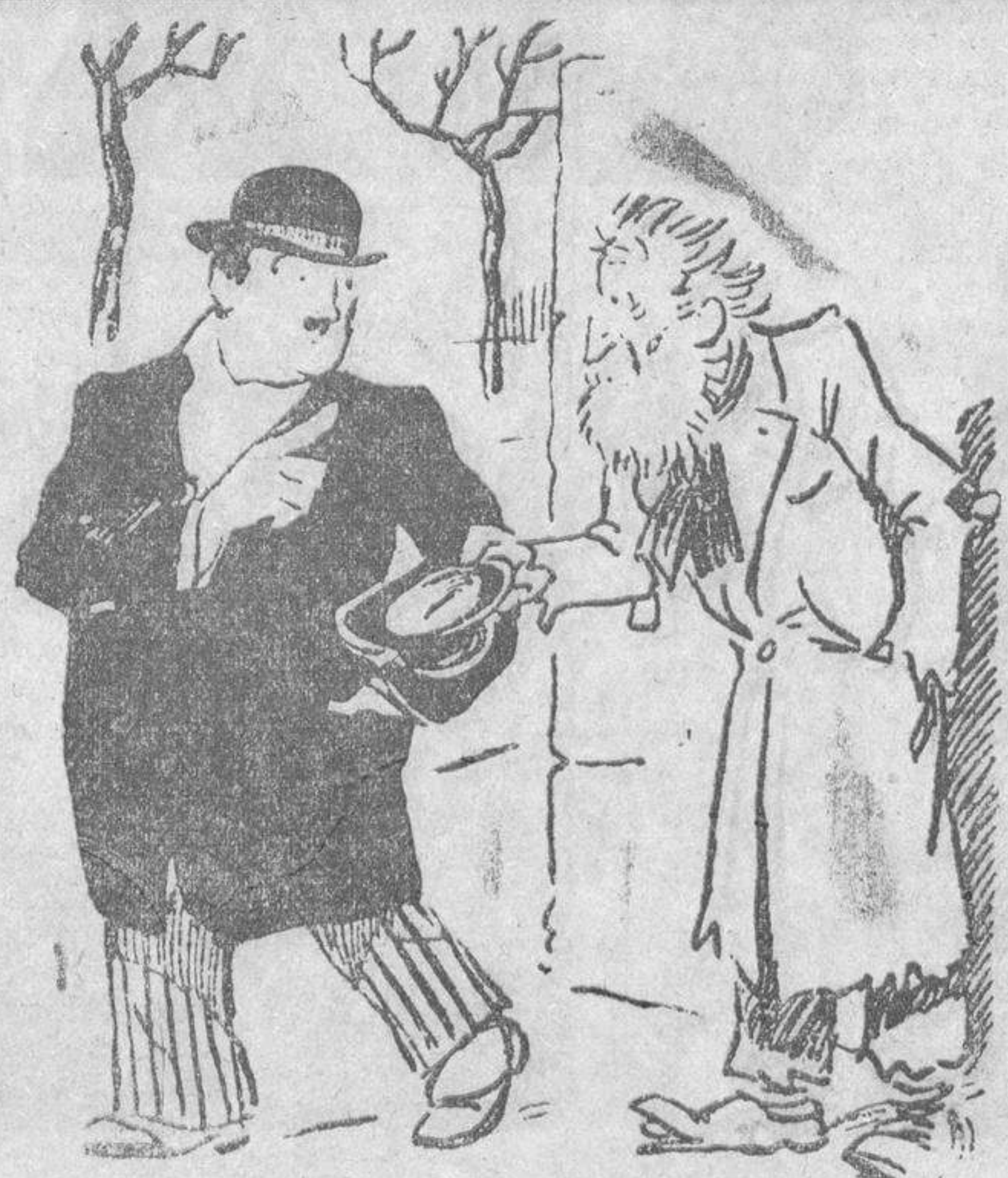
QUIEBRAS EN LOS NEGOCIOS

El dinero recaudado durante los días que las reliquias estén expuestas en Madrid antes de su traslado a Oviedo, se destinará para engrasar los fondos de la