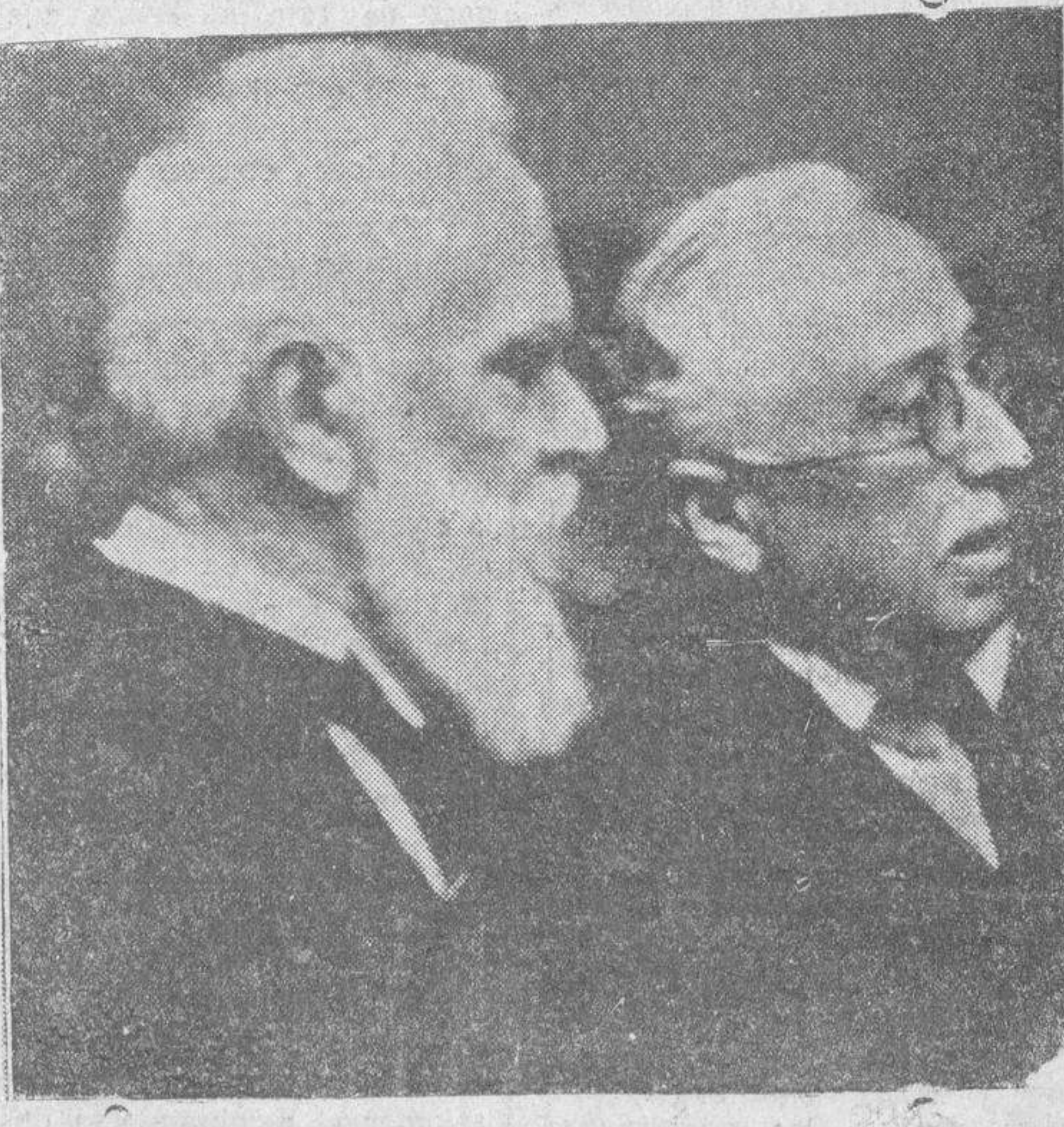
El Presidente de la República, con el insigne catedrático don Rafael Altamira, en el acto inaugural de la exposición de arte Inca, que se celebra en la Biblioteca Nacional, y de que ayer dimos cuenta