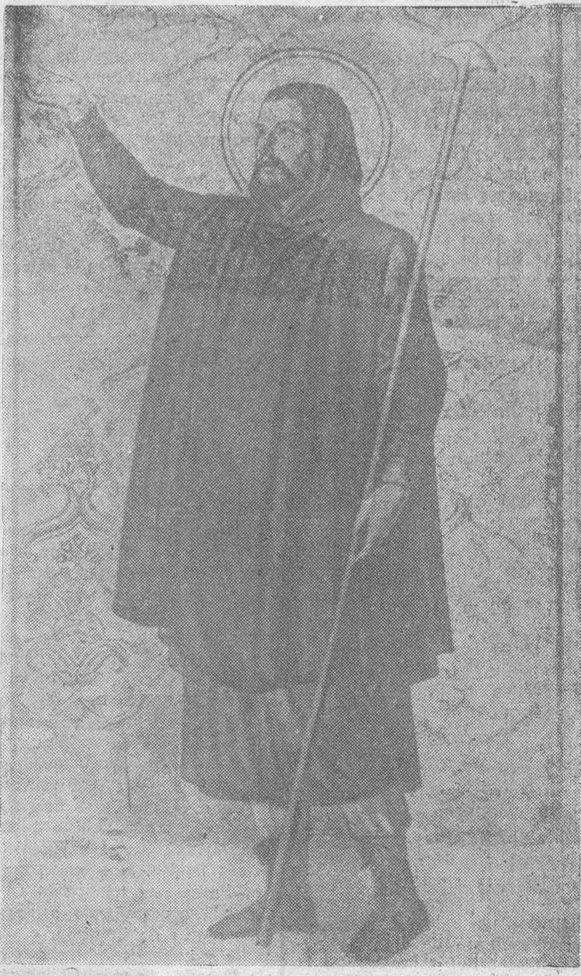
Imagen de San Isidro, cuadro del retablo mayor de la iglesia de San Jerónimo, de Madrid

falta para divertirse en sitio tan poco ameno y con un año galvanizando el mito y la romería de San Isidro que ha sido una gran atracción turística a base de los isidros lugareños, tan satirizados por Luis Taboada y de los isidros matritenses, mantenedores de la poesía chula del organillo, de la policromía del mantoncito de Ma-